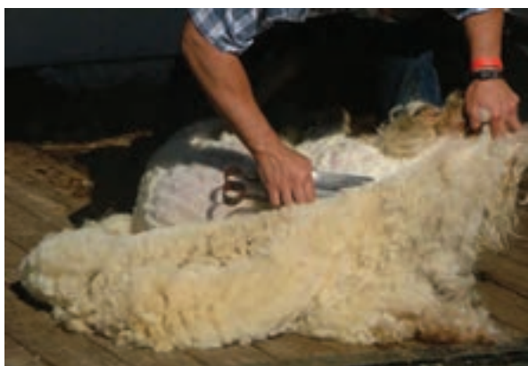
پشم‌چینی گوسفند با استفاده از دوکارد یا قیچی پشم‌چینی