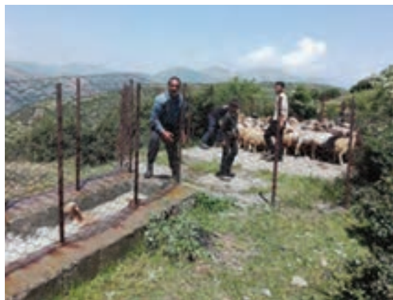
۱- قسمت انتظار