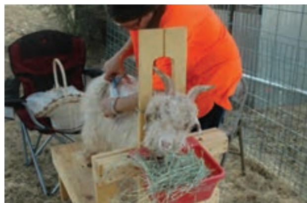
موجینی بز با استفاده از قیچی