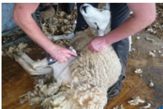
پشم‌چینی گوسفند با استفاده از ماشین پشم‌چین موتوری

برای حفظ مرغوبیت و بازارپسندی پشم باید از ابزارهایی استفاده نمود که پشم را به‌طور یکنواخت از بدن دام جدا نماید. در زیر به روش‌های مختلف اشاره شده است.