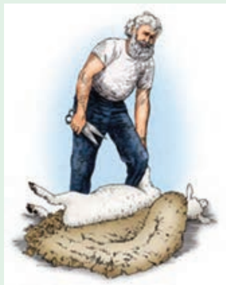
۱۵ در این قسمت نیمی از پشم‌چینی انجام شده است.