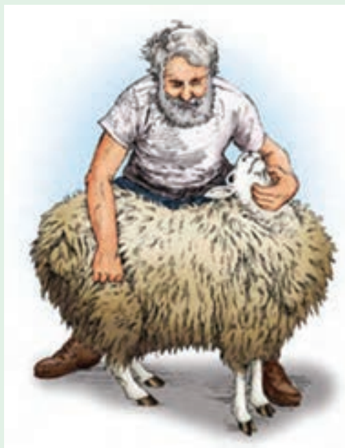
۳ با دست چپ زیر گردن گوسفند و با دست دیگر ران گوسفند را بگیرید.