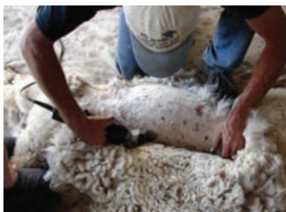
پشم‌چینی گوسفند با استفاده از ماشین پشم‌چینی برقی