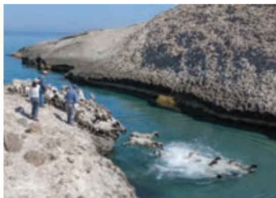
استفاده از منابع آب طبیعی برای شست‌وشوی گوسفند و بز