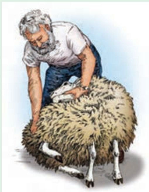
۴ سر گوسفند را در جهت عقربه ساعت خم کنید.