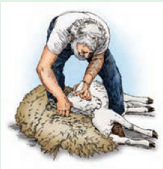
۱۶ یکی از گوش‌ها را با دست چپ نگه دارید و پشم‌چینی سمت راست گردن را انجام دهید.