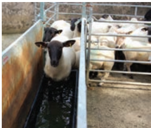
۲- راهرو یا گذرگاه