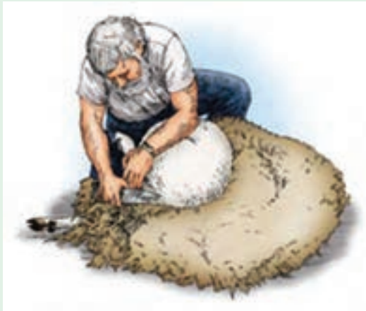
۱۴ با نگه داشتن پای چپ، امکان پشم‌چینی اطراف ناف فراهم می‌شود.