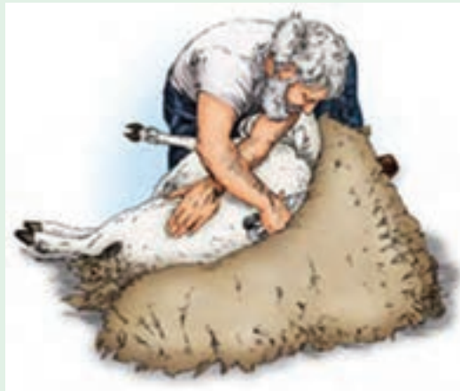
۱۳ در این موقعیت، پشم‌چینی ستون فقرات و چند سانتی‌متر اطراف آن را هم انجام دهید.