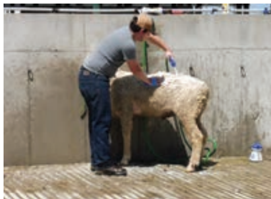
استفاده از شیلنگ آب برای شست‌وشوی گوسفند یا بز