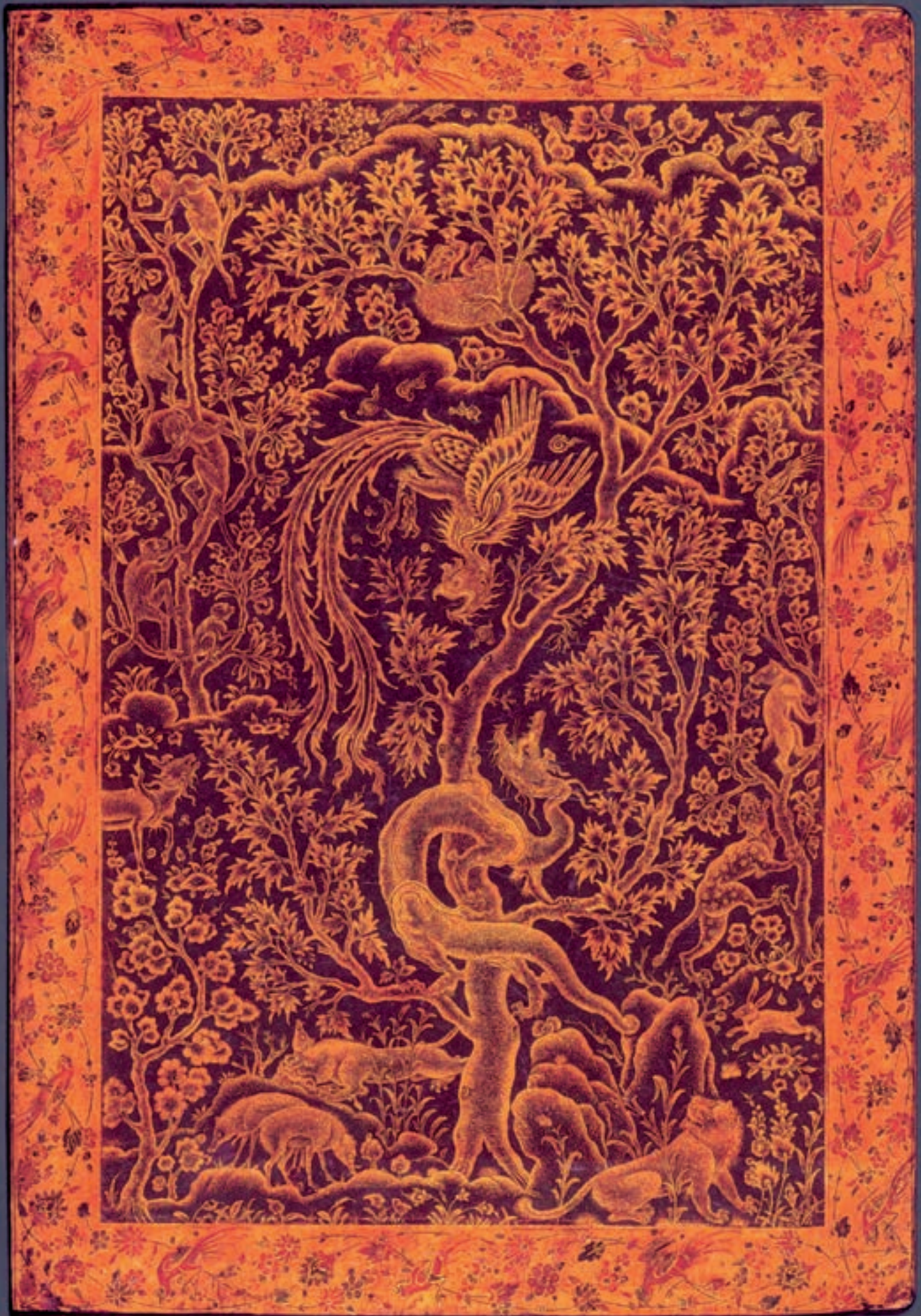
تصویر ۸ - گرفت و گیر سیمرغ و ازدها، جلد روغنی (اندرونی)، احسن الکبار، سال ۸۳۷ هجری قمری، کاخ گلستان