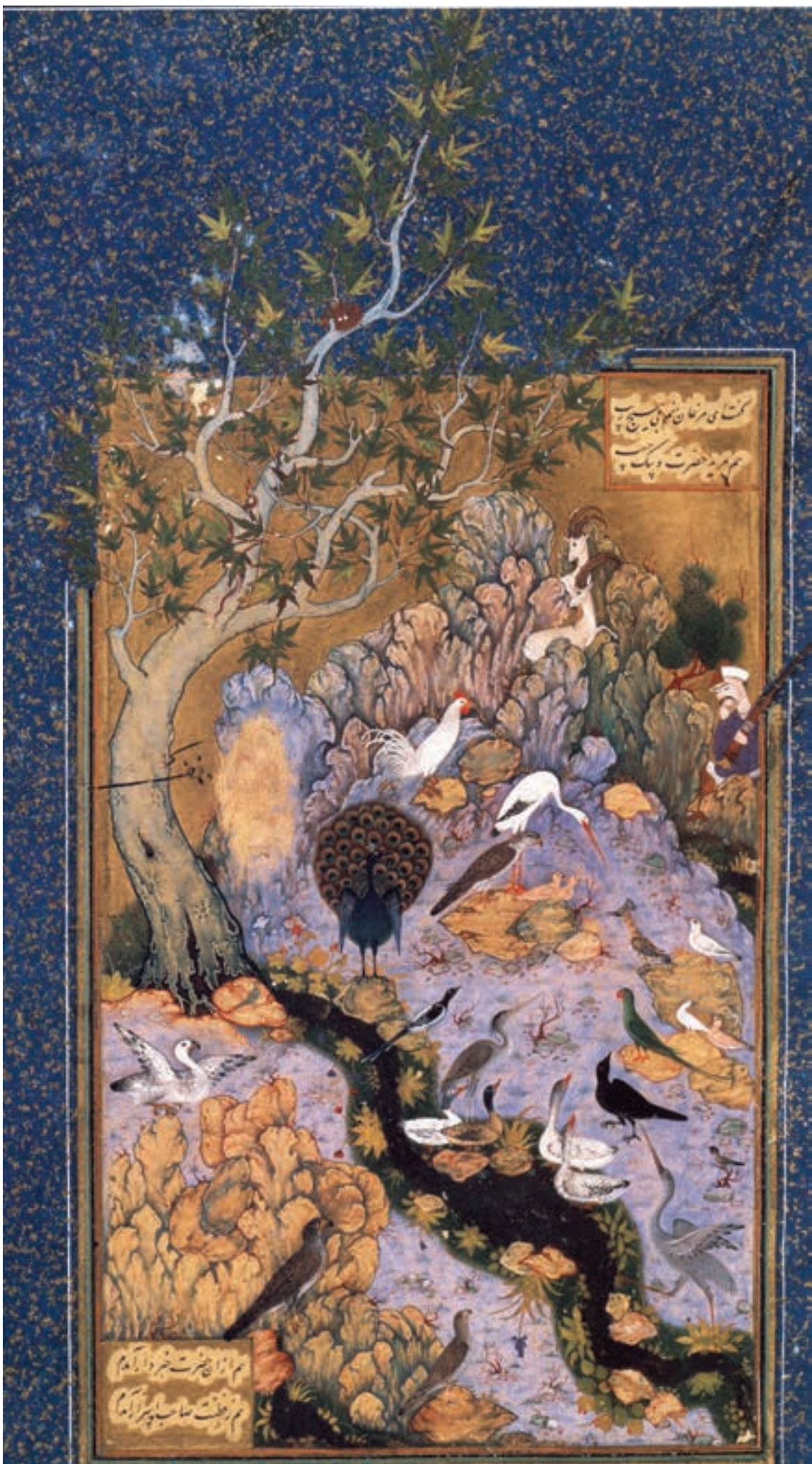
تصویر ۷- تجمع پرندگان قبل از هدهد، منطق الطیر عطار، مکتب اصفهان، قرن دهم هجری، موزه متروپولیتین