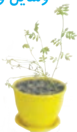
دو گلدان عدس