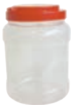
دو ظرف پلاستیکی شفاف و دردار