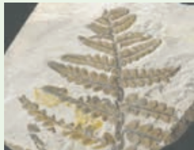
فسیل گیاه سرخس