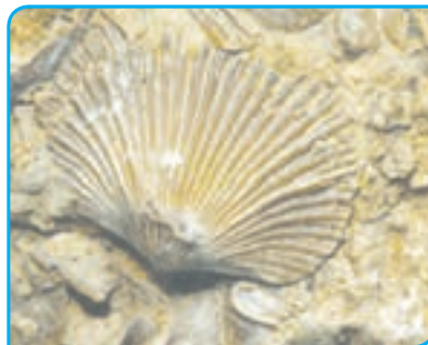
ب) فسیل صدف