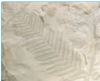
پ) فسیل گیاه

دانشمندان معتقدند که وقتی جاندارى می‌میرد، قسمت‌های نرم بدن آن با گذشت زمان از بین می‌رود اما قسمت‌های سخت، مانند استخوان، دندان و صدف، در بین گل و لای باقی می‌ماند. به آثار و بقایای گیاهان و جانوران که پس از سال‌ها به جا مانده است، فسیل می‌گویند. در شکل زیر، تصویر چند فسیل نشان داده شده است.