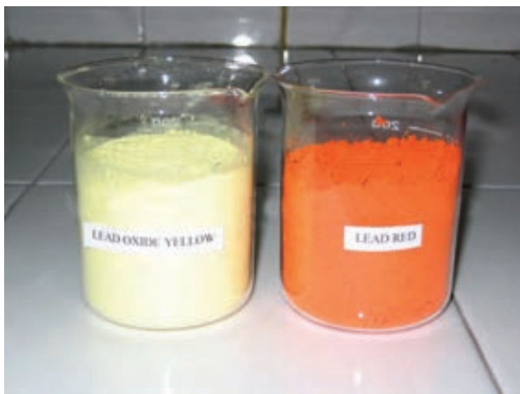
شکل ۸-۱۱- پودر سرنج

۴-۵-۱۱- مواد اولیه‌ی سمی: در مجموعه‌ی مواد اولیه‌ی محلول یا غیر محلول در آب ممکن است مواد اولیه‌ی سمی وجود داشته باشد. مواد غیر محلول در آب حاوی سرب مانند سرنج (شکل ۸-۱۱)، اکسید سرب سفید، هم‌چنین، ترکیباتی نظیر کروم اکسید، باریم کربنات و آرسنیک اکسید و غیر آن‌ها، و مواد اولیه محلول در آب مانند سدیم کربنات، سرب استات و موادی که حاوی کروم‌اند مانند کروم اکسید (عامل رنگ‌کننده)، اگر به‌طور مستقیم در لعاب استفاده شوند و یا تنفس شوند و یا به‌نحوی وارد خون شوند، برای سلامتی مضر هستند. روش غیرسمی نمودن این ترکیبات سمی نیز به‌صورت فریت درآوردن آن‌هاست. نحوه‌ی ساخت فریت را با هم خواهیم آموخت.