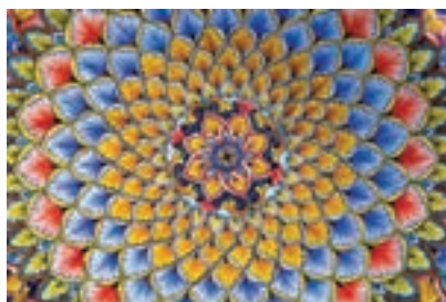
شکل ۴-۱۱- نمونه‌ای از استفاده از استین‌ها (رنگینه) در لعاب فلز

در شکل ۴-۱۱ یک نمونه‌ی فلزی تزیین‌شده با لعاب‌های رنگی و در شکل ۵-۱۱ لعاب‌های رنگی اعمال شده بر قطعات سرامیکی را مشاهده می‌کنید.