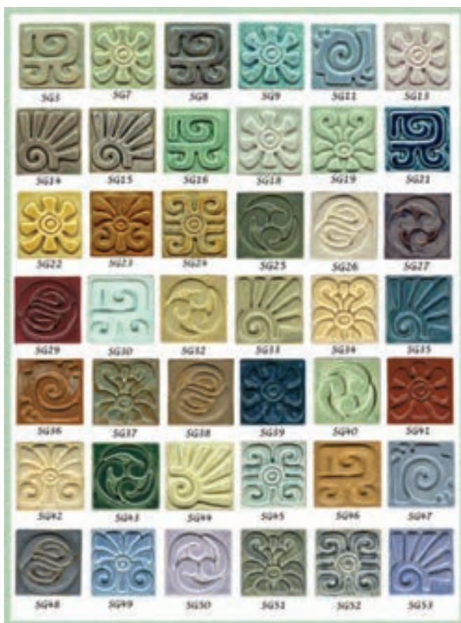
شکل ۵-۱۱- نمونه‌های لعاب رنگی