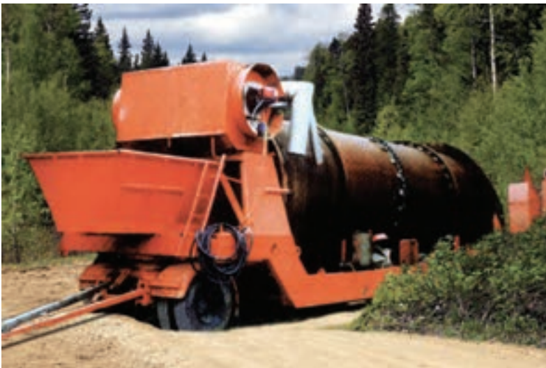
شکل ۹-۱۱- کوره‌ی فریت‌سازی

مواد اولیه‌ی محلول در آب و مواد سمی، پس از توزین دقیق، براساس فرمول، با یک‌دیگر به‌صورت خشک کاملاً مخلوط می‌شود (هموزن) و در کوره‌های فریت‌سازی (شکل ۹-۱۱) در دمای مناسب معمولاً بیش از 1200^{\circ} درجه سلسیوس ذوب می‌گردد. مذاب در آب سرد تخلیه می‌شود و به قطعات ریز شیشه‌ای تبدیل می‌گردد. پس از خشک کردن و افزودن کائولن لازم جهت تعلیق و افزودن آب فریت را در آسیاب به‌صورت ترساب یا خشک‌ساب نرم می‌کنند تا دوغاب مناسب حاصل شود و متناسب با نوع بدنه با روش مناسب بر روی قطعات اعمال گردد.