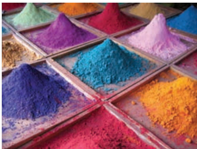
شکل ۳-۱۱- رنگینه‌های مورد استفاده در ساخت لعاب

از ترکیبات قلیایی نیز برای کاهش دادن دمای ذوب استفاده می‌شود. هم‌چنین، جهت ایجاد رنگ در لعاب‌ها از برخی اکسیدها که در ترکیب با مواد اولیه‌ی لعاب رنگ‌های مختلف ایجاد می‌کنند، کمک می‌گیرند. در مواردی نیز از رنگینه‌ها (استین‌ها) که تلفیقی از چند اکسیدند جهت ایجاد رنگ در لعاب استفاده می‌کنند. خصوصیت رنگینه‌ها پایداربودن رنگ آن‌ها در هنگام پخت لعاب در دماهای بالاست. در شکل ۳-۱۱، تعدادی رنگینه مورد استفاده در ساخت لعاب را مشاهده می‌کنید. دکور لعاب‌ها را می‌توان به‌صورت زیرلعابی، داخل لعابی و رولعابی انجام داد. جهت تأمین اکسید پتاسیم ( \text{K}_2\text{O} )، اکسید سدیم ( \text{Na}_2\text{O} ) و اکسید کلسیم ( \text{CaO} ) از انواع فلدسپات‌های پتاسیم، سدیم، کلسیم، ولستانتیت و نفلین سیانیت استفاده می‌شود، که همگی در آب غیرمحلول‌اند.