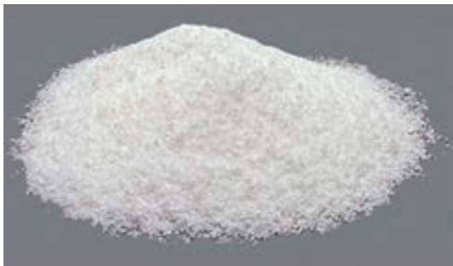
شکل ۷-۱۱- براکس بودری