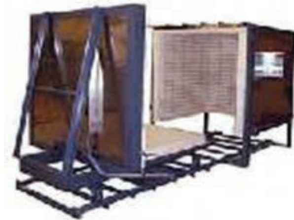
شکل ۱-۵- خشک کن متناوب

از خشک کن های متناوب، اغلب در جاهایی استفاده می شود که ظرفیت تولید پایین می باشد. انرژی گرمایی مورد نیاز این نوع خشک کن ها معمولاً از انرژی گرمایی مازاد کوره های پخت سرامیک تأمین می گردد. نیاز به تعداد بیشتر نیروی انسانی در چیدمان و راه اندازی خشک کن های متناوب و مصرف انرژی گرمایی زیاد در مقایسه با خشک کن های مداوم، از نقاط ضعف عمده ی آنها محسوب می شود (شکل ۱-۵).