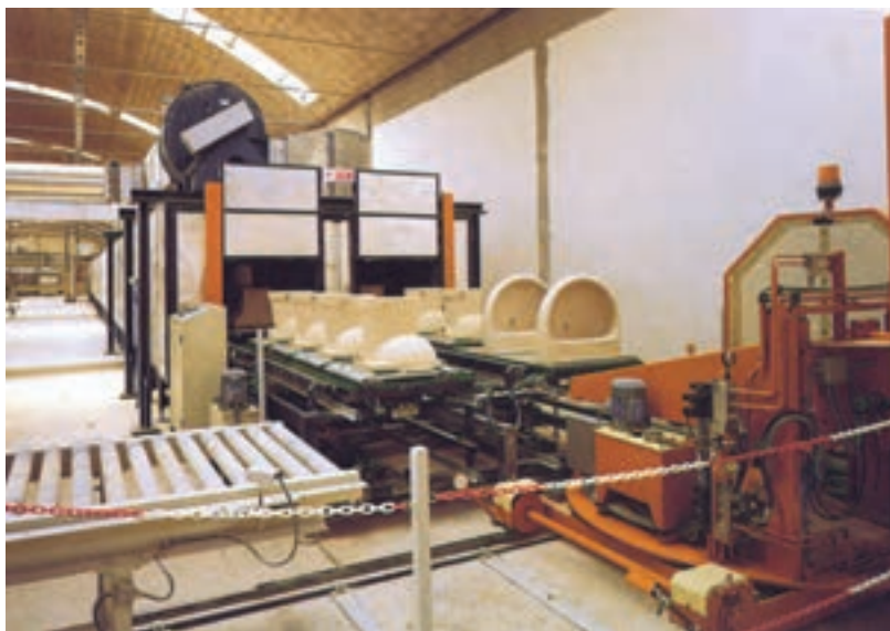
شکل ۳-۵- خشک‌کن مداوم برای چینی بهداشتی

۱-۳-۵ - خشک‌کن‌های عمودی: خشک‌کن‌های عمودی، کانال‌هایی هستند که محصولات سرامیکی در آن‌ها برای خشک شدن، از پایین تا ارتفاع بالا حرکت می‌کنند. به عبارت دیگر، محصولات سرامیکی در داخل محفظه‌ی خشک‌کن به طور قائم به طرف بالا حرکت می‌کنند، سپس به طرف پایین هدایت می‌شوند، و در اثر قرار گرفتن در معرض گرمای ناشی از دمنده‌های هوای داغ، خشک می‌شوند.