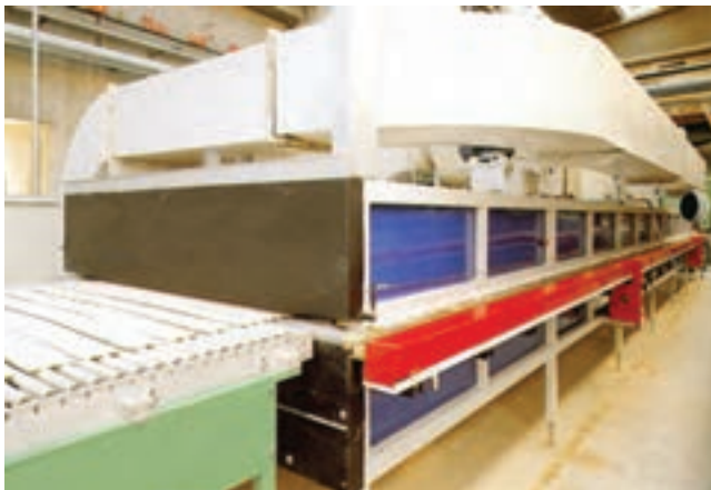
شکل ۲-۵- خشک‌کن مداوم صنعت کاشی

در کارخانجات انرژی گرمایی مورد نیاز این نوع خشک‌کن‌ها، انرژی گرمایی هم از انرژی مازاد کوره‌های پخت سرامیک و هم از منبع جدا و اختصاصی، تأمین می‌گردد (شکل‌های ۲-۵ و ۳-۵).