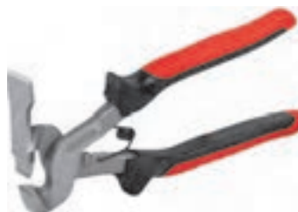
شکل ۳-۴ ▲