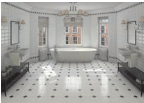
شکل ۴-۲ ▲

کاشی لعابی اغلب برای پوشش دیوارهای اماکن مذهبی، تابلوهای تزئینی، بدنه آشپزخانه، حمام، سرویس‌های بهداشتی، رخت‌شوی‌خانه و سایر آبریزگاه‌ها به مصرف می‌رسد. همچنین نوعی از آن که به نام کاشی کف مشهور است، برای کف‌پوش این فضاها به کار می‌رود. کاشی‌های لعابی معمولاً مربع یا مستطیل هستند. شکل (۴-۲)