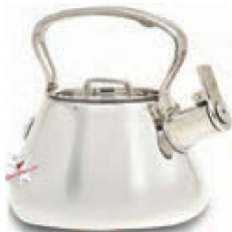
قوری با لوله کم ارتفاع (تصویر ۴-۴)

- طراح تصویر ۴-۴ چه اصلی را در طراحی فراموش کرده است؟ توضیح دهید.