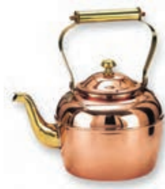
کتری فلزی (تصویر ۴-۵)

- در تصویر یک گلدان سرامیکی را می‌بینید. به نظر شما ساخت این گلدان با چه روشی ممکن است؟ آیا اگر