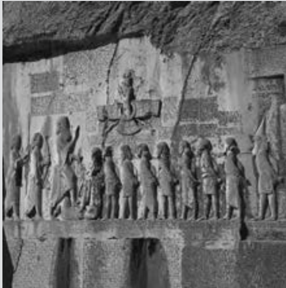
تصویر سنگ نگاره داریوش در بیستون

در سمت چپ نقش برجسته تصویر تمام قد داریوش قرار دارد و دوتن از یاران او پشت سرش ایستاده‌اند. در روبه‌روی او نه تن از سران شورشی به بند کشیده به چشم می‌خورند که در جلوی آنها گئومات مغ به پشت خوابیده و پای چپ داریوش بر سینه او نهاده شده است. درست بالای سرشورشیان، نگاره فروهر (نماد اهورامزدا) حک شده است که حلقه‌ای را در دست چپ دارد و به سوی داریوش دراز کرده است. این امر نشان اعطای پادشاهی توسط اهورامزدا به داریوش است.