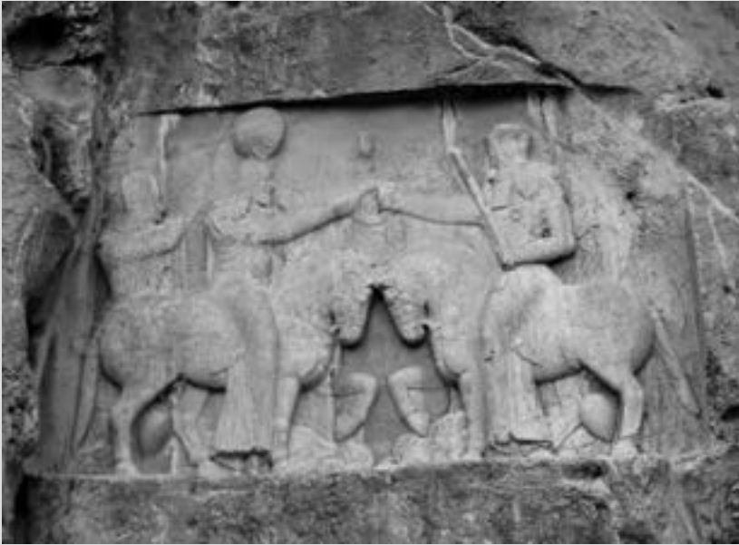
تصویر نقش برجسته هورا مزدا و اردشیر بابکان در نقش رستم

این سنگ نگاره یکی از سالم‌ترین سنگ نگاره‌های متعلق به دوره ساسانی است. پیکره‌های اردشیر (سمت چپ) و هورامزدا سوار بر اسب کند و کاری شده‌اند. در زیر پای اسبان، پیکره‌های بر زمین افتاده دشمنان هورامزدا و شاه یعنی اهریمن و اردوان پنجم اشکانی تصویر شده‌اند. هورامزدا دست راستش را به سوی اردشیر دراز کرده و دیهیم یا حلقه‌ای از گل را که نماد فره ایزدی است، به او اهدا می‌کند و در دست چپ او برسم ۱ دارد. نقش برجسته‌های دیگری از هورامزدا و اردشیر با مضمونی شبیه به این. در نقش رجب و فیروز آباد فارس نیز وجود دارد.