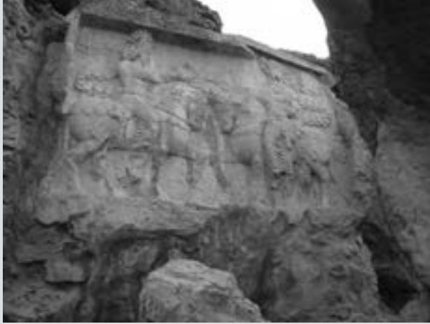
نقش برجسته اهورامزدا و شاپور اول ساسانی در نقش رجب