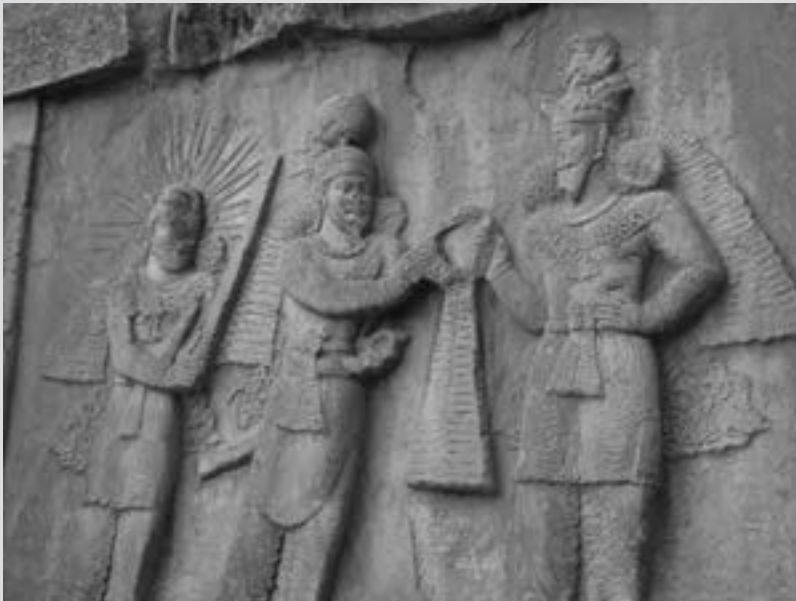
نقش برجسته اهورامزدا و اردشیر دوم ساسانی در طاق بستان

در سمت راست ایوان کوچک طاق بستان، یک سنگ نگاره از اهورامزدا و اردشیر دوم (۳۷۹-۳۸۳ م) نهمین شاه ساسانی وجود دارد. اردشیر با دست راست در حال گرفتن دیهیم شاهی از اهورا مزداست.