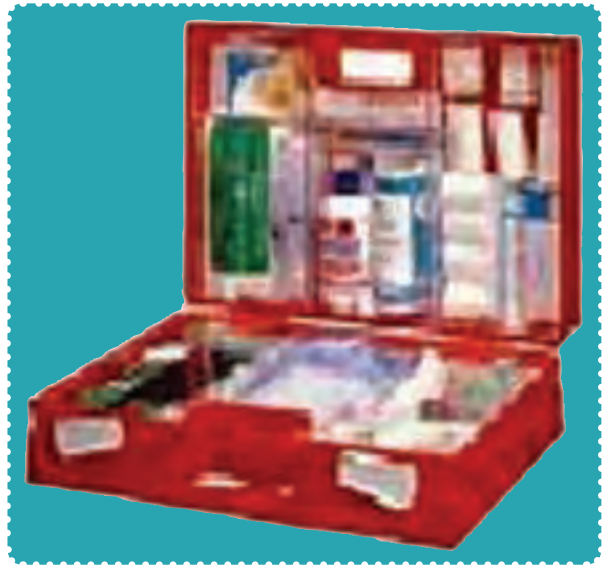
جعبه کمک‌های اولیه