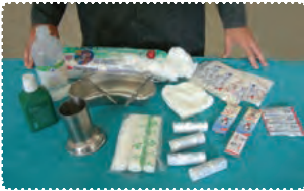
وسایل مورد نیاز در جعبه‌ی کمک‌های اولیه

در حرفه‌های گوناگون استفاده از ابزارها و مواد اولیه همواره می‌تواند برای افراد خطرهایی به وجود بیاورد. استفاده‌ی صحیح و داشتن دقت فراوان هنگام کار، این خطرها را از بین برده و فرد در امان خواهد بود. به همین دلیل لازم است در محیط کارگاه برای جلوگیری از خطرهایی احتمالی به موارد زیر دقت داشته باشید. ۱- در مواقع ضروری از جعبه کمک‌های اولیه‌ی کارگاه استفاده کنید.