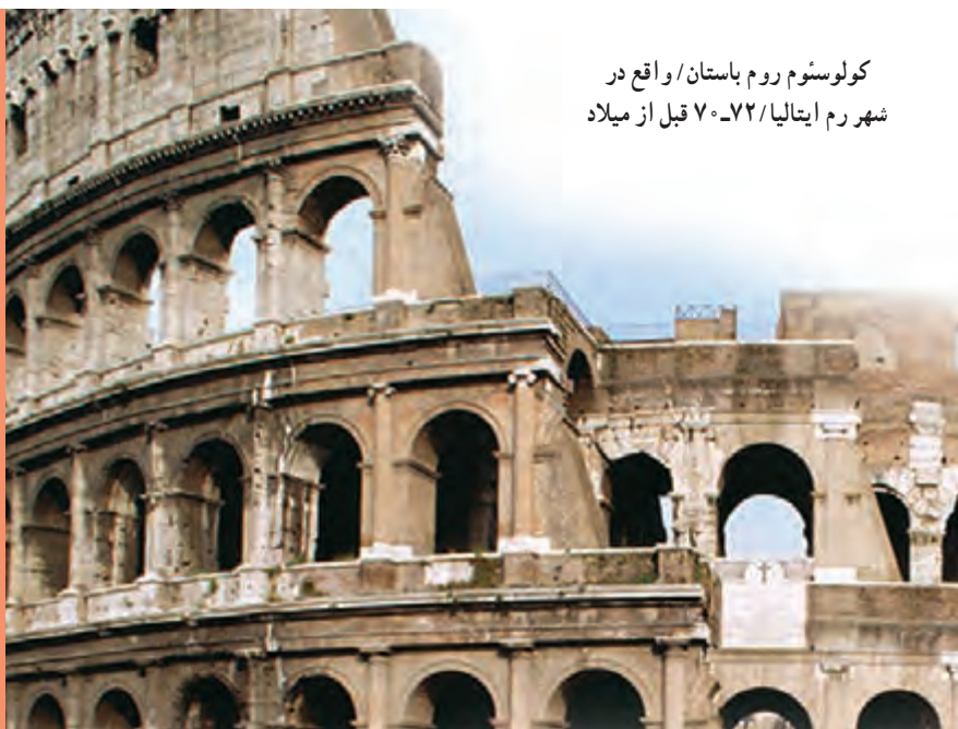
کولوسئوم روم باستان/ واقع در شهر رم ایتالیا/ ۷۲-۷۰ قبل از میلاد

«پیش از شما، سنت‌هایی وجود داشت (و هر قوم، طبق اعمال و صفات خود، سرنوشت‌هایی داشتند که شما نیز، همانند آن را دارید). پس در روی زمین گردش کنید و ببینید سرانجام تکذیب‌کنندگان (آیات خدا) چگونه بوده است؟!»