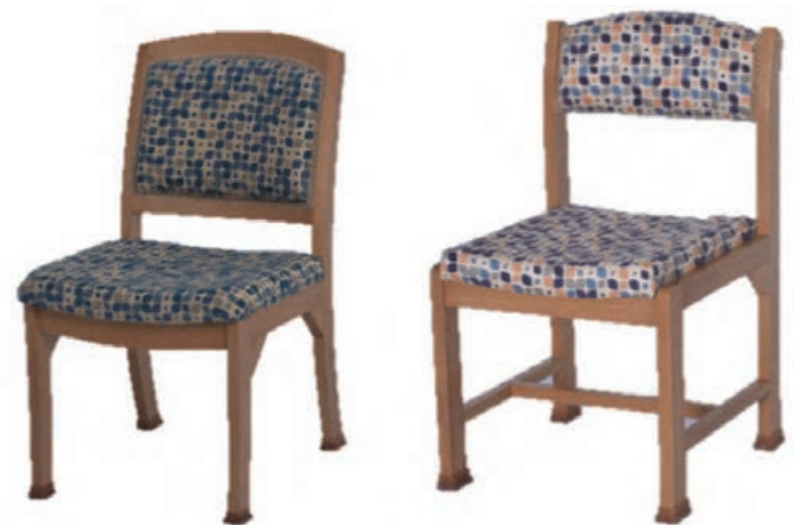
شکل ۱- دو نوع صندلی از نظر قرار گرفتن کفی روی قیدها (سمت راست) و داخل قیدها (سمت چپ)

صندلی‌های ساده یا بی‌دسته مانند صندلی غذاخوری را می‌توان آسان‌تر رویه‌کوبی کرد زیرا فقط کف آن به پوشش رویه‌کوبی نیاز دارد (شکل ۱).