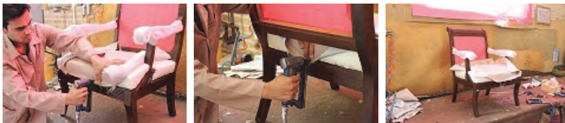
شکل ۳۶- کوبیدن پارچه کف مبل

۶- برش و نصب پارچه: پارچه نهایی را برش دهید این پارچه باید از قسمت طول و عرض مبل ۱۰ سانتی‌متر بیشتر باشد تا به صورت دو لایه بر روی کف مبل کوبیده شود. عمل کوبیدن پارچه نهایی باید با دقت زیادی صورت گیرد تا از ایجاد چین و چروک و گودی بر روی مبل جلوگیری شود. پارچه نهایی را با منگنه بادی روی عرض قید مبل بکوبید (شکل ۳۶).