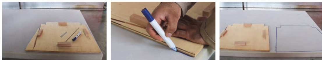
شکل ۳- اندازه‌گیری و خط‌کشی کفی صندلی

می‌توانید تخته را روی اسفنج قرار داده و دور تا دور آن را خط‌کشی کنید.