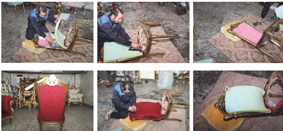
شکل ۳۷- مراحل رویه‌کوبی پشتی صندلی

برای پشتی مبل ابتدا باید گونی پلاستیکی به اندازه لازم برش داده شود. گونی را باید به وسیله منگنه بادی طوری روی ضخامت کلاف پشتی نصب کرد که بعد از پرس شدن به وسیله ابر در پشت تکیه‌گاه قرار گیرد. در بیشتر مواقع رویه کوب‌ها از زدن گونی خودداری کرده و پارچه نهایی پشت مبل رانصب می‌کنند. (این کار اصولی و اخلاقی نبوده و کیفیت مناسب رویه‌کوبی را نخواهد داشت) اکنون باید اسفنج ۴ یا ۶ سانتی‌متری مرغوب را که قبلاً قالب‌گیری و از روی الگو بریده و آماده کرده‌اید، به وسط پشت گونی چسب خورده گذاشته و فشار دهید تا انحنا در وسط پشتی ایجاد شود؛ (این انحنا را می‌توانید با اضافه کردن ضایعات تودوزی ماشین در زیر اسفنج اصلی ایجاد کنید) که این انحنا بعد از رویه‌کوبی فوق‌العاده زیبا خواهد بود. این مراحل در شکل‌های ۳۷ نشان داده شده است.