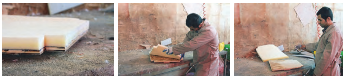
شکل ۵- چسباندن اسفنج روی کفی صندلی

چسباندن اسفنج: سطح تخته، همچنین سطح اسفنج را باید با چسب فوم (اسفنج) آغشته کرد به طوری که لایه نازکی از چسب روی هر دو طرف پاشیده شود. پس از چسب زنی، اسفنج را روی تخته بچسبانید و مراقب باشید که اسفنج صاف قرار گرفته و کاملاً روی کفی بچسبد.