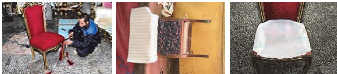
شکل ۳۴- بارگیری پنبه دانه

در این مرحله از رویه‌کوبی که به عملیات بارگیری در رویه‌کوبی مبل معروف است، پنبه‌دانه یا پُرز قالی به مقدار لازم که بستگی به مبل دارد (کیفیت مبل، ابعاد مبل) روی گونی کنافی ریخته می‌شود به طوری که کف مبل حالت عدسی محدب به خود بگیرد یعنی کناره‌ها گودتر و وسط مبل بلندتر باشد. پنبه‌دانه (ویسکوز) معمولاً ۳ تا ۵ سانتی‌متر به صورت فشرده ریخته می‌شود. پنبه‌دانه‌ها که برای مبل استفاده می‌شود حالت فشرده‌گی دارد تا بعد از استفاده کوتاه مدت از مبل نرمی آن از بین نرود (شکل ۳۴).