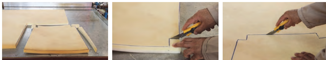
شکل ۴- برش کاری اسفنج کفی صندلی

چسباندن اسفنج: سطح تخته، همچنین سطح اسفنج را باید با چسب فوم (اسفنج) آغشته کرد به طوری که لایه نازکی از چسب روی هر دو طرف پاشیده شود. پس از چسب زنی، اسفنج را روی تخته بچسبانید و مراقب باشید که اسفنج صاف قرار گرفته و کاملاً روی کفی بچسبد.