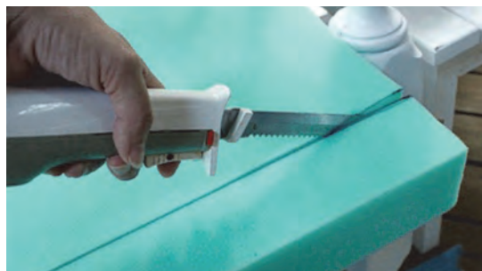
شکل ۳۵- اسفنج بری

- باتوجه به پیشرفت تکنولوژی درحال حاضر به جای لفاف کاری و پنبه دانه از اسفنج با ضخامت‌های زیاد و فوم