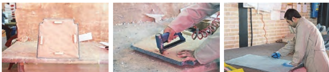
شکل ۳۳- مراحل گونی‌کشی

۳- گونی‌کشی: گونی کنفی را باید به اندازه موردنیاز برش داد. اندازه گونی باید طوری باشد که بعد از پهن کردن آن روی فنرها، از هر طرف ۲ سانتی‌متر از کف مبل بیرون بزند تا بتوان با منگنه به صورت دولا به ضخامت کف مبل کوبید. گونی باید به صورت آزاد قرار گرفته و بتواند تحمل رفت و برگشت فنرها در موقع نشستن روی مبل را داشته باشد. این گونی به منظور آماده کردن مبل برای بارگیری نصب می‌شود (شکل ۳۳).