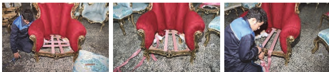
شکل ۲۹- مراحل تسمه کشی

مبل) بعد از دولاکردن سر نوار (هنگام کشیدن نوار مراقب باشید در اثر فشار و کشیدگی نخ کش نشود) با منگنه کوب بکوبید.