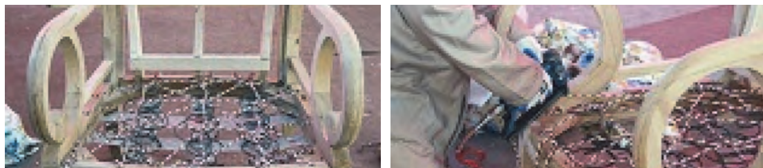
شکل ۳۱- مراحل فنربندی

بعد از دوخته شدن فنر در جای خود (به تعداد مورد نیاز) آنها را به وسیله نخ مغزی (که در مورد آن توضیح داده شد) به هم وصل می‌کنند. به این صورت که ابتدا یک سر نخ مغزی را با منگنه کوب به ضخامت کف مبل نصب نموده و بعد آن را از روی فنر عبور می‌دهند و به آن گره می‌زنند.