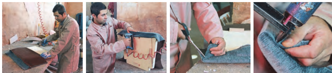
ثابت کردن پارچه

نصب پارچه: یک طرف پارچه را بر پشت تخته کشیده و با دستگاه منگنه‌زن (دستی یا نیوماتیک) دو یا سه منگنه بکوبید؛ سپس پارچه را به روی اسفنج آورده و طرف مقابل منگنه خورده را بکشید و با فشار دست آن را نگه داشته دقیقاً مقابل منگنه‌های قبلی، دو منگنه بزنید. در ادامه، دو طرف دیگر را به روش گفته شده نصب کنید. وقتی هر ۴ طرف را منگنه زدید، باید قسمت‌های دیگر پارچه که نکشیده‌اید، با فشار دست کشیده و محکم آن را نگه داشته و با منگنه کوب لبه‌ها را ثابت کنید. این کار را باید تا رسیدن به منگنه‌های زده شده قبلی ادامه دهید. البته در تمام مراحل، پارچه را باید طوری با دست بکشید که روی آن چین نیفتد.