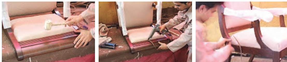
شکل ۴۱- مراحل نوارکشی (سرمه)

نوار نوع دوم که از مقداری نخ به هم تابیده تشکیل شده به عرض ۱ سانتی‌متر در بازار موجود می‌باشد را به وسیله چسب حرارتی و با هویه مخصوص روی دور تا دور کف مبلی بچسبانید. این کار به منظور دوام بیشتر مبلی، پوشاندن جای منگنه‌ها و زیبایی ظاهری صورت می‌گیرد. با این مرحله کار، ساخت کفی به پایان رسیده و بایستی رویه‌کوبی پشتی مبلی را انجام دهید (شکل ۴۱).