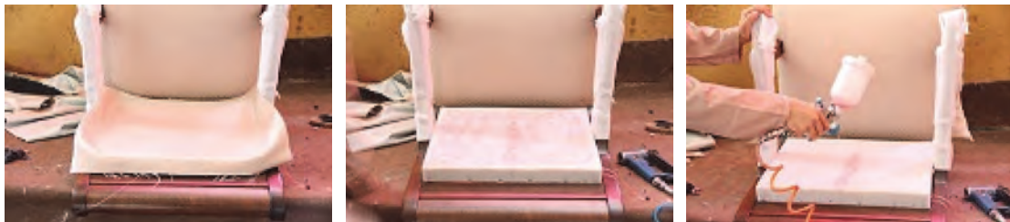
شکل ۳۸- مراحل رویه کوبی پشتی مبلی

- پارچه نهایی را باید به اندازه ۵ تا ۱۰ سانتی‌متر بیشتر از پشتی مبلی برش دهید. دور تا دور پشتی مبلی باید حالت پفکی داشته باشد، بنابراین باید دور تا دور پشتی را قبل از زدن پارچه نهایی، با پنبه‌دانه یا اسموز به مقدار لازم (یا اسفنج یک تکه) پر کنید. همچنین اگر فرورفتگی در برخی از قسمت‌های دیگر نیز وجود داشته باشد به وسیله پنبه‌دانه یا ضایعات تودوزی که در شکل قبلی مشخص شد، پر می‌شود. بعد از انجام این مراحل لبه پارچه رویه در قسمت دور کلاف کوبیده می‌شود. عمل کوبیدن پارچه نیز به وسیله منگنه بادی صورت می‌گیرد. بعد از اطمینان از مناسب بودن سطح پشتی مبلی (عدم فرو رفتگی یا برآمدگی) باید قسمت پشت مبلی را به وسیله پارچه بپوشانید؛ که این کار نیز مثل نصب پارچه روی مبلی، با منگنه بادی صورت می‌گیرد (شکل ۳۸).