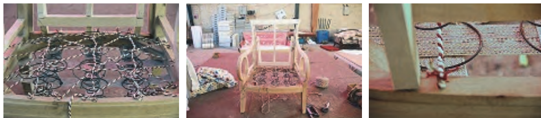
شکل ۳۲- بستن فنر با نخ فنربندی

سپس نخ را از فنر بعدی عبور داده و همین عمل را تکرار می‌کنند، سر دیگر نخ باید به قید رویی نصب شود. در واقع نخ‌ها به صورت تار و پود از روی فنرها عبور می‌کنند. این عمل برای ثابت نگه داشتن قسمت بالای فنر و استحکام بیشتر مبل صورت می‌گیرد. باید دقت شود که فنرها را نباید خیلی با نخ مغزی زیاد محکم کرد زیرا باعث فشرده شدن فنر و از بین رفتن خاصیت ارتجاعی آن خواهد شد. از هر فنر یک نخ به صورت تار و یک نخ به صورت پود عبور داده می‌شود. در واقع وقتی ۴ فنر لول داریم، دو نخ به صورت تار و دو نخ به صورت پود از روی فنرها عبور می‌کند؛ بنابراین به هر ردیف فنر یک نخ تار و یک نخ پود وصل می‌شود (شکل ۳۲).