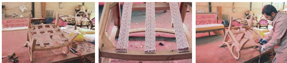
شکل ۳۰- مراحل تسمه کشی

۲- فنر بندی: همان طور که گفته شد، در محل تلاقی نوارها باید فنر لول را که استوانه‌ای شکل است، قرار داده و روی تقاطع تسمه با نخ مغزی (نخ و سوزن کفاشی) محکم نمود.