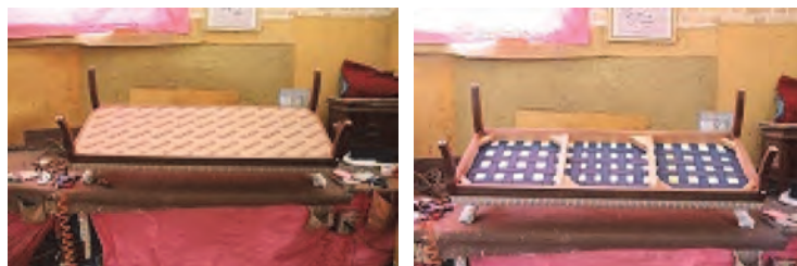
شکل ۳۹- پوشش کف مبلی با متقال

قسمت زیر مبلی باید به وسیله پارچه‌های متقال پوشش داده شود. این عمل به منظور پوشاندن سطح زیر نوار و فترها؛ و جلوگیری از ریختن گرد پنبه‌دانه و پرز انجام می‌گیرد، این پارچه را نیز با منگنه بادی به کلاف کوبید (شکل ۳۹).