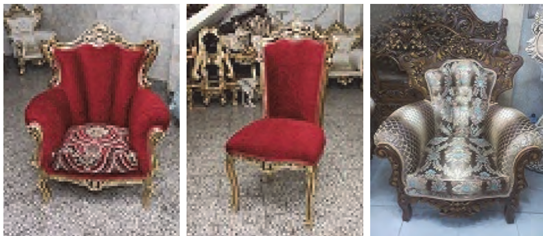
شکل ۴۲- پایان رویه‌کوبی مبلی یک نفره

قسمت‌های چوبی مبلی را به وسیله پارافین مایع پاک کنید. این عمل با استفاده از پنبه آغشته به پارافین و برای از بین بردن لکه‌های ایجاد شده در جریان رویه‌کوبی صورت می‌گیرد که باعث براقیت سطح چوبی مبلی خواهد شد (شکل ۴۲).