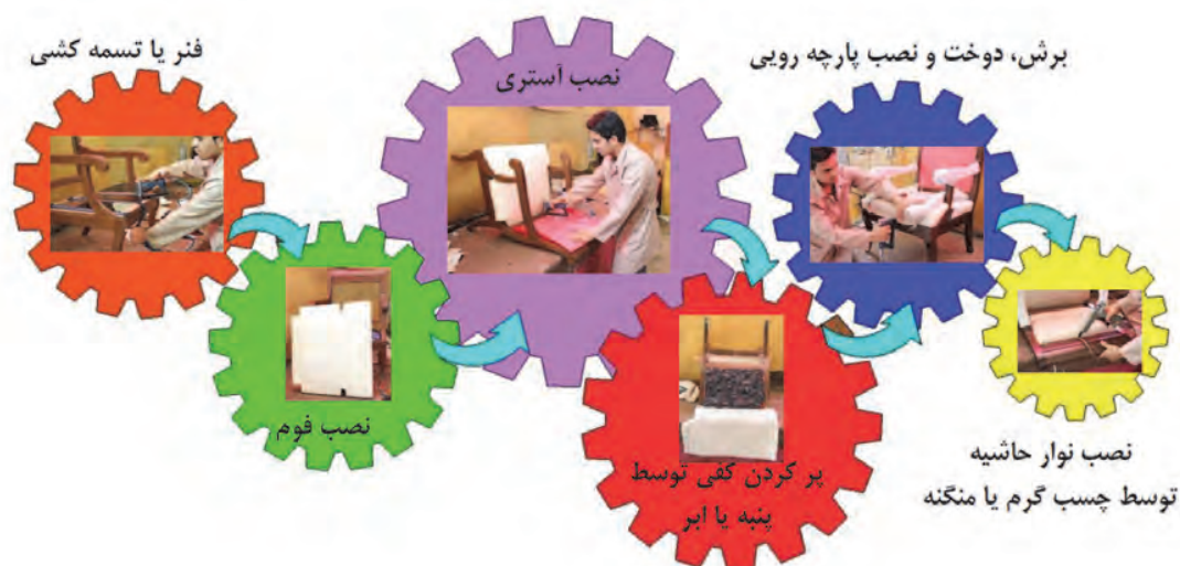
شکل ۲- مراحل اجرای رویه کوبی