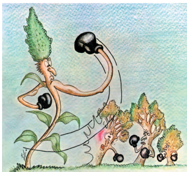
شکل ۴-۴- غلبه علف هرز بر بعضی از گیاهان

۴- افزایش علفهای هرز: در اثر کشت تک محصولی، علفهای هرز گیاهان میزبان به نحو مؤثری افزایش می یابد. در حالی که با تغییر گیاه میزبان شرایط مناسب رشد علفهای هرز نیز از بین خواهد رفت مثلاً رشد و توسعه یولاف در کشت ممتد گندم (مثال دیگری را شما ارائه نمایید) (شکل ۴-۴).