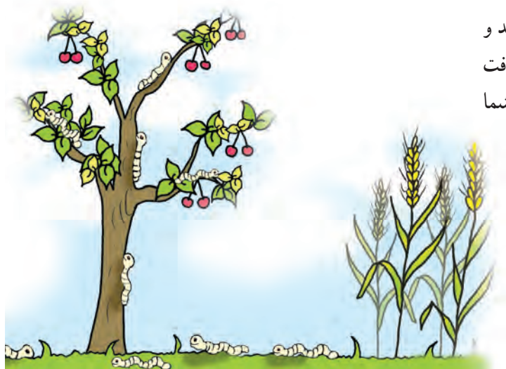
شکل ۳-۴- افزایش آفات و بیماریها

۳- افزایش آفات و بیماریها: کشت ممتد یک گیاه باعث تجمع آفات و بیماریهای بخصوصی با توجه به شرایط مساعد و وجود میزان مناسب در طول سالهای پیایی خواهد شد مثل آفت کرم ساقه خوار برنج یا بوته میری جالیز (حداقل دو مثال نیز شما ارائه نمایید) (شکل ۳-۴).