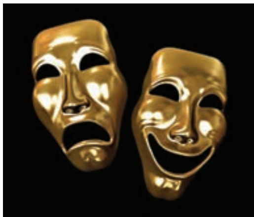
شکل ۲- نمایش بی‌کلام

ارتباط بین انسان‌ها همیشه در گفتار و حرف زدن خلاصه نمی‌شود. ارتباط هم می‌تواند با کلام و زبان گفتار باشد و هم با نشانه‌های غیرکلامی و به اصطلاح زبان بدن. بنابراین به صورت یک اشاره یا تغییر حالت چهره و بدن، می‌توان پیامی را انتقال داد. ارتباط غیرکلامی به وسیله زبان بدن دامنه وسیعی دارد. بیان چهره‌ای، اشاره، ادای احترام با حرکت ساده سر، تئاتر، موسیقی و نمایش بی‌کلام ۱ از جمله ارتباطات غیرکلامی است. (شکل ۲).