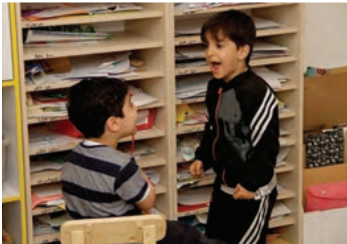
شکل ۳- اعتراض کودک

یکی از اهداف مهم در پرورش کودک، کمک به رشد مهارت درک احساسات دیگران است، به شکلی که او بتواند به دیگران احترام بگذارد و در تعامل با دیگران، همدلی کند. اما تأکید زیاد بر این موضوع که کودک به خواسته و احساسات دیگران توجه کند یا شیوه نادرست تأکید، ممکن است تأثیر معکوسی داشته باشد. هنگامی که کودک حس کند خواسته‌ها و احساسات دیگران مهم است، ولی خواسته‌ها و احساسات خودش اهمیتی ندارد و به آن توجه نمی‌شود، ممکن است احساس بدبینی و گاه تنفر یا حسادت شکل بگیرد. تصور کنید مربی تعداد محدودی وسیله بازی در اختیار کودکان ۳ تا ۵ ساله قرار داده است. کودکی مدت طولانی با یکی از وسیله‌ها مشغول بازی است و آن را در اختیار کودک دیگری که کنارش نشسته است، قرار نمی‌دهد. به طور معمول در این شرایط، مربی به کودک می‌گوید: «کمی هم اجازه بده دوستت مشغول بازی باشد». ممکن است بین دو کودک در حین بازی درگیری هم به وجود آمده باشد. در چنین موقعیت‌هایی، مربی می‌تواند به صورت غیرمستقیم و با طرح سؤال‌هایی از قبیل «چه اتفاقی باعث شد که با دوستت دعوا کنی؟»، «خیلی دوست داری الان بازی کنی؟» و «وقتی بازی می‌کنی، چه حسی داری؟»، به توصیف احساسات دیگران و هم‌بازی کودک بپردازد. در این صورت، کودک احساس می‌کند نیازهایش دیده شده است و با آرامش بیشتری می‌تواند به احساسات دیگران نیز توجه کند. پس، موقعیت‌ها می‌توانند به یک فرصت آموزشی تبدیل شوند، فرصتی که مربی با نشان دادن توجه به خواسته‌ها و احساسات کودک، احساس امنیت او را تقویت کند تا کودک هم چگونگی درک احساسات دیگران را یاد بگیرد.