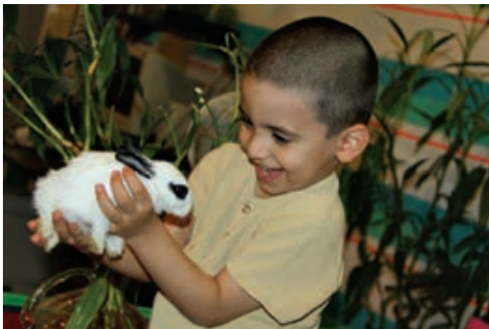
شکل ۷ - مهربانی

در ادامه، به نمونه فعالیت‌هایی که لازم است همراه با کودک انجام شود، اشاره شده است. هر فعالیت بیانگر بخشی از ویژگی و ماهیت همدلی است و به درک بهتر این مفهوم نیز کمک می‌کند. مهربانی‌های بی‌مانند: موضوع مهربانی، مثلاً غذا دادن به حیوانات اهلی مانند گربه‌ها و پرنده‌ها را با کودک در میان بگذارید و تجربه‌های او را بشنوید. تجربه‌های احتمالی خود در این باره را نیز (مثلاً دادن صندلی خود به یک فرد ناتوان در اتوبوس) در میان بگذارید (شکل ۷).