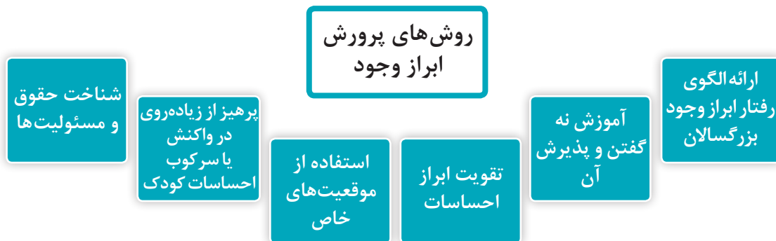
نمودار ۳- روش‌های پرورش ابراز وجود

روش‌های پرورش ابراز وجود در نمودار ۳ نشان داده شده است.