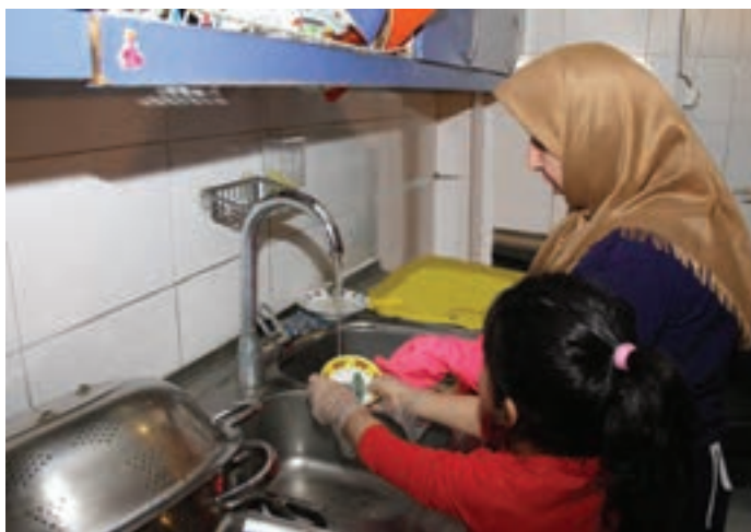
شکل ۵- کمک به دیگران و رفتار نوع‌دوستانه در کودکان