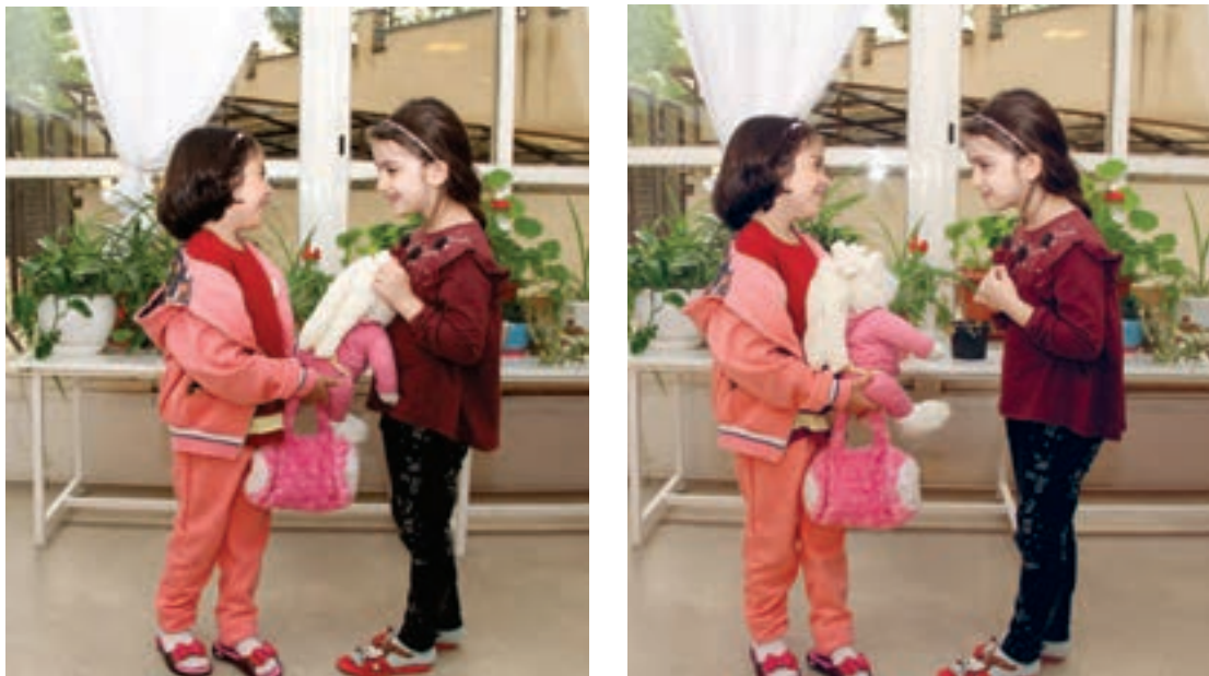
شکل ۸ - بخشش

در اختیار دارد یا رفتارهایی باشد که می‌تواند موجب خوشحالی دیگران شود، مانند لبخند و مهربانی. در صورت موافقت کودک، روزی را به منظور هدیه دادن برنامه‌ریزی کنید تا در آن روز کودک بتواند به اطرافیان خود از جمله اعضای خانواده و دوستانش هدیه دهد. این انتخاب را بر عهده کودک بگذارید تا به میل خود هدایایی را آماده کند. در صورت هماهنگی بیشتر، می‌توانید شرایط را به گونه‌ای فراهم سازید تا کودک نیز بتواند از دیگران هدایایی دریافت کند (شکل ۸).