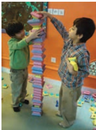
شکل ۱- ارتباط کودکان

فعالیت ۱: در گروه‌های کلاسی، با توجه به تصاویر بالا، در مورد احساسات و ارتباط بین کودکان گفت‌وگو کنید و نتیجه را در کلاس ارائه دهید.