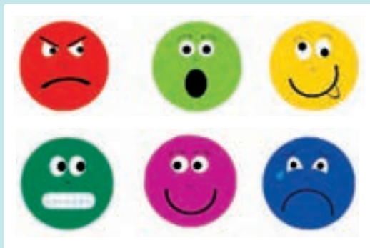
شکل ۴- هیجانات

۱ تلفیق تصویر و داستان: داستان‌گویی از جمله شیوه‌هایی است که امکان درک احساسات گوناگون را برای کودک فراهم می‌آورد. تلفیق این شیوه با تمرکز بر شناخت احساسات، می‌تواند به پرورش و رشد هیجانی و عاطفی کودک کمک کند؛ برای مثال، مربی داستانی را برای کودکان می‌خواند. در بخش‌هایی از داستان متوقف می‌شود و از کودکان می‌خواهد تا احساس و هیجان شخصیت داستان را در آن بخش، با کمک تصاویری که در اختیار دارند (مانند شکل ۴) نشان دهند.