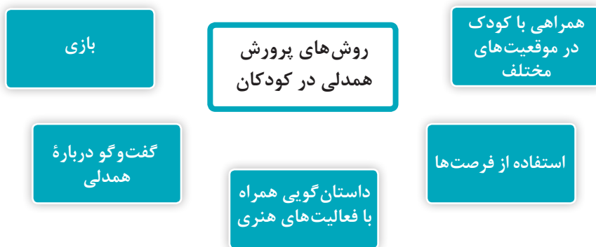
نمودار ۲- روش‌های پرورش همدلی در کودکان

از جمله مهم‌ترین زمینه‌های رشد همدلی در کودکان ارائه رفتارهای همدلانه است. کودکان، پیش از آنکه در معرض آموزش همدلی قرار گیرند، باید شاهد الگوهای عینی همدلی بزرگسالان باشند. الگوبرداری همدلی می‌تواند از طریق نحوه ارتباط مربی با خود کودک و کودکان دیگر تجلی یابد. همدلی از درک احساسات دیگران آغاز می‌شود. بنابراین روش‌هایی که برای پرورش درک احساسات دیگران بیان شد، درباره همدلی هم می‌توانند کاربرد داشته باشند. روش‌های پرورش همدلی در کودکان در نمودار ۲ آمده است: