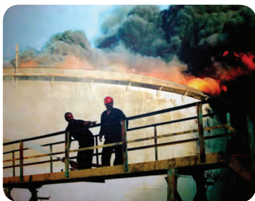
احتراق ناشی از مواد نفتی را در یک مخزن ذخیره سوخت

مایعات قابل اشتعال نظیر: نفت، گازوئیل، بنزین، الکل و روغن دسته دوم مواد قابل اشتعال را تشکیل می‌دهند که دارای درجه سوختن متوسط و تند می‌باشند. شکل (۶-۶) احتراق ناشی از مواد نفتی را در یک مخزن ذخیره سوخت نشان می‌دهد.