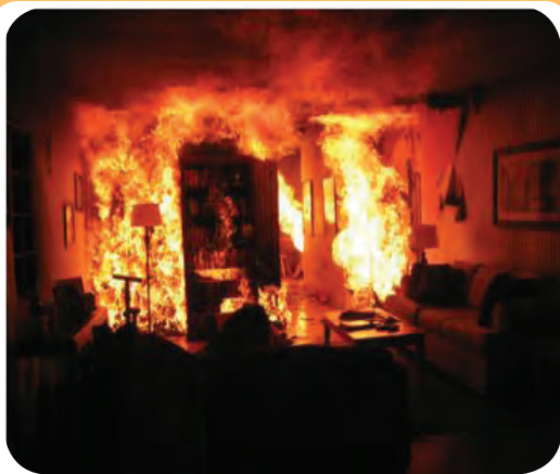
احتراق ناشی از مواد جامد قابل سوختن