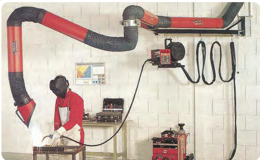
سیستم تهویه قابل انعطاف، دوده‌های متصاعد شده را مکش کرده و مانع از رسیدن آن به صورت جوشکار می‌شود.