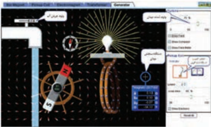
شکل ۱- نرم افزار phet

نرم افزار رایگان Phet نرم افزاری است که در آن آزمایش‌های علوم پایه از جمله مبانی برق به نحوی جالب و بر مبنای آخرین دستاوردهای محققان طراحی و شبیه‌سازی شده است و بر پایه نرم افزارهای فلش و جاوا برنامه‌نویسی و اجرا می‌شود. این نرم افزار به هنرجویان کمک می‌کند تا بتوانند مسائل علمی غیر قابل لمس را در محیطی پویا و با استفاده از گرافیک و کنترل‌های حسی با فشردن دگمه‌های نرم افزاری مشاهده نمایند. در این نرم افزار با تغییر مشخصه‌ها در آزمایش‌های مختلف می‌توان نتایج را از دیدگاه پژوهشی مستقیماً مطالعه کرد. هنرجویان با استفاده از این نرم افزار درک درست و تصویر ذهنی ماندگارتری از موضوع آموزشی مورد نظر را پیدا می‌کنند. نرم افزار Phet تعاملی است و با ارائه بیش از ۱۲۰ شبیه‌سازی، در زمینه‌های مختلف به درک علمی مفاهیم کمک می‌کند. این نرم افزار بخش فارسی نیز دارد. شکل ۱ نماد دسترسی به سایت نرم افزار Phet و تصویر شبیه‌سازی شده مولد را نشان می‌دهد.