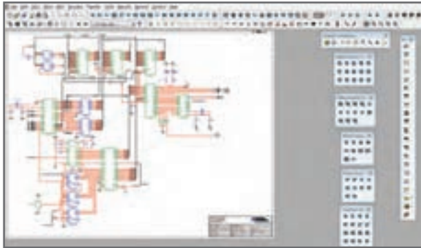
شکل ۶- نرم افزار مولتی سیم

نرم افزار مولتی سیم در حقیقت یک آزمایشگاه مجهز الکترونیک را به صورت مجازی و گرافیکی روی صفحه مانیتور کامپیوتر در اختیار کاربر قرار می دهد. در محیط این نرم افزار تمام قطعات اصلی الکترونیک در نوار ابزارهای مختلف تعریف شده است. برای ترسیم نقشه فنی (شماتیک - Schematic) مدار ابتدا قطعات لازم را به ترتیب انتخاب می کنید و آنها را به میز کار مجازی (Workbench) انتقال می دهید، سپس با تنظیم مشخصه های هر یک از قطعات و برقراری اتصال بین آنها با استفاده از موس، رسم مدار به صورت شماتیک کامل می شود. در مرحله بعد دستگاه های اندازه گیری مناسب را انتخاب و آنها را به نقاط لازم متصل می کنید. در مرحله آخر مدار راه اندازی شده و به تجزیه و تحلیل مدار می پردازید. دستگاه های اندازه گیری به صورت گرافیکی و شبیه سازی برخی از قطعات به صورت سه بعدی (3D) و دستگاه های پیشرفته واقعی مانند مولتی متر دیجیتال، فانکشن ژنراتور و اسیلوسکوپ نیز در این نرم افزار وجود دارد که سبب جذاب تر شدن آن می شود. در (شکل ۶) محیط این نرم افزار را مشاهده می کنید. نرم افزار مولتی سیم تا حدودی توانایی تحلیل فیزیکی و ریاضی مدارهای الکترونیک و ترسیم مدارهای چاپی را نیز دارد.