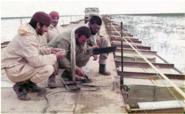
ساخت پل شناور خیبر بر روی هور العظیم یکی از شاهکارهای مهندسی رزمی جهادگران در دوران دفاع مقدس بود.

نقش مردم قهرمان ایران در طول هشت سال دفاع مقدس در دو زمینه قابل بررسی است: