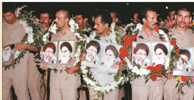
ورود گروهی از آزادگان (اسرا) به میهن عزیز

پس از برقراری آتش بس و دو سال مذاکره میان وزرای خارجه ایران و عراق، صدام در نامه‌ای به حجت‌الاسلام والمسلمین اکبر هاشمی رفسنجانی، رئیس جمهوری وقت ایران، قرارداد الجزایر را بار دیگر به رسمیت شناخت و اظهار داشت که شما به هر آنچه که می‌خواستید، رسیدید. پس از آن، آزادگان عزیز با استقبال گرم مردم ایران به آغوش میهن اسلامی بازگشتند. در سال ۱۳۷۰ نیز سازمان ملل متحد رسماً رژیم بعثی عراق را به‌عنوان متجاوز و آغازکنندهٔ جنگ معرفی کرد. به این ترتیب، جنگ هشت‌ساله‌ای که صدام با حمایت آمریکا با هدف سرنگونی جمهوری اسلامی و تصرف بخشی از خاک ایران آغاز کرده بود، با شکست خود او به پایان رسید و برای اولین بار در دو‌یست سال اخیر، دشمنان در جداسازی حتی یک وجب از خاک ایران ناکام ماندند.