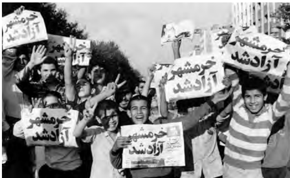
شادی دانش‌آموزان پس از آزادی خرمشهر