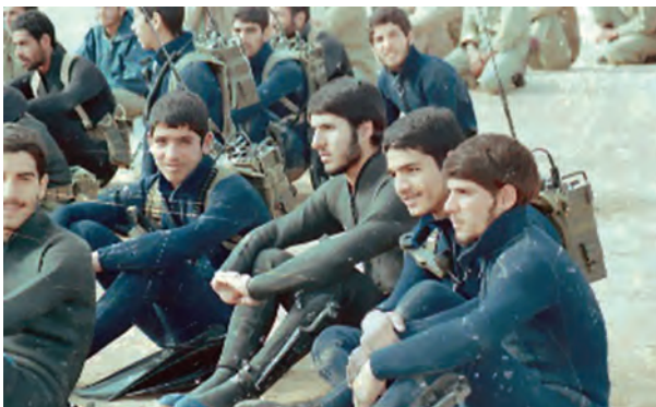
نوجوانان غواص ساعتی قبل از عملیات

معلمان و دانش‌آموزان نیز نقش چشمگیر و تأثیرگذاری در هشت سال دفاع مقدس داشتند. در آن سال‌ها جبهه‌های جنگ شاهد حضور صدها هزار دانش‌آموز و معلم ایرانی بود که برای دفاع از کیان نظام اسلامی و سرزمین مادری به جبهه رفتند و در سنگرها نیز از درس و مشق غافل نماندند. در طول دفاع مقدس حدود ۲۵۰۰ معلم و نزدیک به ۳۶۰۰۰ دانش‌آموز به شهادت رسیدند و هزاران نفر هم جانباز، اسیر و جاویدالاثرا شدند.