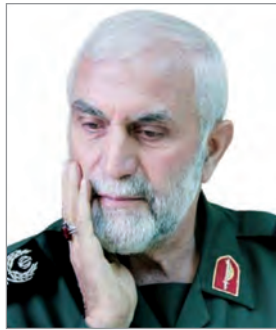
سردار شهید حسین همدانی (شهادت: ۱۳۹۶ - حلب سوریه)