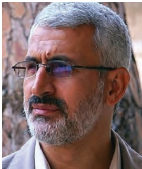
سردار شهید حسن شاطری (شهادت: ۱۳۹۱ - لبنان)

امام خمینی علیه السلام از ابتدای جنگ تحمیلی به صراحت اعلام کردند: «ما بر اساس اعتقاد و باور دینی خود اجازه نداریم به کشور دیگری تعدی کنیم و میل داریم در همه جای دنیا صلح و صفا باشد اما اگر کشوری به ما تعدی کرد، توی دهش می‌زنیم». ۱ بر اساس همین منطق نیز با شروع تجاوز نظامی رژیم بعثی عراق از همه قشرهای ملت خواستند که برای دفاع از ایران به سوی جبهه‌های نبرد بشتابند. همچنین به مسئولان توصیه کردند که جنگ را مسئله اصلی کشور بدانند و برای پیشبرد آن تا پیروزی نهایی بر دشمن، به رزمندگان و مردم یاری برسانند. اهتمام فراوان حضرت امام خمینی علیه السلام بر تقویت بنیه دفاعی و حمایت‌های ایشان برای بالا بردن کیفیت و کمیت امکانات و تجهیزات نظامی و تأمین بودجه‌های جنگ نیز از جمله تدابیر رهبری ایشان در طول دفاع مقدس بود که تا روزهای پایانی جنگ ادامه داشت، اما مهم‌ترین اقدام ایشان ایجاد تحول در روح و روان جوانان ایرانی بود. امام خمینی علیه السلام با تمسک به مفاهیم جهاد و شهادت و یادآوری حماسه عاشورا، میدان نبرد را به صحنه نمایش رشادت و شجاعت جوانان ایرانی تبدیل کردند. آنان در سایه ایمان و اعتقاد و خلایق خاص خویش همه محاسبات نظامی رایج در دنیا را بر هم زدند و با طراحی و انجام دادن عملیات‌های خارق العاده زمینی، هوایی و دریایی، افسران نظامی جهان را به شگفتی واداشتند. در نتیجه رهبری امام خمینی علیه السلام جلوه‌های زیبایی از ایثار و فداکاری در راه دین و میهن و همچنین تقویت انگیزه جهاد و روحیه شهادت‌طلبی در میان جوانان ایرانی به نمایش گذاشته شد. برخی از فرماندهان جوان دوران دفاع مقدس، امروز به نماد رشادت و مقاومت مردم سوریه و عراق علیه گروه‌های تکفیری و داعشی تبدیل شده‌اند.