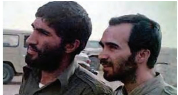
سردار شهید حسین خرازی، فرمانده لشکر ۱۴ امام حسین علیه السلام (شهادت: ۸ اسفند ۱۳۶۵ - شلمچه) و سردار شهید احمد کاظمی، فرمانده لشکر ۸ نجف اشرف (شهادت: دی ۱۳۸۴ - سانحه هوایی)