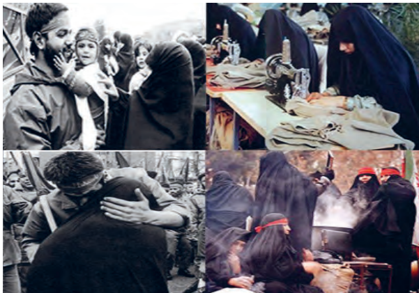
مشارکت مؤثر در دفاع مقدس

۵ پاسداری از حریم خانواده در غیاب همسران رزمنده.