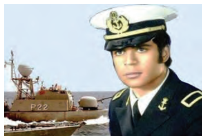
شهید محمدابراهیم همتی فرماندهٔ ناوچهٔ پیکان که در عملیات مروارید به شهادت رسید.

از ۱۲۰ عملیات هوایی موفقیت‌آمیز علیه دشمن یعنی انجام داده بود. هواپیمای دوران در جریان این عملیات و پس از بمباران پالایشگاه بغداد، هدف اصابت موشک پدافند هوایی نیروهای بعثی قرار گرفت. این خلبان رشید با وجود اینکه می‌توانست با استفاده از چتر نجات سالم فرود آید، هواپیمای در حال سقوط را صاعقه‌وار به مکانی نزدیک محل برگزاری نشست سران عدم تعهد کوبید و رؤیای صدام را برای تشکیل آن نشست در بغداد و ریاست بر آن به باد داد.