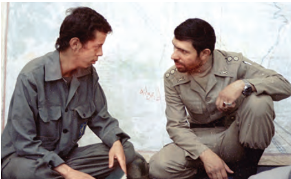
شهیدان سبهد علی صبادشیرازی و سردار حسن باقری