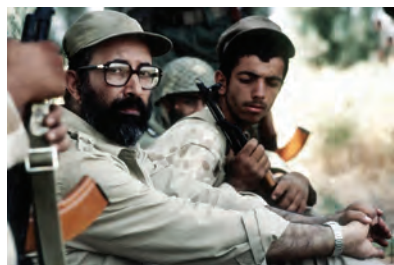
شهید مصطفی جمران

نیروی هوایی ارتش جمهوری اسلامی از نخستین ساعات‌های شروع جنگ وارد عمل شد و با رشادت و شجاعت تمام، ضربهٔ مهلکی به رژیم صدام وارد آورد. ۱ در جبههٔ زمینی نیز رزمندگان ارتش، سپاه پاسداران و ژاندارمری به همراه مردم شهرها و روستاهای