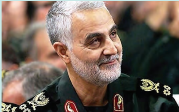
شهید سپهبد حاج قاسم سلیمانی (شهادت: ۱۳۹۸، ترور به دست نیروهای آمریکایی پس از حضور در عراق به دعوت رسمی این کشور)

رهبر انقلاب این روز را یک «یوم‌الله» دیگر در تاریخ انقلاب اسلامی دانستند و در این باره فرمودند: «هر جا اخلاص بود، خدای متعال به اخلاص بندگان مخلصش برکت می‌دهد، کار برکت پیدا می‌کند، رشد و نمو پیدا می‌کند، کار به نحوی می‌شود که اثر آن به همه می‌رسد، برکات آن در میان مردم باقی می‌ماند؛ این ناشی از اخلاص است. نتیجه آن اخلاص، همین عشق و وفاداری مردم، همین اشک و آه مردم، همین حضور مردم، همین تازه شدن روحیه انقلابی مردم