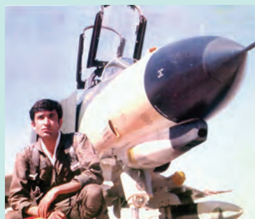
خلبان شهید عباس دوران

مرزی، عشایر غیور و نیروهای ستاد جنگ‌های نامنظم، که شهید مصطفی جمران آنها را فرماندهی می‌کرد، به مقابله با دشمن شتافتند و پیشروی نیروهای عراقی را متوقف و یا کند کردند. در خرمشهر، مدافعان این شهر اغلب با ساده‌ترین سلاح‌ها بیش از یک ماه کوچه به کوچه و خیابان به خیابان در برابر ارتشی که مجهز به انواع تسلیحات و تجهیزات بود، ایستادند.