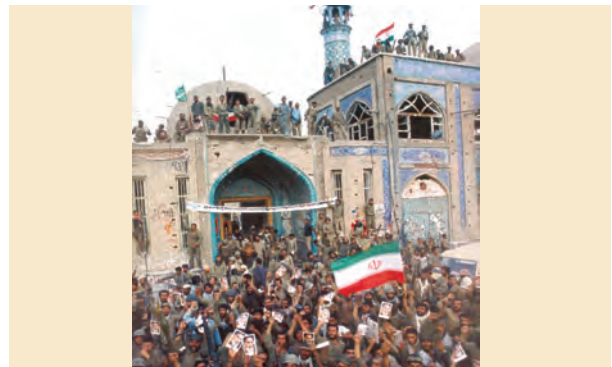
خرمشهر پس از آزادی - سوم خرداد ۱۳۶۱

پس از آزادسازی خرمشهر، جنگ وارد مرحله تازه‌ای شد؛ از یک سو موفقیت‌های نظامی رزمندگان ایرانی ادامه یافت و از سوی دیگر، حامیان خارجی صدام برای جلوگیری از سقوط رژیم بعثی عراق، انواع تجهیزات نظامی پیشرفته از قبیل: هواپیماهای جنگی، موشک‌های دوربرد و سلاح‌های میکروبی و شیمیایی را در اختیار این رژیم گذاشتند. به دنبال بازپس‌گیری خرمشهر، جمهوری اسلامی ایران برای پایان دادن به جنگ و خون‌ریزی و رسیدن به حقوق خود، شروطی ۳ را مطرح کرد که مورد بی‌اعتنایی مجامع بین‌المللی و دیکتاتور عراق واقع شد. صدام پس از آن با حمایت بیشتر قدرت‌های بزرگ به بمباران و موشک باران شهرها و استفاده از بمب‌های شیمیایی روی آورد که در قوانین و عرف بین‌الملل ممنوع بود. بمباران شیمیایی شهر سردشت در استان آذربایجان غربی، روستای زرده از توابع شهرستان دالاهو در استان کرمانشاه و شهر حلبچه در کردستان عراق، از جمله جنایت‌های جنگی حکومت بعثی عراق به‌شمار می‌رود.