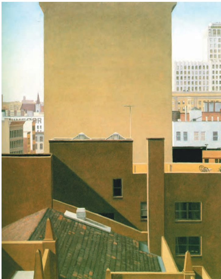
تصویر ۱-۲ اثر جان مور، رنگ روغن روی بوم، (۶۱×۷۲/۲ سانتی‌متر)