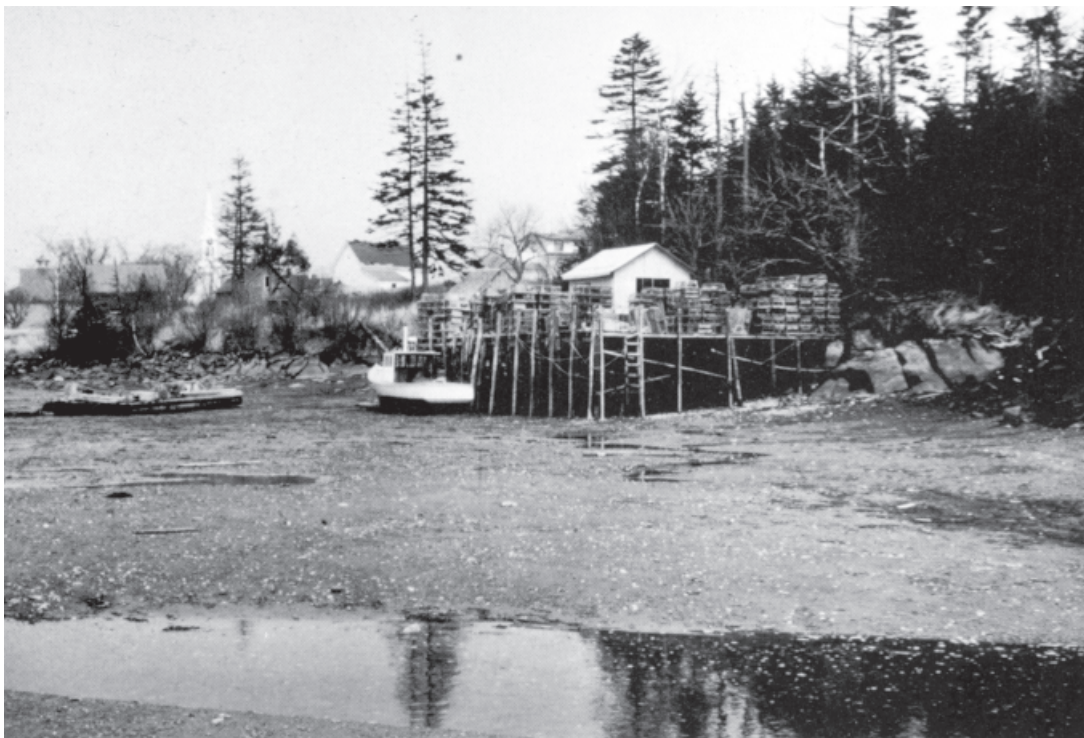
تصویر ۲-۹- عکس از منظره، اثر کادِل

تصاویر (۲-۹، ۲-۱۰، و ۲-۱۱) نمونه دیگری از تهیه پیش طرح از منظره، نشان می دهند. ابزار شما در این مرحله می تواند، زغال، مداد و یا آب مرکب باشد.