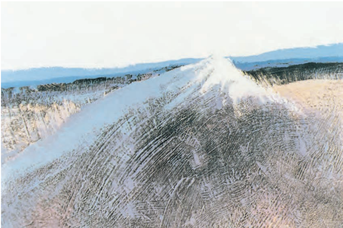
تصویر ۲-۶- اثر حسین کاظمی، رنگ روغن روی بوم، (۱۰۰ × ۱۵۰ سانتی متر)