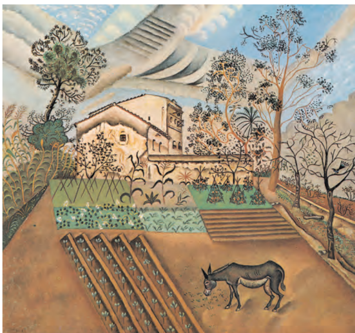
تصویر ۲-۲ اثر خوان میرو، رنگ روغن روی بوم، (۶۰×۷۰ سانتی‌متر)