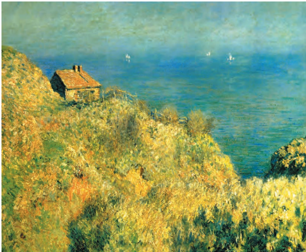
تصویر ۴-۲- اثر کلود مونه، رنگ روغن روی بوم، (۵۹×۷۶ سانتی متر)