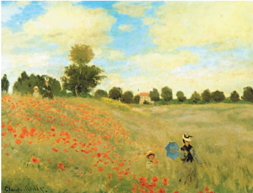
تصویر ۳-۲- اثر کلود مونه، رنگ روغن روی بوم، (۴۹/۵×۶۴ سانتی متر)