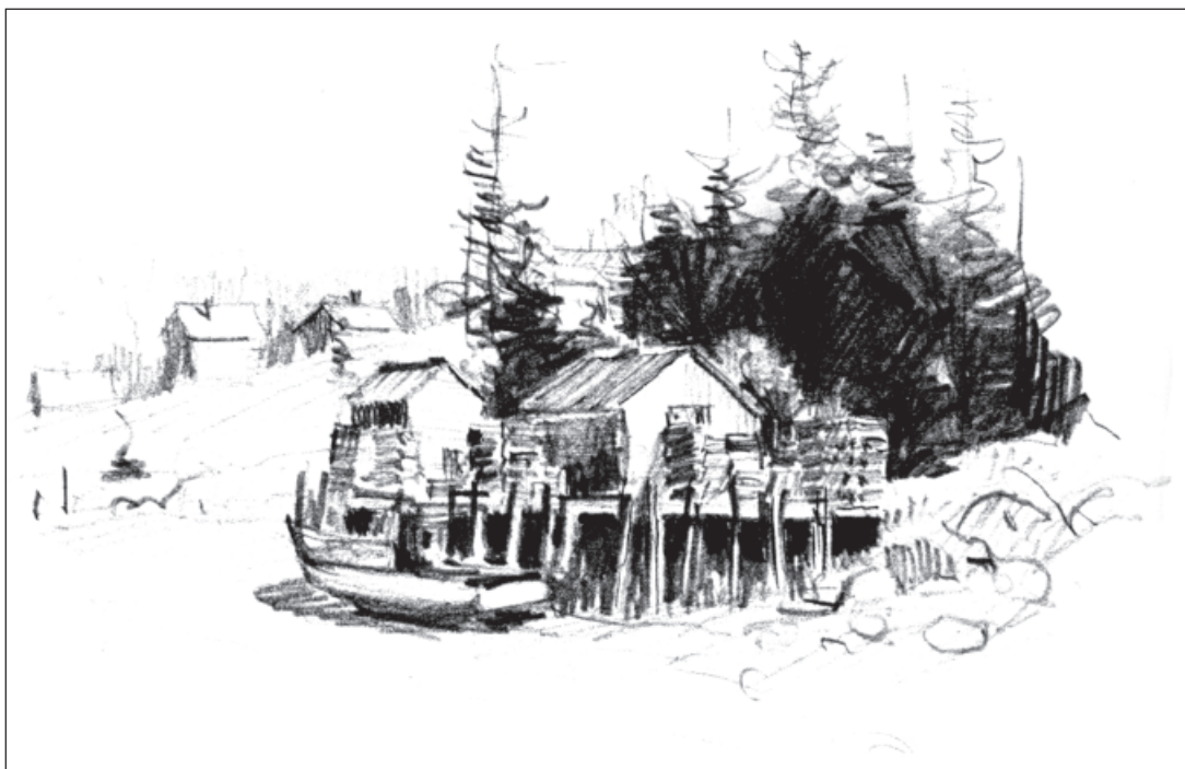
تصویر ۲-۱۰- پیش طرح از منظره با مداد، اثر کادِل