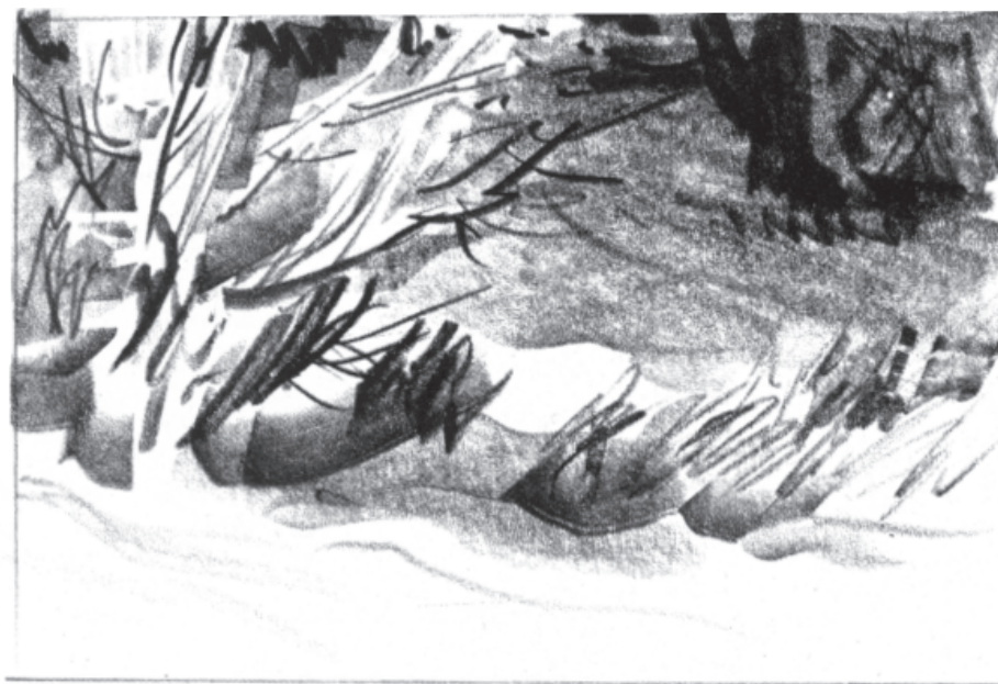
تصویر ۲-۸- پیش طرح از منظره، اثر زاہد