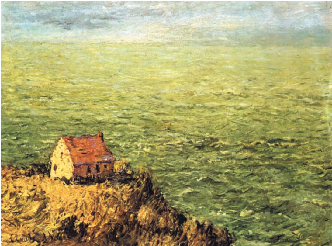
تصویر ۲-۵- اثر کلود مَنه، رنگ روغن روی بوم، (۵۹ × ۹۰ سانتی متر)