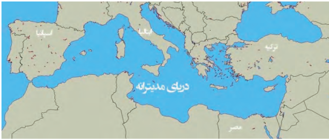
شکل ۱۰- دریای مدیترانه

در گروه‌های سه نفره پرده‌نگاری درباره دریاهای جهان تهیه کرده و در کلاس ارائه دهید.