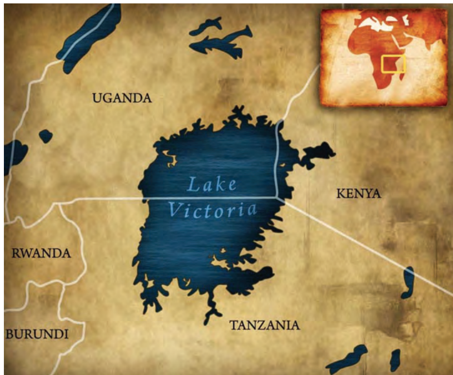
شکل ۱۱- موقعیت دریاچه ویکتوریا، بزرگترین دریاچه آفریقا و دومین دریاچه آب شیرین جهان