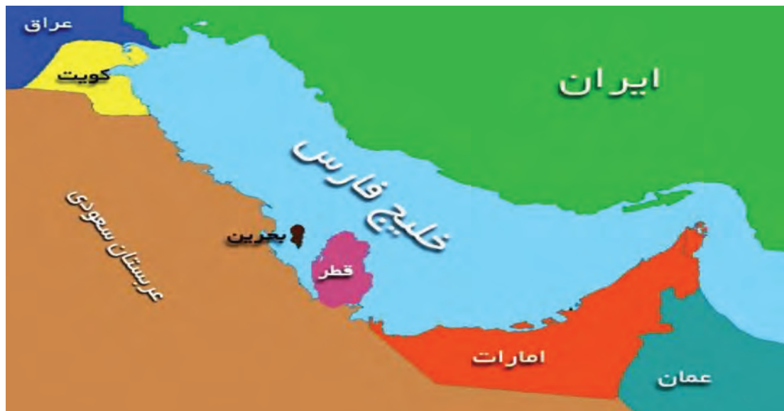
شکل ۱۴- خلیج فارس و موقعیت کشورهای همسایه آن

«خلیج همیشه فارس» توسط «تنگه هرمز» به «دریای عمان» و از طریق آن به دریاهای آزاد مرتبط است. جزیره قشم، بزرگ‌ترین جزیره خلیج فارس است و مهم‌ترین جزیره در خلیج فارس نیز جزیره نفتی خارک است که در قسمت شمالی آن واقع شده و مرکز اصلی صادرات نفت به شمار می‌رود. همان‌گونه که در تصویر می‌بینید علاوه بر کشور عزیزمان کشورهای عمان، امارات متحده عربی، قطر، بحرین، عربستان، کویت و تاحدودی عراق در مجاورت این دریای تاریخی قرار داشته است.