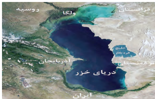
شکل ۱۷- دریای خزر

دریای خزر: دریای خزر بزرگ‌ترین دریاچه دنیاست. این دریاچه به تنهایی نزدیک به ۴۰ درصد مجموع مساحت دریاچه‌های دنیا را شامل می‌شود و از دریاچه سوپریور دومین دریاچه دنیا که بین آمریکا و کانادا است، پنج برابر بزرگ‌تر است. دریای خزر حتی از مجموع خلیج فارس و دریای عمان وسعت بیشتری دارد.