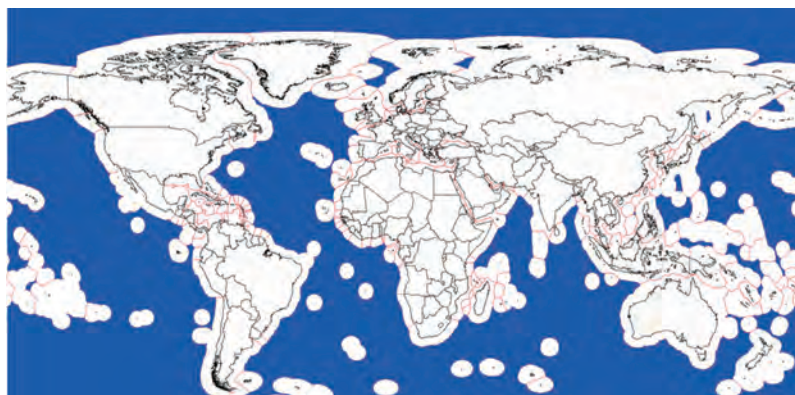
شکل ۱۳ - آب‌های بین‌المللی

آب‌های بین‌المللی به هر جایی از هر یک از اقیانوس‌ها، دریا‌های منطقه‌ای بسته یا نیمه‌بسته و مصب رودها، رودها، دریاچه‌ها، سامانه‌های آب‌های زیرزمینی و تالاب‌ها گفته می‌شود که فراتر از مرزهای بین‌المللی باشند. بنابراین به جز مناطق محدودی در مجاورت سواحل کشورها، می‌توان همه اقیانوس‌ها و دریا‌های جهان را آب‌های آزاد یا آب‌های بین‌المللی نامید. معنی این امر این است که همه این آب‌ها به تمام آحاد بشر تعلق داشته، حق رفت و آمد و هرگونه بهره برداری برای همگان محفوظ بوده و فقط تابع قوانین بین‌المللی است. در شکل زیر آب‌های بین‌المللی به رنگ آبی نشان داده شده‌اند.