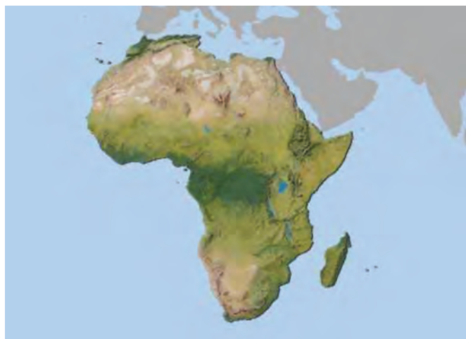
شکل ۳- قاره آفریقا

با دقت در تصاویر و نقشه‌های مربوط به قاره آفریقا، کشورهای مجاورت هیچ اقیانوس و دریایی نیستند را پیدا کنید.