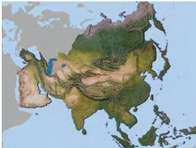
شکل ۱- قاره آسیا

بادقت در تصاویر و نقشه‌های مربوط به قاره آسیا، به هر سؤال زیر حداقل سه مورد را پاسخ دهید: