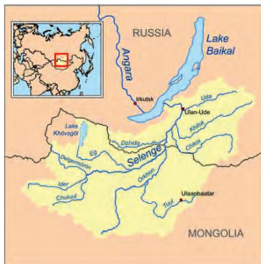
شکل ۱۲- موقعیت دریاچه بایکال در جنوب سیبری در کشور روسیه، عمیق ترین و بزرگترین منبع آب شیرین جهان

پرده نگاری درباره بزرگترین دریاچه‌های جهان و وضعیت دریاچه‌های ایران تهیه کرده و به همراه تصاویر و مشخصات (مانند: عمق دریاچه، مساحت و مکان و...) در کلاس ارائه دهید.