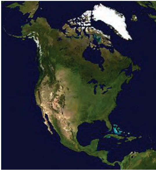
شکل ۴- قاره آمریکای شمالی و مرکزی