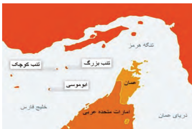
شکل ۱۵- تنگه هرمز