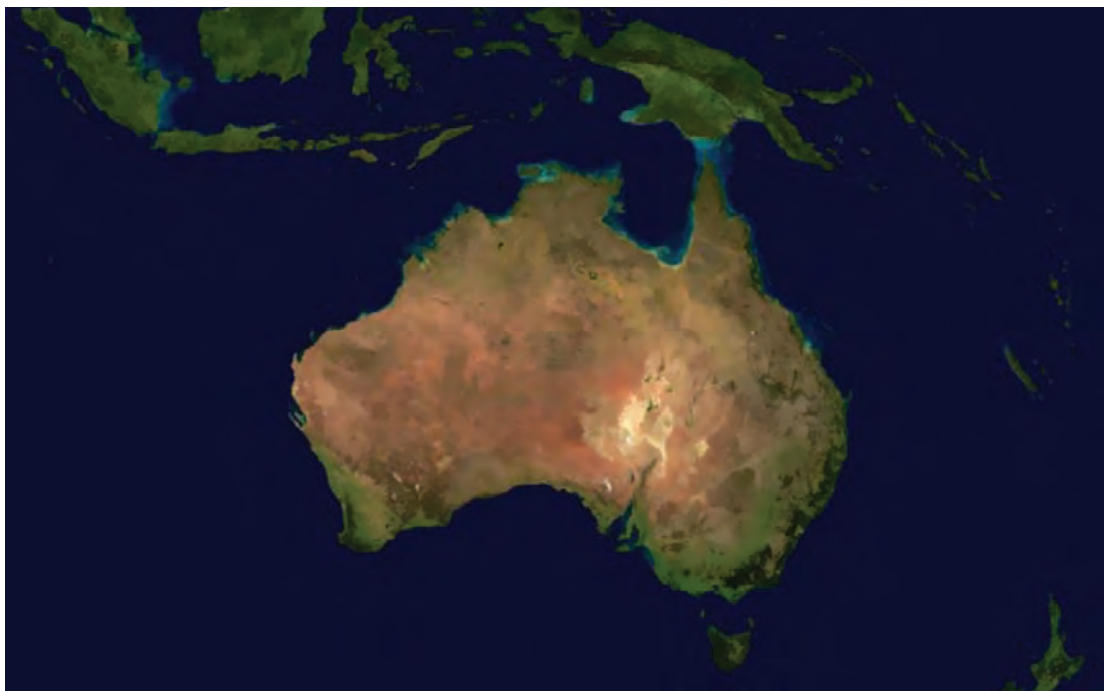
شکل ۶- قاره اقیانوسیه