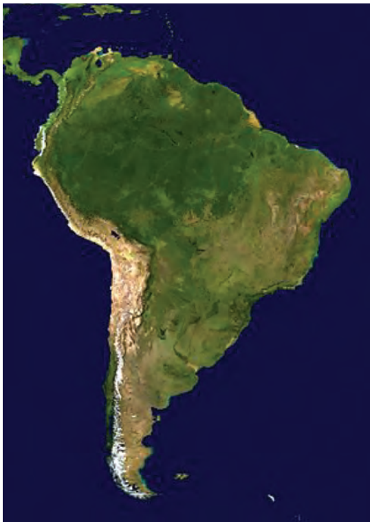
شکل ۵- قاره آمریکای جنوبی

این قاره به صورت یک جزیره بزرگ در میان دو اقیانوس اطلس و آرام قرار گرفته است. در قسمت غربی این قاره یک رشته کوه پیوسته از شمال تا جنوب آن به صورت یک دیوار امتداد دارد. قسمت اعظم این قاره در نیمکره جنوبی واقع شده است. این قاره دربرگیرنده کشورهای پهناوری چون برزیل و آرژانتین و ده کشور کوچک و بزرگ دیگر است. منطقه آمازون در شمال شرقی این قاره، پهناورترین جنگل‌های استوایی و یکی از پرآب‌ترین رودخانه‌های دنیا یعنی رودخانه آمازون را در خود جای می‌دهد. وسعت این قاره در قسمت جنوبی بسیار کم بوده و در پایین‌ترین قسمت تکه تکه شده و به صورت جزایری بزرگ و کوچک درمی‌آید.