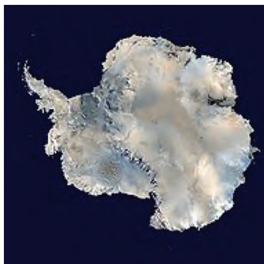
شکل ۷- قاره جنوبگان

با بررسی یکی از قاره‌های جهان، کشورهایی که به دریا راه دارند را مشخص کنید. ویژگی کشتی‌رانی و حمل و نقل دریایی کالا این کشورها و بنادر مهم آن را بررسی کرده و به صورت پرده‌نگار در کلاس ارائه دهید.