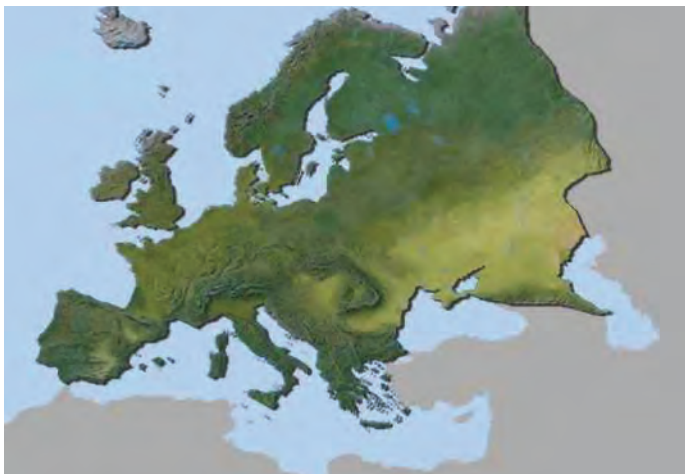
شکل ۲- قاره اروپا

قاره اروپا توسط چه اقیانوس‌هایی احاطه شده است؟ چه کشورهایی در این قاره به اقیانوس‌ها راه دارند؟