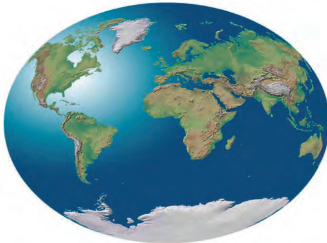
شکل ۸- وضعیت کره زمین

مساحت سطح آب‌های کره زمین در حدود ۳۶۲ میلیون کیلومترمربع است که شامل ۵ اقیانوس می‌باشد.