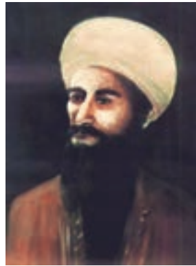
جابر بن حیّان (پدر علم شیمی)