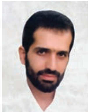
شهید مصطفی احمدی روشن (دانشمند انرژی هسته ای)