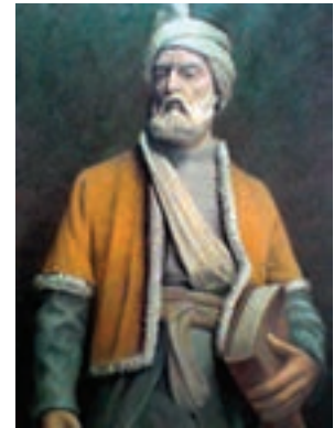
حکیم ابوالقاسم فردوسی (شاعر نامدار)

فعالیت : این پیام قرآنی را در قرآن کریم پیدا کنید و آن را یک بار دیگر بخوانید.