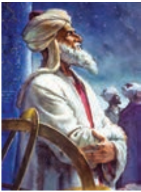
ابوریحان بیرونی (ریاضی دان و منجم)

به کمک تصویر با دوستان خود درباره ی این پیام قرآنی گفت و گو کنید.