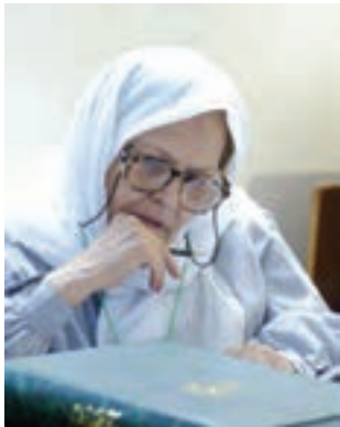
طاهره صفارزاده (مترجم قرآن به زبان فارسی و انگلیسی)