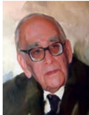
پرفسور سید محمود حسابی (پدر علم فیزیک ایران)