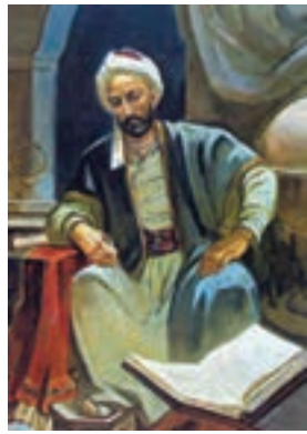
خواجه نصیرالدین طوسی (ریاضی دان، منجم، اندیشمند و سیاستمدار برجسته)