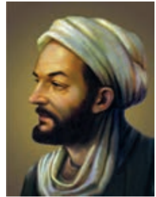
ابوعلی سینا (فیلسوف و پزشک بزرگ مشرق زمین)