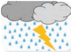
رعد و برق