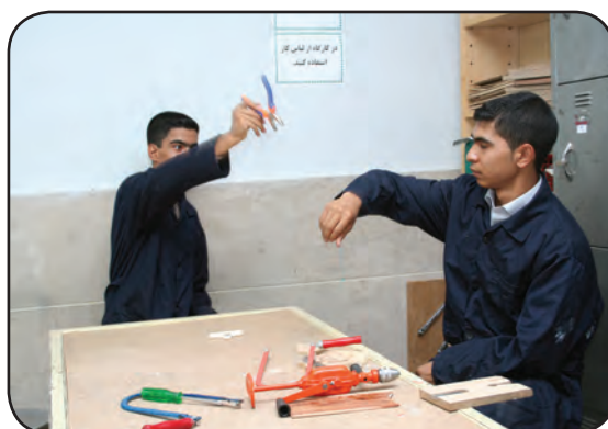
پرتاب کردن ابزار کار