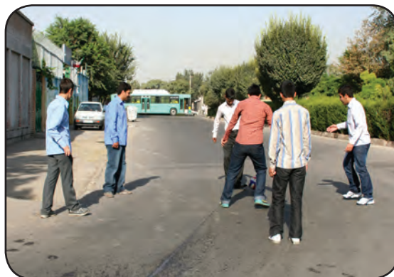
بازی کردن در وسط خیابان