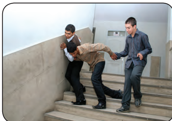
بازی و شوخی کردن روی پله‌ها