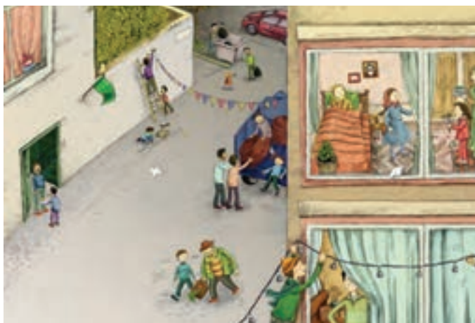
شکل ۱-۵- تصویرسازی برای جشن میلاد حضرت ولی عصر (عجل الله فرجه)

پس از انتخاب اتود نهایی، نوبت به انتخاب شیوه اجرا می‌رسد. در هر موضوع کاری، روش اجرا باید متناسب با محصول نهایی باشد. برای نمونه، استفاده از روش عکاسی در طراحی پوستر و یا محصولات بسته‌بندی شده مناسب به نظر می‌رسد. ممکن است در کار طراحی جلد و یا تصویرسازی، روش‌های بهتر دیگری نیز وجود داشته باشند.