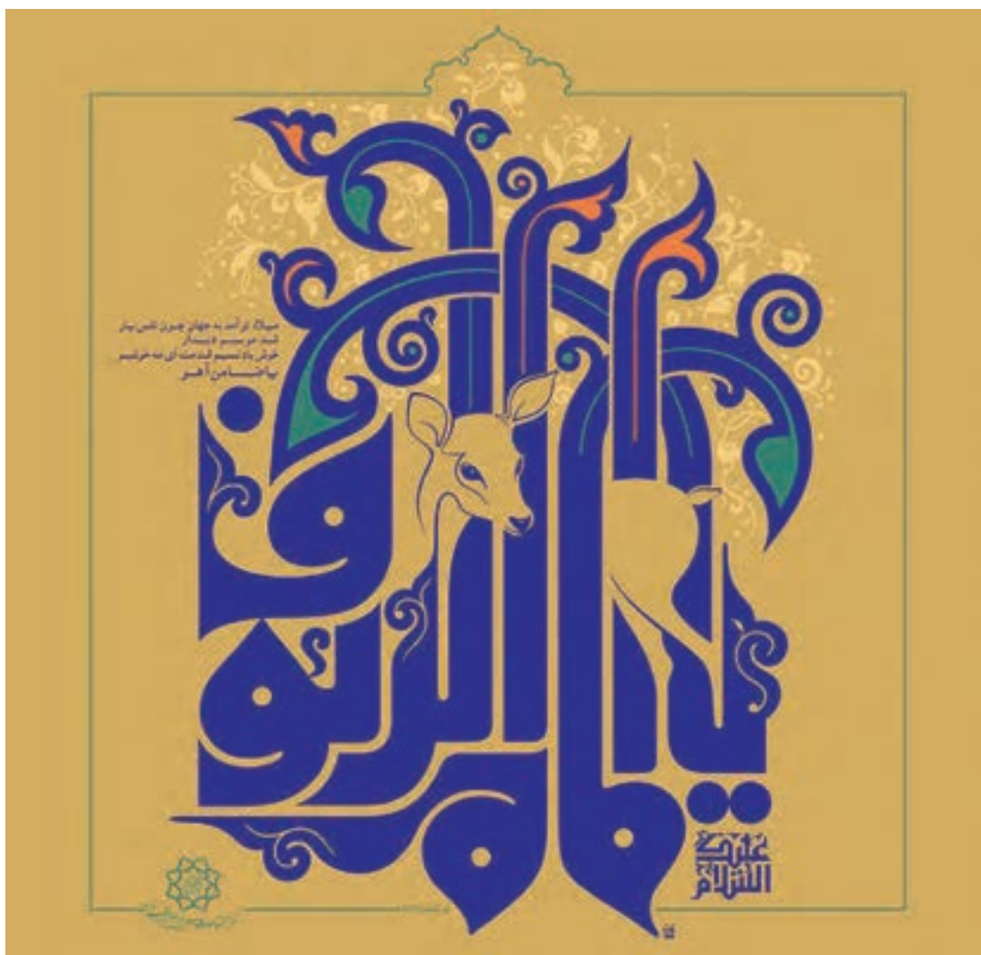
شکل ۱۹-۵- عنوان: «یا امام الرئوف»، اثر: مسعود نجابتی، برای میلاد حضرت امام رضا (علیه السلام) ضامن آهو