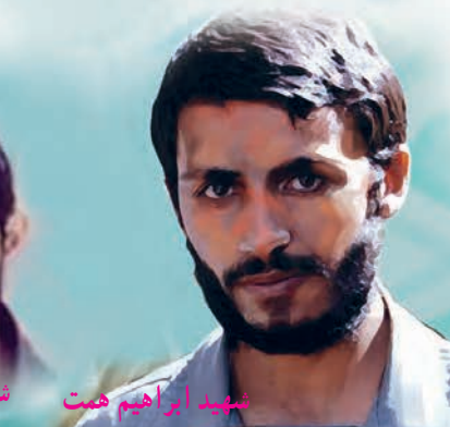
شهید ابراهیم همت