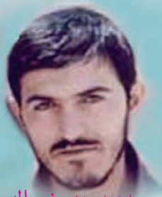
شهید مهدی زین الدین