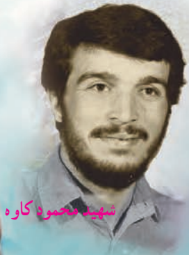
شهید محمود کاوه