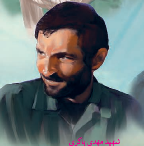
شهید مهدی باکری