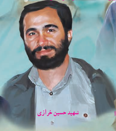
شهید حسین خرازی