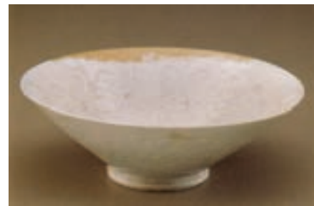
▲ شکل ۱۶-۹ ظرف سفید، طرح چینی

موضوع این نقاشی‌های روی ظروف، مجالس بزم و رزم و گاه موضوعات داستانی برگرفته از ادبیات فارسی است (شکل ۱۷-۹).