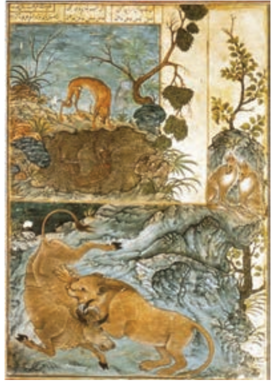
▲ شکل ۱۳-۱۰- برگي از کتاب کلیله و دمنه