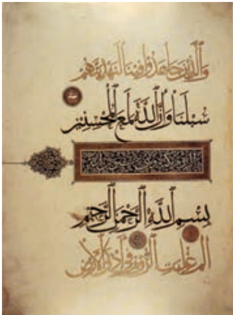
▲ شکل ۱۷-۱۰ - برگي از قرآن مجيد

همچنین هنر کتاب آرایبی و خوشنویسی در زمینه‌های گسترده‌ای رواج یافت و کتابت را به هنری فاخر مبدل ساخت. این تحول با حضور استادان شش‌گانه خوشنویسی - از شاگردان یاقوت مستعصمی - در سه منطقه مهم فارس، خراسان و آذربایجان شکل می‌گیرد. این خوشنویسان هنر خویش را در کاربردهای مختلف تزیین بناها و کتابت نسخه‌های خطی گسترش دادند (شکل ۱۷-۱۰). همچنین ابداع خط نستعلیق توسط میرعلی تیریزی نیز به دوره جلایریان بازمی‌گردد.