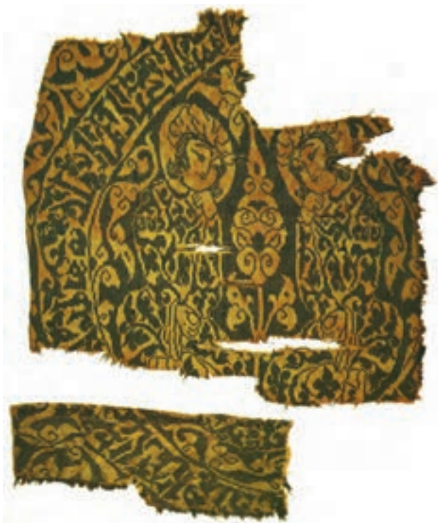
▲ شکل ۹-۱۳- نمونه پارچه آل بویه با طرح ساسانی، ابریشم

صورت‌های متین انسانی، نوعی وحدت موضوعی با بافت پارچه پدید آورده است (شکل ۹-۱۳). جنس اغلب این پارچه‌ها، ابریشمی و میراث‌دار هنر و سنت ساسانی است. از جمله نقش‌های منحصر به فرد، نقش شیر و طاووس در دو طرف درخت زندگی است که در دایره‌ای محاط شده (طاووس نشانه آسمان پرستاره) است. همچنین وجود برگ پهن با نقطه‌های درشت از سبک سفال‌های مینایی اقتباس شده است. وجود حشرات (پروانه) در این نوع نقش و بافت پارچه، نوعی بدعت و ابتکار در نقوش است. طرح دو طاووس و نخل با ساقه نازک که شاخ و برگش مانند چهره انسانی است از ابداعات هنرمندان دوره اسلامی به‌شمار می‌رود (شکل ۹-۱۴). این پارچه‌ها معمولاً در کاربردهای مختلف و با رنگ‌های متنوع که نشان دهنده مهارت بالای رنگرزی الیاف است، تولید می‌شده است.