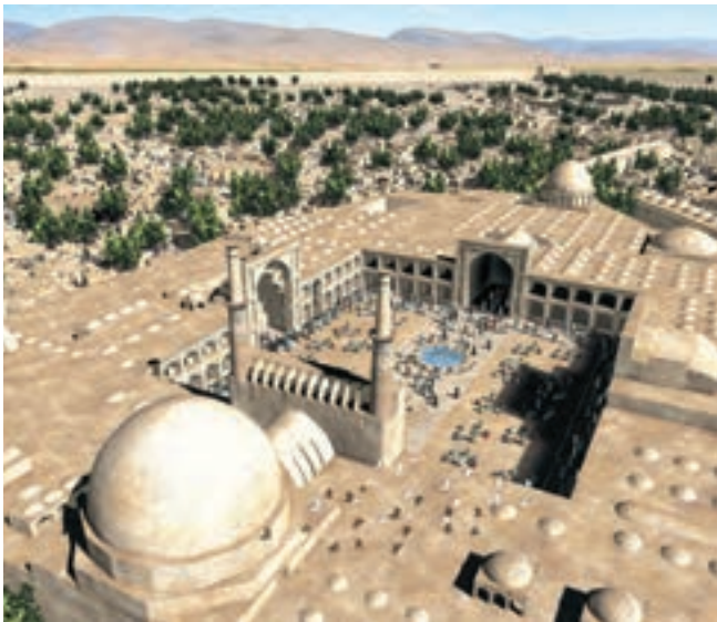
▲ شکل ۹-۲ ب- طرح بازسازی شده، نمای کلی مسجد جامع اصفهان

شبستانی به ایوانی، ساخت بناهای چهار ایوانی، ایوان‌های پهن و کوتاه، قوس‌های جناقی یا تیزه‌دار نام برد (تصویر ۹-۱). توجه زیاد به آجرکاری، ساخت مناره و برج‌های آرامگاهی، کاربرد کاشی تک لعاب، گچ‌بری و نوعی گنبدسازی مخروطی معروف به «رُک» از دیگر ویژگی‌های معماری این دوره است. (تصویر ۹-۲ الف و ب) شیوه ساخت بناها به حدی مستحکم و بادوام بود که قادر به تحمل گچ‌بری‌های انبوه و فراوان بودند. ساخت مساجد در این دوره از ساختار بناهای تک یا دو ایوانه (مانند مسجد جامع اصفهان) به چهار ایوانه تبدیل شد (شکل ۹-۲ الف و ب).