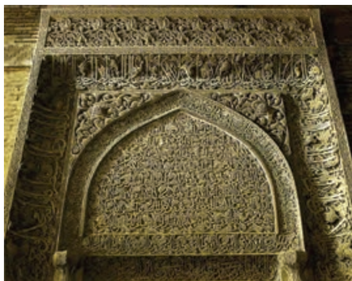
▲ شکل ۹-۱ محراب مسجد جامع اصفهان

میراث هنری دیگری که در این دوره به حد شکوفایی خود می‌رسد، نگارگری است. در این دوره تحریم نگارگری تا اندازه‌ای شکسته شد و جنبه همگانی‌تری یافت. این زمان با بهره‌گیری از تأثیرات هنری پیشین، نگارگری ناب ایرانی پدید آمد.