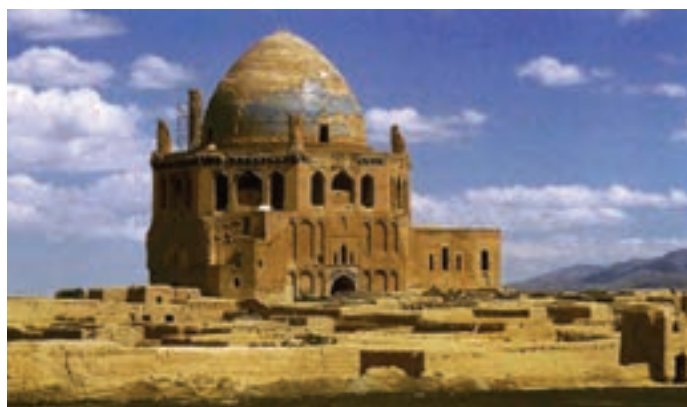
▲ شکل ۱-۱۰ الف - گنبد سلطانیه، آرامگاه اولجایتو، زنجان

در سده‌های هفتم و هشتم هجری با حملات فراگیر مغول به مرز و بوم ایران برای مدتی اوضاع نابسامانی شکل گرفت. اما با درایت اندیشمندان و سیاستمداران ایرانی و نفوذ آنان به دستگاه حکومت این اقوام وحشی شرایط به گونه دیگری رقم خورد. همین مردمانی که با نگرشی وحشیانه و خونخوار تربیت یافته بودند به فرمانروایان هنردوست تبدیل شدند. از جمله اقدامات مهم فرهنگی در این دوره ریع رشیدی ۱ است. در این دوره شاهد برپایی برخی از عظیم‌ترین و پیچیده‌ترین بناها و همچنین هنرهای متفاوت هستیم. این دوران زمینه‌ساز حکومت‌های متفاوت مغولی از جمله بر سرکار آمدن ایلخانان، جلایریان، آل مظفر و ... می‌باشد.