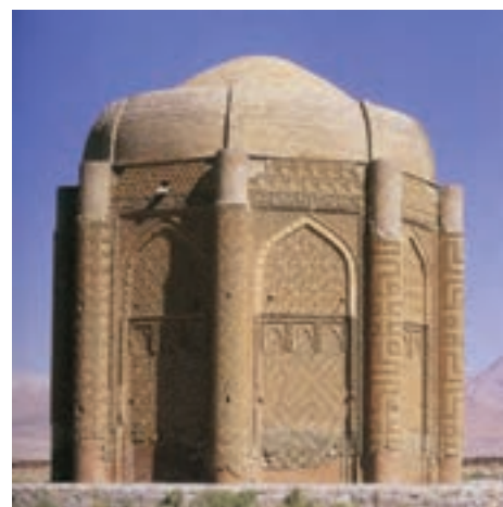
▲ شکل ۹-۴- برج خرقان، نزدیک قزوین

همچنین نخستین آرامگاه‌های ایران، در سده چهارم و پنجم هجری است که دارای ارزش و اهمیت تاریخی و هنری می‌گردند. این آرامگاه‌ها به صورت برج مانند ساخته می‌شد. انواع آن را می‌توان به صورت برج آرامگاهی با نقشه گرد از جمله گنبدکاووس (شکل ۹-۱) و یا آرامگاه‌های قبه‌ای شکل با نقشه چند ضلعی از جمله برج‌های خرقان (شکل ۹-۴) و همچنین برج‌های چند ضلعی و ترکیبی از جمله گنبد سرخ و کبود مراغه (شکل‌های ۹-۵ و ۹-۶) مشاهده کرد. از دیگر نوآوری‌های این دوره ساخت میل ۱ و مناره ۲ است که قدمتی کهن در معماری ایران دارد و نخستین میل تاریخ‌دار را می‌توان در میل ازدها ۳ ممسنی متعلق به دوره اشکانی دانست (شکل ۹-۷). در این دوره مناره‌ها به شیوه‌های مختلف ستاره شکل یا استوانه‌ای ساخته شد (شکل ۹-۸).