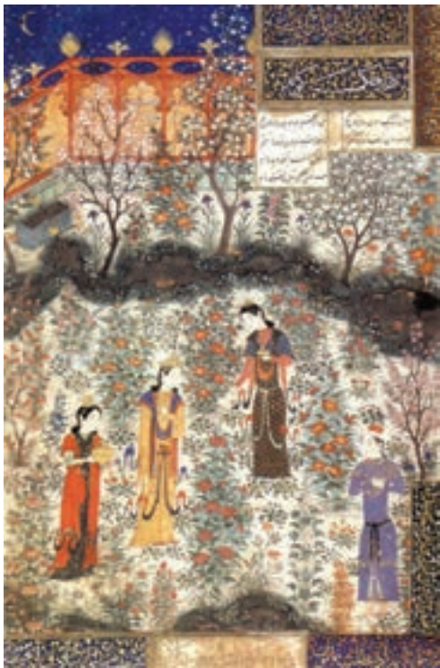
▲ شکل ۱۵-۱۰- برگي از کتاب دیوان خواجه کرمانی

مکتوب و سنت کتابت داشتند و ابداعاتی را در زمینه نقاشی و نگارگری ایجاد کردند. در این مکتب بر انسان تأکید تصویری بسیاری شده است. پیکره‌ها بیش از حد بلند قامت و بی‌تناسب با منظره و معماری کشیده می‌شد، پیرامون وی را نقوش گیاهی بسیاری پر می‌کرد و زمینه افق در بالا به کار می‌رفت. همچنین نوعی هماهنگی خط و رنگ رعایت می‌شد (شکل ۱۴-۱۰).