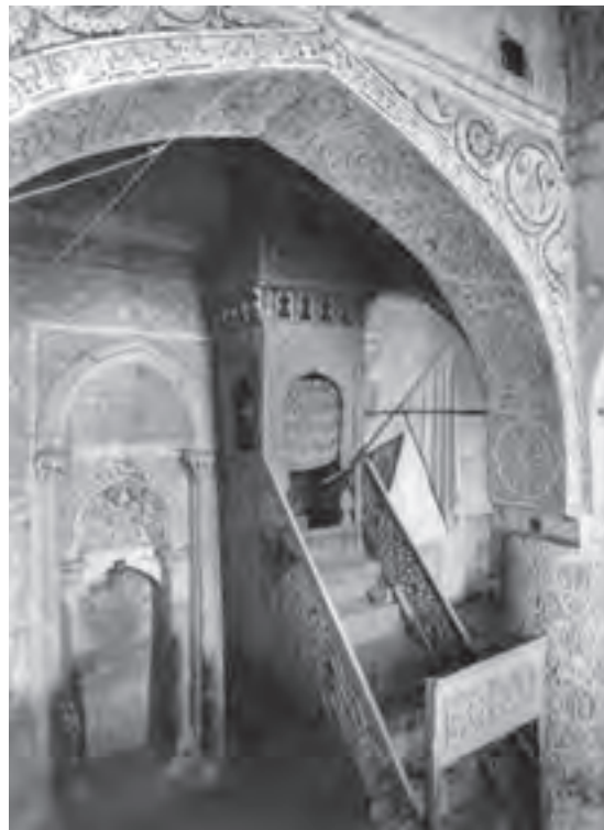
▲ شکل ۲۲-۱۰- منبر چوبی مسجد جامع نائین

با وجود نمونه‌های اندک آثار فلزی در این دوره از جمله شمعدان‌های فلزی (شکل ۲۱-۱۰) باز هم نمی‌توان روش تولید این هنر در سده‌های هفتم و هشتم هجری را روشن نمود اما در برخی نسخه‌های مصور، ابزارهای فلزی گوناگونی دیده می‌شود. هنر چوب نیز در این دوره براساس آثار باقیمانده، دارای اهمیت بوده است که از نمونه‌های شاخص آن می‌توان به منبر مسجد جامع نائین (شکل ۲۲-۱۰)، منبر مسجد جامع اصفهان و رحل چوبی اشاره کرد.