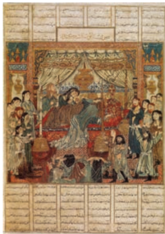
▲ شکل ۱۰-۱۰- برگی از کتاب شاهنامه بزرگ مغول، مکتب تبریز

همزمان با دوران تسلط ایلخانان مغول، نگارگران شیراز توانستند میراث‌دار سنت‌های پیشین هنری ایران در نگارگری باشند. آنها همت بسیاری در تولید آثار