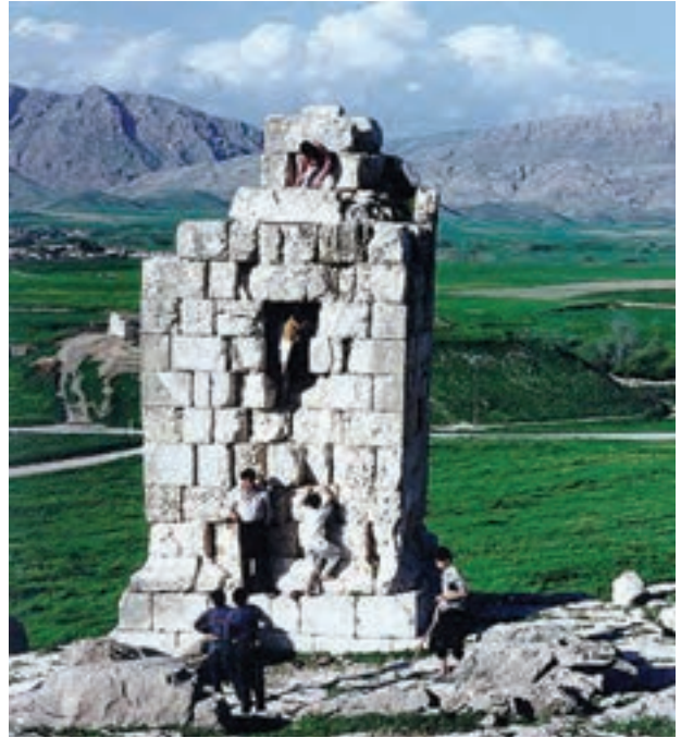
▲ شکل ۷-۹- میل ازدها، نورآباد ممسنی، فارس، دوره اشکانی

توجه به معماری‌های غیرمذهبی بنا به ضرورت و نیاز فرمانروایان این دوره در شکل کاخ‌ها (شکل ۹-۹) و دیگر بناهای مرتبط با تجارت، بازرگانی و سفر از جمله رباط‌ها و کاروانسراها (شکل ۹-۱۰) به ظهور رسیده است. در تمامی بناهای این دوره از مصالح و فنون ساخت عالی، طاقسازی، گنبد و عناصر مختلف معماری به خوبی بهره‌برداری شده است. همچنین کتیبه‌نگاری در تمامی بخش‌های بنا به کار رفته و توانسته ضمن نقش تزئینی، جنبه‌های کاربردی آن نیز مورد توجه باشد.