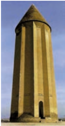
▲ شکل ۹-۱- آرامگاه قابوس و شمسگیر، گنبد رُک (گنبد کاووس، سده چهارم و پنجم هجری)

شبستانی به ایوانی، ساخت بناهای چهار ایوانی، ایوان‌های پهن و کوتاه، قوس‌های جناقی یا تیزه‌دار نام برد (تصویر ۹-۱). توجه زیاد به آجرکاری، ساخت مناره و برج‌های آرامگاهی، کاربرد کاشی تک لعاب، گچ‌بری و نوعی گنبدسازی مخروطی معروف به «رُک» از دیگر ویژگی‌های معماری این دوره است. (تصویر ۹-۲ الف و ب) شیوه ساخت بناها به حدی مستحکم و بادوام بود که قادر به تحمل گچ‌بری‌های انبوه و فراوان بودند. ساخت مساجد در این دوره از ساختار بناهای تک یا دو ایوانه (مانند مسجد جامع اصفهان) به چهار ایوانه تبدیل شد (شکل ۹-۲ الف و ب).