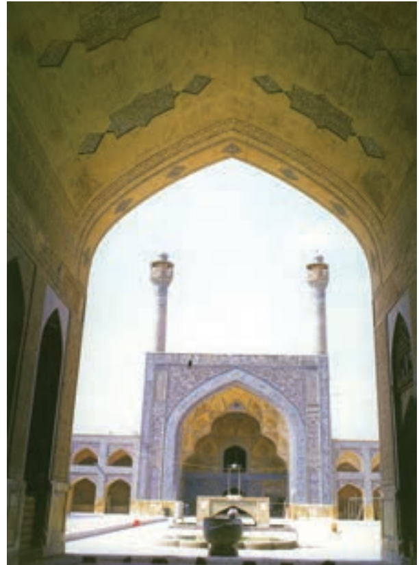
▲ شکل ۹-۲ الف- مسجد جامع، اصفهان، طرح تکمیلی سده‌های چهارم تا ششم هجری