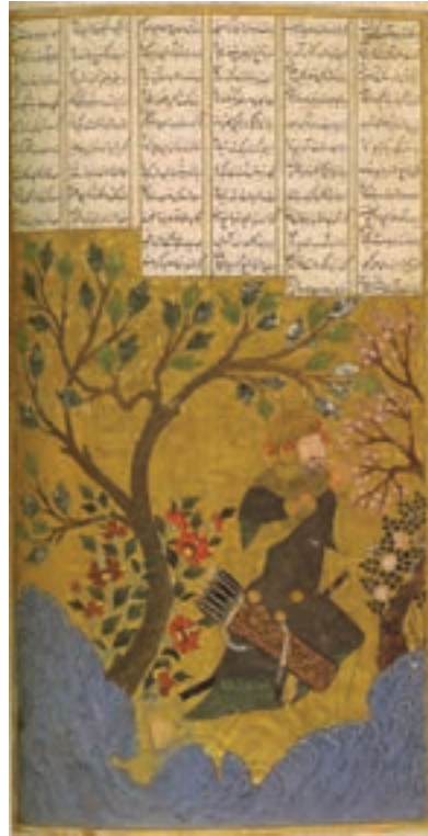
▲ شکل ۱۴-۱۰- برگي از مجموعه شعر مکتب شیراز سال ۸۰۰ هجری