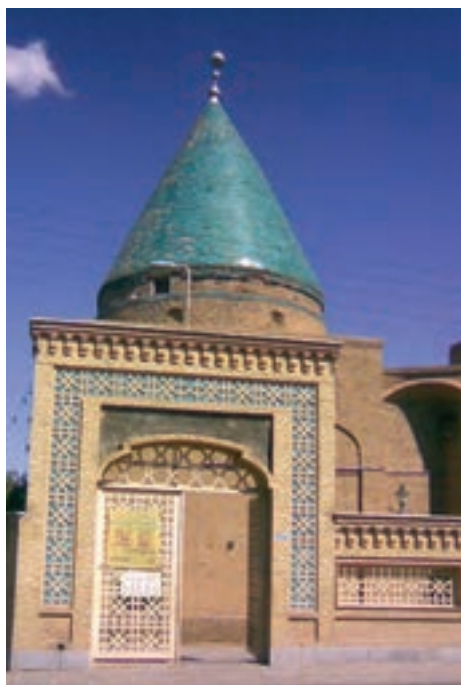
▲ شکل ۶-۱ آرامگاه بایزید بسطامی