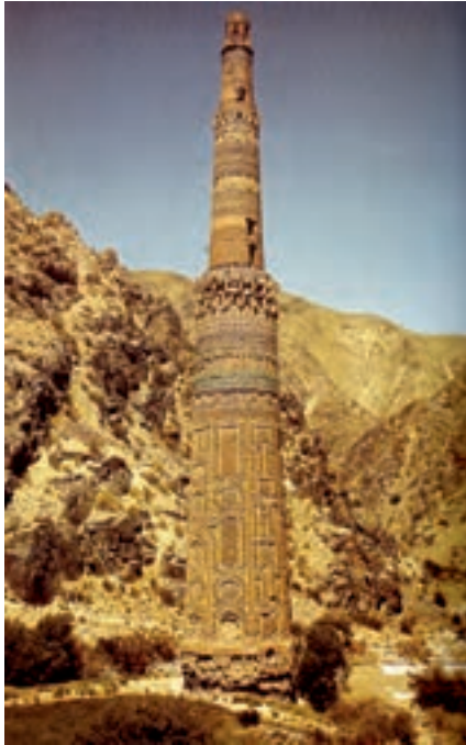
▲ شکل ۸-۹- منار جام، افغانستان