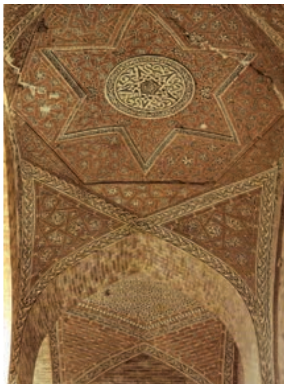
▲ شکل ۲-۱ نمای داخلی گنبد سلطانیه، زنجان

مهم‌ترین تحول معماری در این دوره که در برخی منابع آن را به شیوه آذری خوانده‌اند، شامل بلندی بنا، گنبد‌های ساق بلند، نقشه هشت ضلعی و گنبد دو پوسته و ایوان‌های باریک و بلند است. همچنین بلندتر شدن سقف اتاق‌ها و ارتفاع مناره‌ها، تزیینات بنا با پوشش کاشی، گچ کاری رنگی و مقرنس کاری ۱ است (شکل ۲-۱). شاخص‌ترین اثر معماری این دوره را می‌توان مسجد جامع ورامین (شکل ۳-۱)، مسجد جامع یزد (شکل ۴-۱)، مسجد جامع کرمان (شکل ۵-۱)، آرامگاه بایزید بسطامی (شکل ۶-۱)، آرامگاه شیخ عبدالصمد