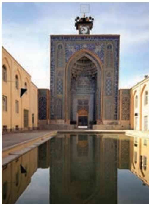
▲ شکل ۵-۱ مسجد جامع کرمان