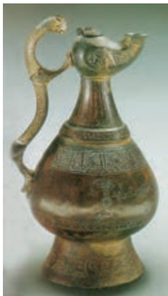
▲ شکل ۹-۱۵- ظرف فلزی

فلزکاران نیز در این دوره همه گونه اشیاء زیبا را به شیوه‌های گوناگون فلزکاری می‌ساختند و بیشترین شکل‌ها و نقش‌های به‌جا مانده نقوش جانوری، پرندگان و یا موجودات تلفیقی است. شاخص اصلی شکل ظروف در کاربردهای مختلف، نقش پرند و شاخه با تزیینات شبدری ۱ و ترنجی ۲ بوده است (شکل ۹-۱۵). همچنین بیشتر این نقوش بر روی گچ‌بری‌ها و سفالگری نیز دیده می‌شود. هنر سفالگری در این دوره نیز به تدریج از لحاظ کمیت و کیفیت پیشرفت کرد و به موازات هنر فلزکاری مفرغی به عالی‌ترین درجه خود نائل گردید. پخت سفال‌هایی خاص و نازک به نام «پوست تخم مرغی» که با طرح‌های ظریف شاخ و برگ گیاهی تزیین شده و به وسیله لعاب شفاف قلیایی پوشانده شده بود، در این دوره به وجود آمد (شکل ۹-۱۶). وجود ظروف با تزیین مینایی ۳ که از نظر ظرافت و تنوع نقوش با نسخه‌های خطی این دوره قابل مقایسه است، بر همکاری نگارگران و سفالگران دلالت دارد. بیشترین