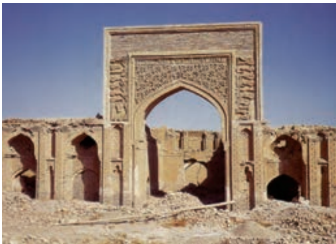
▲ شکل ۱۰-۹- رباط شرف، خراسان

توجه به معماری‌های غیرمذهبی بنا به ضرورت و نیاز فرمانروایان این دوره در شکل کاخ‌ها (شکل ۹-۹) و دیگر بناهای مرتبط با تجارت، بازرگانی و سفر از جمله رباط‌ها و کاروانسراها (شکل ۹-۱۰) به ظهور رسیده است. در تمامی بناهای این دوره از مصالح و فنون ساخت عالی، طاقسازی، گنبد و عناصر مختلف معماری به خوبی بهره‌برداری شده است. همچنین کتیبه‌نگاری در تمامی بخش‌های بنا به کار رفته و توانسته ضمن نقش تزئینی، جنبه‌های کاربردی آن نیز مورد توجه باشد.