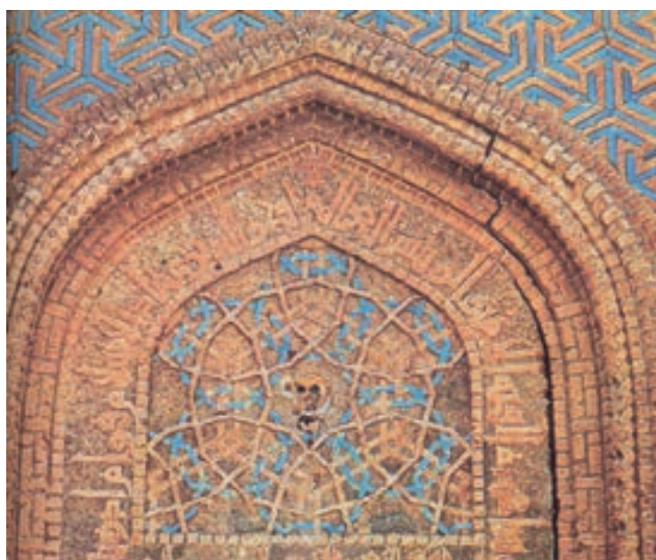
▲ شکل ۹-۶- گنبد سرخ، مراغه، آذربایجان شرقی