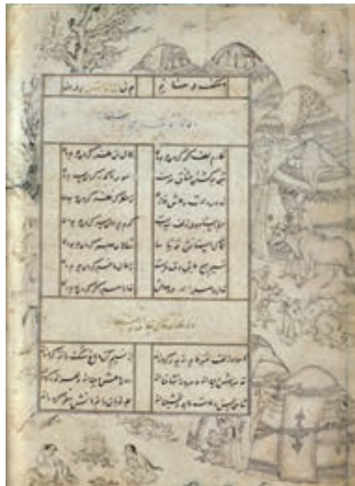
▲ شکل ۱۶-۱۰ - تشعير، برگي از کتاب ديوان سلطان احمد جلایر

سفالگری در این دوره نیز مورد توجه بوده است و از مهم‌ترین مراکز تولید سفال کاشان، ری و سلطان‌آباد است. سفالگران کاشانی به دلیل دارا بودن امکانات منطقه‌ای رشد قابل ملاحظه‌ای در سفالگری داشتند. آنها توانستند در این دوره نوشته‌های برجسته‌ای را به نقاشی بیفزایند و فن مشبک‌سازی ظروف سفالین را به کمال برسانند. همچنین در تزیین از طراحی و خطاطی و شیوه نگارگری بهره بردند (شکل ۱۸-۱۰). از مناطق رقیب کاشان بایستی به ری اشاره کرد که غالباً بر روی سفالینه‌ها موضوعاتی از جمله مجالس شکار یا چوگان را بر زمینه سفید یا لاجوردی به همراه نقش ترنج‌های زیبا و پرکار استفاده می‌کردند (شکل ۱۹-۱۰). همزمان شیوه سلطان‌آباد با نوعی ترنج چهارپر که درون آن را با تصاویر بسیار زنده از جمله گوزن و آهو پر می‌کردند به شیوه‌ای خاص و بدیع مبدل شد. در آن طرح شکوفه‌هایی با خط‌های باریک آبی روی زمینه‌های تاریک اجرا می‌شد (شکل ۲۰-۱۰ الف و ب).