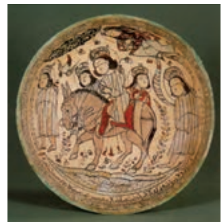
▲ شکل ۱۸-۱۰ - ظرف سفالین، کاشان

سفالگری در این دوره نیز مورد توجه بوده است و از مهم‌ترین مراکز تولید سفال کاشان، ری و سلطان‌آباد است. سفالگران کاشانی به دلیل دارا بودن امکانات منطقه‌ای رشد قابل ملاحظه‌ای در سفالگری داشتند. آنها توانستند در این دوره نوشته‌های برجسته‌ای را به نقاشی بیفزایند و فن مشبک‌سازی ظروف سفالین را به کمال برسانند. همچنین در تزیین از طراحی و خطاطی و شیوه نگارگری بهره بردند (شکل ۱۸-۱۰). از مناطق رقیب کاشان بایستی به ری اشاره کرد که غالباً بر روی سفالینه‌ها موضوعاتی از جمله مجالس شکار یا چوگان را بر زمینه سفید یا لاجوردی به همراه نقش ترنج‌های زیبا و پرکار استفاده می‌کردند (شکل ۱۹-۱۰). همزمان شیوه سلطان‌آباد با نوعی ترنج چهارپر که درون آن را با تصاویر بسیار زنده از جمله گوزن و آهو پر می‌کردند به شیوه‌ای خاص و بدیع مبدل شد. در آن طرح شکوفه‌هایی با خط‌های باریک آبی روی زمینه‌های تاریک اجرا می‌شد (شکل ۲۰-۱۰ الف و ب).