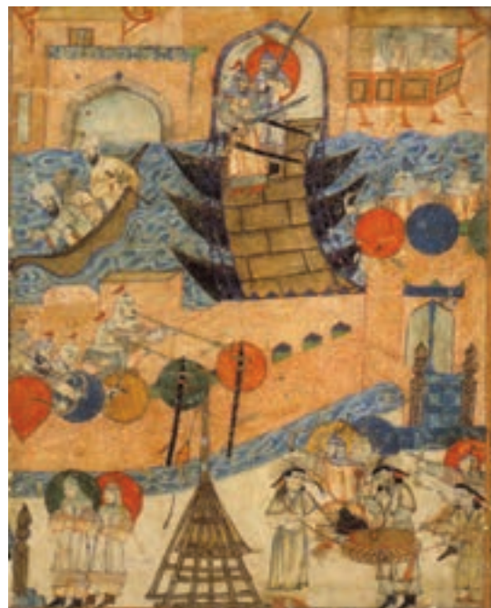
▲ شکل ۱۱-۱۰- برگی از کتاب جوامع التواریخ، رشیدالدین فضل‌الله