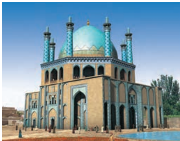
▲ شکل ۱-۱۰ ب - طرح بازسازی شده گنبد سلطانیه

در سده‌های هفتم و هشتم هجری با حملات فراگیر مغول به مرز و بوم ایران برای مدتی اوضاع نابسامانی شکل گرفت. اما با درایت اندیشمندان و سیاستمداران ایرانی و نفوذ آنان به دستگاه حکومت این اقوام وحشی شرایط به گونه دیگری رقم خورد. همین مردمانی که با نگرشی وحشیانه و خونخوار تربیت یافته بودند به فرمانروایان هنردوست تبدیل شدند. از جمله اقدامات مهم فرهنگی در این دوره ریع رشیدی ۱ است. در این دوره شاهد برپایی برخی از عظیم‌ترین و پیچیده‌ترین بناها و همچنین هنرهای متفاوت هستیم. این دوران زمینه‌ساز حکومت‌های متفاوت مغولی از جمله بر سرکار آمدن ایلخانان، جلایریان، آل مظفر و ... می‌باشد.