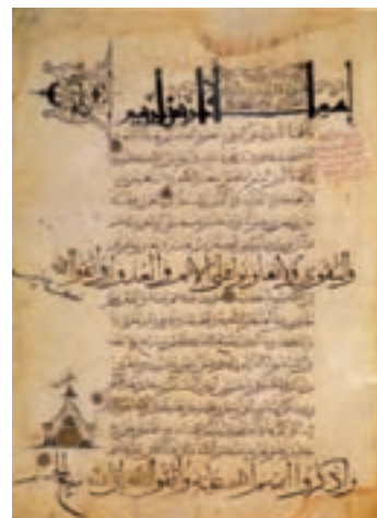
▲ شکل ۹-۱۱- برگه از قرآن کریم با خطوط مختلف

مهم‌ترین ویژگی هنر نگارگری این دوران را می‌توان در استفاده رنگ سرخ زمینه، پرکردن زمینه با نقش اسلیمی، پوشش لباس‌های بدون چین و چروک و شیوه ترسیم انتزاعی نقوش گیاهی دانست. همچنین پیکره‌های کوتاه قامت، صورت‌های تمام رخ با دهان تنگ و چشمان مورب و قلم‌گیری (که بازمانده از سنت‌های نقاشی مانوی است) از دیگر ویژگی‌های نگارگری این دوره است. از نقش‌های پارچه، ظروف فلزی و سفالینه‌ها می‌توان وجود هنر نگارگری بسیار ظریفی را بازشناخت. بنا به اسناد تاریخی، نخستین نمونه نقاشی کتاب در این دوره اندرزنامه (قابوس‌نامه) است. اما شاخص‌ترین اثر کتاب فارسی مصور، کتاب «ورقه و گلشاه» است که در آن پیوند شعر و نقاشی به‌طور کامل مشهود است (شکل ۹-۱۲). نقاشی این دوره ریشه در نگرش تصویرسازی کهن ایرانی دارد.