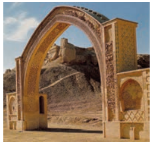
▲ شکل ۹-۹- کاخ لشکری بازار، غزنه، افغانستان