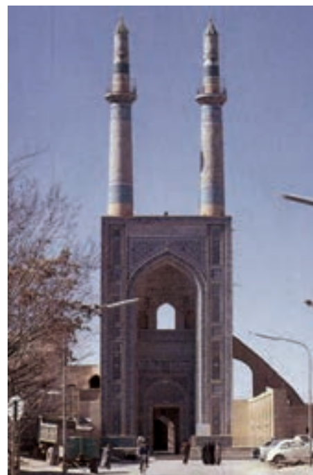
▲ شکل ۴-۱ مسجد جامع یزد