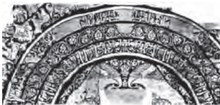
▲ شکل ۹-۱۴- بخشی از پارچه با طرح پرند

فلزکاران نیز در این دوره همه گونه اشیاء زیبا را به شیوه‌های گوناگون فلزکاری می‌ساختند و بیشترین شکل‌ها و نقش‌های به‌جا مانده نقوش جانوری، پرندگان و یا موجودات تلفیقی است. شاخص اصلی شکل ظروف در کاربردهای مختلف، نقش پرند و شاخه با تزیینات شبدری ۱ و ترنجی ۲ بوده است (شکل ۹-۱۵). همچنین بیشتر این نقوش بر روی گچ‌بری‌ها و سفالگری نیز دیده می‌شود. هنر سفالگری در این دوره نیز به تدریج از لحاظ کمیت و کیفیت پیشرفت کرد و به موازات هنر فلزکاری مفرغی به عالی‌ترین درجه خود نائل گردید. پخت سفال‌هایی خاص و نازک به نام «پوست تخم مرغی» که با طرح‌های ظریف شاخ و برگ گیاهی تزیین شده و به وسیله لعاب شفاف قلیایی پوشانده شده بود، در این دوره به وجود آمد (شکل ۹-۱۶). وجود ظروف با تزیین مینایی ۳ که از نظر ظرافت و تنوع نقوش با نسخه‌های خطی این دوره قابل مقایسه است، بر همکاری نگارگران و سفالگران دلالت دارد. بیشترین