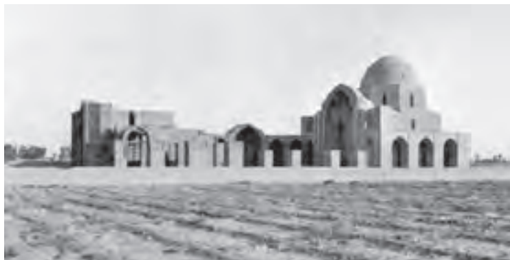
▲ شکل ۳-۱ مسجد جامع ورامین