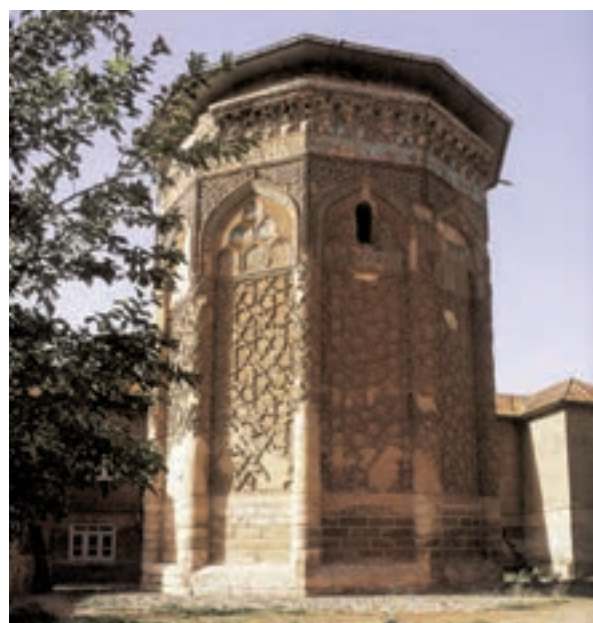
▲ شکل ۹-۵- گنبد کبود، مراغه، آذربایجان شرقی