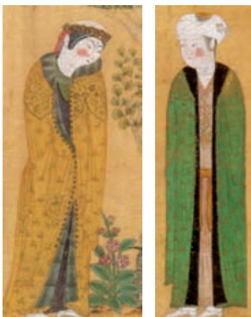
▲ شکل ۲۳-۱۰ نمونه‌های پارچه و لباس مغولی (برگرفته از آثار نگارگری)

به طور کلی در این دو سده نقش‌ها در آثار مختلف (پارچه، قلم‌زنی، کتاب‌آرایی، نگارگری و...) به شکل طرح‌های آزاد و گردان، عناصری چون گل نیلوفر آبی، ازدها، سیمرخ، ابرهای پیچان، پرندگان در حال پرواز و حیوانات در حال جست و خیز مشاهده می‌شود.