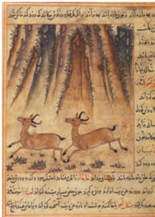
▲ شکل ۱۲-۱۰- برگی از کتاب منافع الحيوان