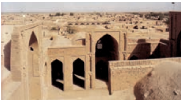
▲ شکل ۹-۳- مسجد جامع زواره، اصفهان، سده چهارم و پنجم هجری

پس از ساخت این بنا الگویی در مسجدسازی پدید می‌آید که مورد الهام دیگر بناها می‌شود. مسجد جامع زواره (شروع ساخت ۵۱۵ هـ.) نخستین نمونه کامل تاریخ‌دار به شیوه چهار ایوانی است (شکل ۹-۳).