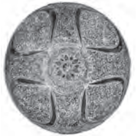
▲ شکل ۱۹-۱۰- ظرف سفالین، سده ۸ هجری، ری