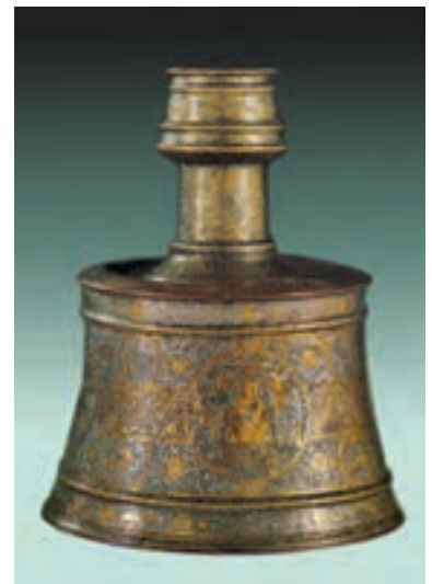
▲ شکل ۲۱-۱۰- پایه شمعدان فلزی، شیراز