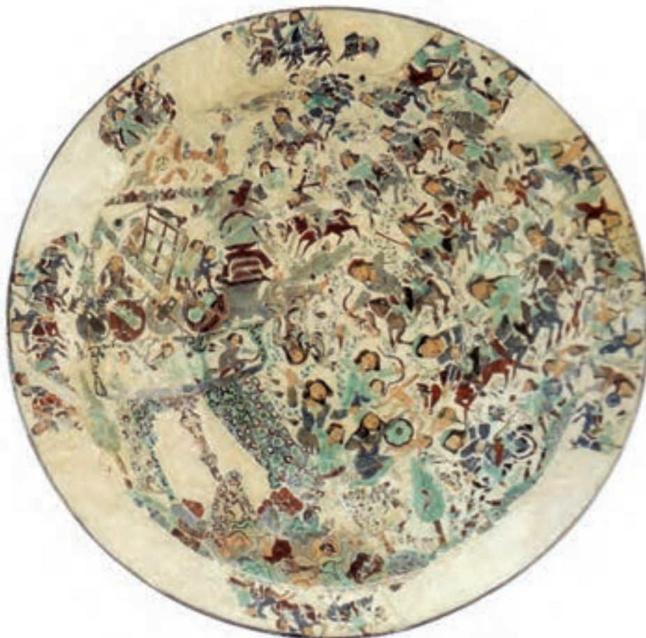
▲ شکل ۱۷-۹ ظرف مینایی، دوره خوارزمشاهی