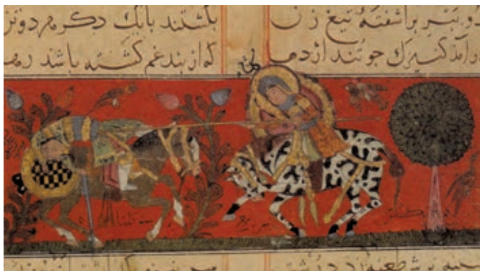
▲ شکل ۹-۱۲- برگه از کتاب ورقه و گلشاه

در بین سده‌های چهارم تا ششم هجری مهارت بافندگی پارچه منقوش نیز به کمال رسید. در این پارچه‌ها طرح، نقش و بافت با وحدتی بی‌نظیر باعث شده تا آثار نفیسی به وجود آید. هنرمند با آوردن درخت مقدس زندگی ۱ ، تاک‌های پیچاپیچ، نخل، خوشنویسی و هیكل‌های نرم و لطیف جانوران و