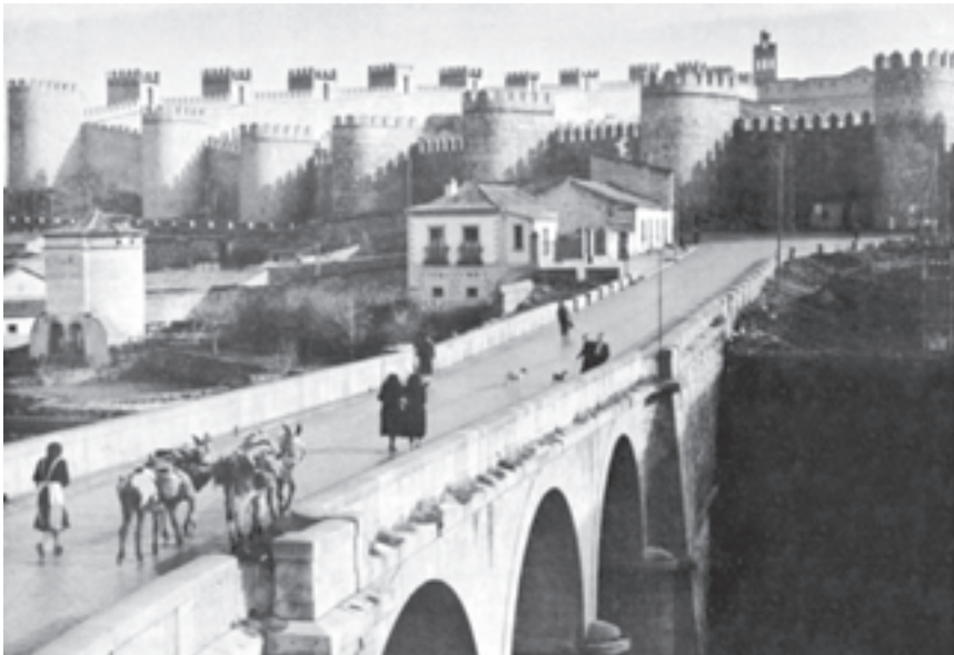
دیواره‌های شهر باستانی آویلا - مرکز اسپانیا - ساخت مسلمانان شمال آفریقا

در قرون وسطی تنها یک کشور بود که کاملاً از دایره‌ی درگیری زبان لاتین و زبان‌های عامیانه بیرون می‌زیست و آن اسپانیای مسلمان بود که ادبیات و به طور کلی تمدن اسلامی آن تأثیر عظیمی در دنیای غرب داشت. شعر عربی آندلس در قرون دهم و یازدهم، شاید به استثنای شعر سلتی، یگانه شعر غیر لاتینی بود که در دنیای غرب حایز اهمیت بود. این شعر مستقیماً از شرق و به خصوص از بغداد می‌آمد که در آن زمان مرکز علمی و ادبی جهان اسلام بود. در اسپانیا نیز «قرطبه» چنین مقامی داشت. از این رو می‌توان شعر و تاریخ‌نگاری مسلمانان اسپانیا را در ردیف زبان‌های ملی نوزاد قرار داد؛ زیرا شاخه‌ای از شعر و تاریخ‌نگاری شرق مسلمان بود و چه شاخه‌ی سترگی! شعری که با همه‌ی ظرافت‌های آثار شاعران دربار خلفای بغداد برابری می‌کرد و ادبیات و فلسفه‌ای چنان غنی از اندیشه‌ی فلاسفه‌ی باستانی و مسایل انسانی، که می‌توان با استناد به آن، از نوعی انسان‌گرایی اسلامی اسپانیا سخن گفت. چنان که گفتیم غرب بیگانه با ادبیات و فلسفه‌ی یونان قدیم، از طریق اسپانیای مسلمان بود که دوباره با آثار بزرگان باستان آشنا شد.