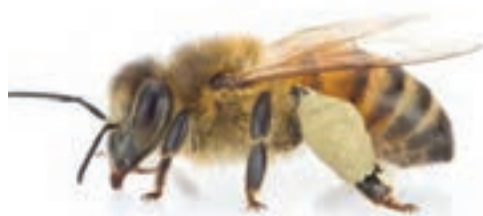
زنبور کارگر (طول بدن ۱ سانتی‌متر)

هر کلنی زنبور عسل از یک ملکه، چند صد زنبور نر و چندین هزار زنبور کارگر تشکیل شده است.