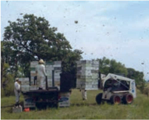
انتقال کندوها به داخل کامیون

مکان فعلی زنبورستان منتقل کرد و پس از چند روز آنها را به مکان مورد نظر که ممکن است در یک یا چند کیلومتری از محل زنبورستان باشد، انتقال داد.