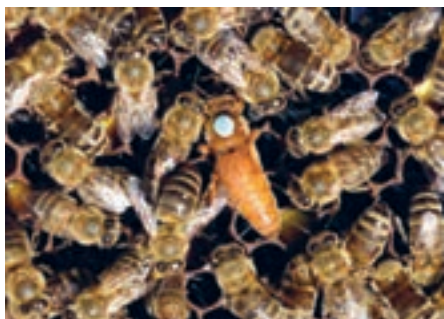
زنبور عسل ایتالیایی

زنبور عسل معمولی در نقاط مختلف کره زمین دارای نژادهای مختلفی است، هر یک خصوصیات ویژه‌ای دارند که نژادهای معروف آن به شرح ذیل می‌باشد: