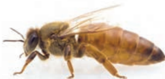
زنبور ملکه (طول بدن ۲ سانتی‌متر)

زنبور عسل نر: این نوع زنبور از تخم بدون نطفه تولید می‌شود، جثه آن پهن و حجیم‌تر از زنبور کارگر است و بدنش پوشیده از مو است هنگام پرواز صدای بال آنها بیش از زنبوران کارگر است. زنبور نر قادر به جمع‌آوری گرده و شهد نیست، در فعالیت‌های کلنی نیز دخالتی ندارد. تنها وظیفه آن جفت‌گیری با ملکه‌های جوان است و بعد از اتمام فصل جفت‌گیری جمعیت آنها کاهش می‌یابد و در صورت کمبود منابع غذایی معمولاً از کندو رانده شده یا از سوی کارگران تغذیه نمی‌شوند تا بمیرند؛ زیرا به تنهایی قادر به تغذیه نمی‌باشند. زنبور عسل کارگر: این زنبور عسل از نظر جثه کوچک‌ترین عضو کلنی است، تمام کارهای داخل و خارج از کندو مانند تمیز کردن کندو، رسیدگی به نوزادان و ملکه، جمع‌آوری گرده و شهد گل، ساختن حجره، حفاظت از کندو و غیره بر عهده آنها است.