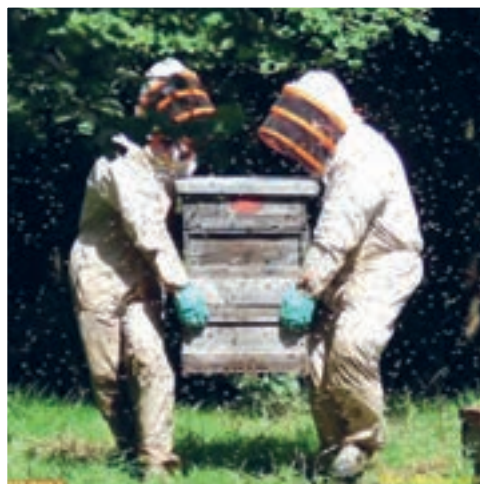
انتقال کندو در محل زنبورستان

اگر منظور از جابه‌جایی کلنی‌های زنبور عسل انتقال به فاصله نسبتاً کم مثلاً چند متر در محل زنبورستان باشد. ساده‌ترین کار این است که روزانه کندوی مورد نظر را حداکثر یک متر به سمت محل جدید انتقال داد. با این کار زنبورها قادر خواهند بود موقعیت کندوی خود را در حافظه ثبت کرده و به اشتباه وارد کلنی دیگری نشوند و عمل انتقال آنها انجام گیرد.