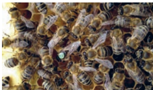
زنبور عسل کارنیولان

ب) نژاد کارنیولان یا زنبور عسل خاکستری: این نژاد از نواحی جنوبی سلسله جبال آلپ در اتریش