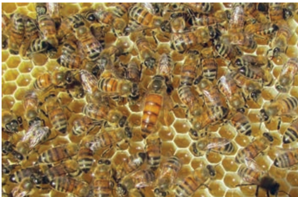
زنبور عسل ایرانی

ه) نژاد ایرانی: یکی از نژادهای گونه زنبور عسل معمولی است. چون در طول سالیان متمادی خود را با شرایط محیطی ایران سازگار کرده است، در مقایسه با نژادهای اصلاح شده خارجی سازگاری بیشتری با شرایط محیطی کشور ایران دارد.