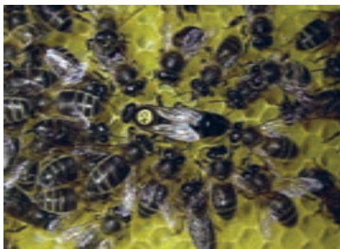
زنبور عسل تیره اروپا

ج) نژاد زنبور عسل تیره اروپا: موطن اصلی این نژاد تمام اروپا، غرب و شمال آلپ و مرکز