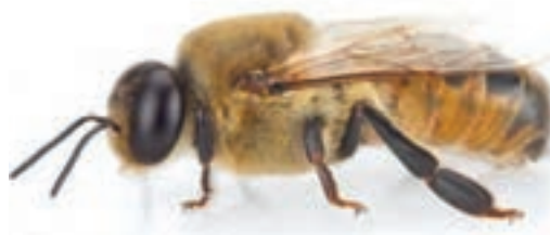
زنبور نر (طول بدن ۱/۵ سانتی‌متر)