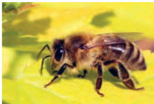
زنبور عسل معمولی