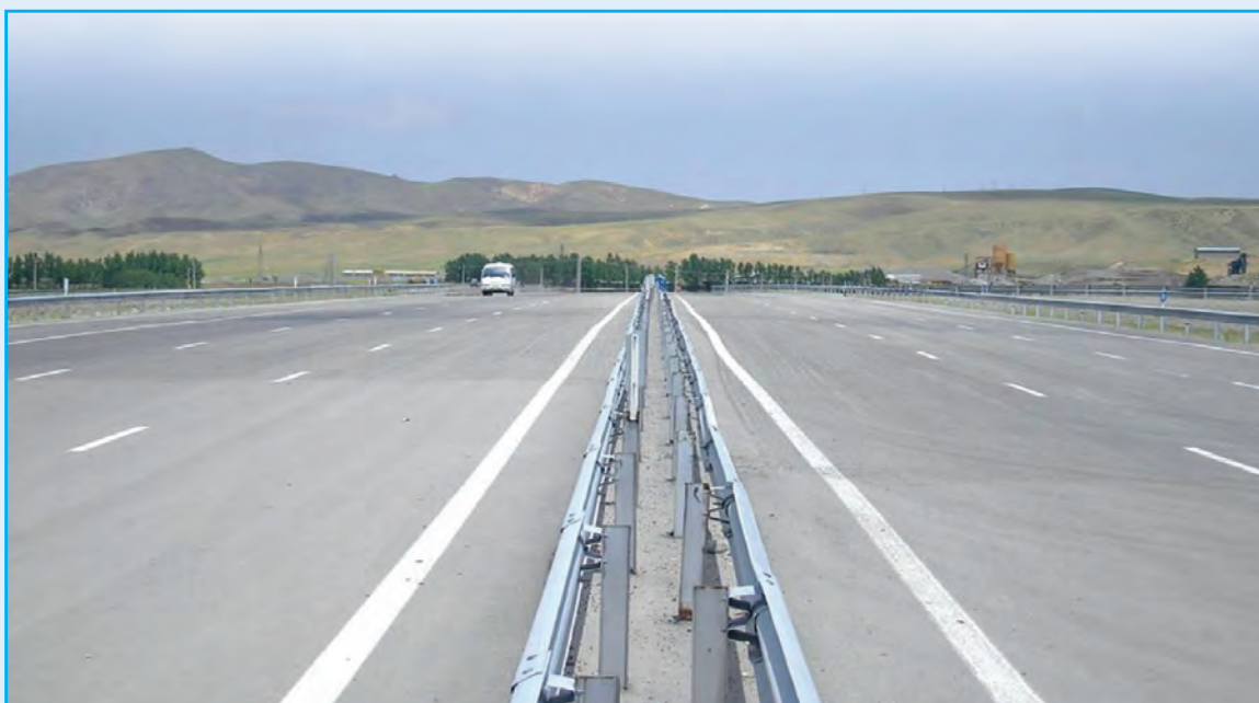
شکل ۴-۶- آزادراه تبریز- زنجان

۹- راه و ترابری : استان آذربایجان شرقی تا سال ۱۳۹۰، ۲۵۲/۱ کیلومتر آزادراه و ۲۹۸/۶ کیلومتر بزرگراه داشت. همچنین تا همین سال طول راه‌های اصلی استان ۱۰۲۹ کیلومتر و راه‌های فرعی ۱۷۴۴/۵ کیلومتر بوده است. طول راه‌های روستایی استان معادل ۱۰۴۲۳ کیلومتر بوده که ۴۳۴۸ کیلومتر (۴۲/۹ درصد) آن آسفالتی بوده است.