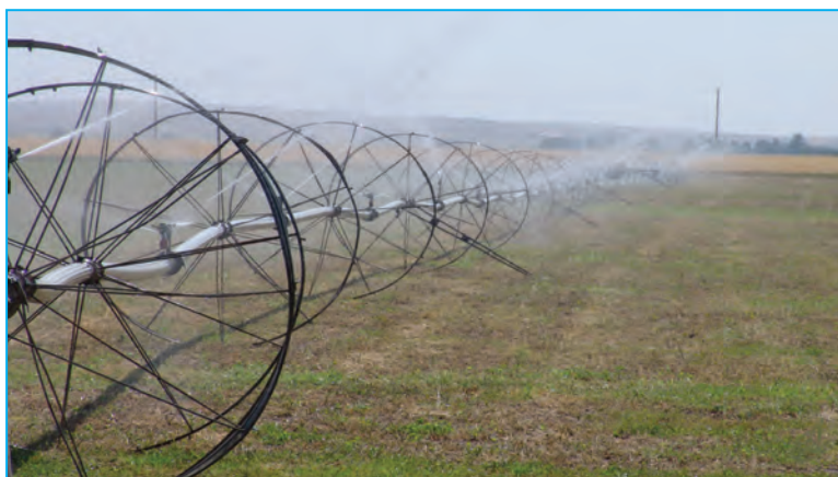
شکل ۲-۶- شیوه‌های نوین آبیاری در بخش کشاورزی در استان

۳- کشاورزی: بخش کشاورزی به عنوان بستری برای کسب اهداف توسعه در کشورهای مختلف امری ضروری قلمداد می‌شود. بخش کشاورزی به طور مستقیم از طریق تولید و صادرات بیشتر و به صورت غیر مستقیم از طریق افزایش تقاضا برای خدمات و فرآورده‌های صنعتی و تهیه مواد اولیه و تولید، به رشد اقتصادی کمک می‌کند و موجب ایجاد فرصت‌های شغلی جدید می‌شود. بخش کشاورزی سازمان یافته و یک پارچه می‌تواند به بهبود امنیت غذایی مردم و کاهش قیمت‌های محصولات غذایی و افزایش اشتغال و تولید و ایجاد پیوندهای اقتصادی مهم در زنجیره غذایی و ایجاد تأثیرات مثبت در محیط زیست کمک کند.