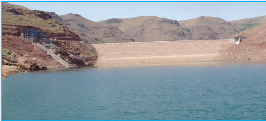
شکل ۳-۶- سد قلعه چای عجب‌شیر

۴- آب : بر اساس آمار سازمان آب منطقه‌ای استان، در حال حاضر مصرف آب‌های سطحی استان از طریق ۱۴۳ سد و بند مخزنی و بند انحرافی، ۷ ایستگاه پمپاژ و ۲۷ شبکه آبیاری و زه‌کشی انجام می‌گیرد. در سال ۱۳۹۰ شاخص بهره‌برداری از آب‌های سطحی و زیرزمینی استان به ترتیب ۵۳/۴ و ۷۹ درصد بوده است.