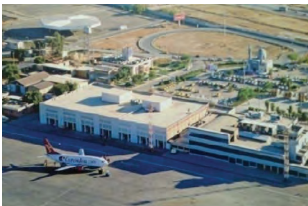
شکل ۹-۶- فرودگاه بین‌المللی اهواز