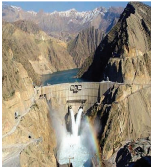
شکل ۴-۶- سد کارون ۳ بلندترین سد بتنی کشور

صنایع فلزی و غیرفلزی : صنایع فلزی استان به علت مجاورت با خلیج فارس و دارا بودن منابع سوختی فراوان از شرایط مناسبی برای توسعه برخوردار است. پس از پیروزی انقلاب اسلامی با ساخت و توسعه چهار کارخانه فولاد با تولید سالانه ۵ میلیون تن، خوزستان سهم عمده‌ای از تولید فولاد کشور را به خود اختصاص داده است. سایر طرح‌های در دست مطالعه مرتبط با بخش صنایع فلزی استان عبارت‌اند از: مجتمع ذوب و نورد خرمشهر، شرکت نورد و لوله کارون، فولاد شادگان و طرح فولاد اروند. در بخش تولید سیمان سه کارخانه با ظرفیت تولید ۸۳۰۰ تن در روز فعال‌اند. نیروگاه‌ها : در زمینه آب و برق قبل از پیروزی انقلاب اسلامی تنها دو سد مخزنی دز و شهید عباسپور با مجموع ۶/۶ میلیارد متر مکعب آب وجود داشت، ولی امروزه تعداد این سدها به شش مورد و گنجایش حجم آنها به حدود ۱۸ میلیارد متر مکعب افزایش یافت. ۶ سد مخزنی در مرحله ساخت و ۱۸ سد در دست مطالعه است. کرخه بزرگترین سد خاکی خاورمیانه، کارون ۳ مرتفع‌ترین سد بتنی و سد مسجد سلیمان (گدارلندر) مرتفع‌ترین سد خاکی کشور در استان قرار دارند. این سدها علاوه بر تولید برق کشور نقش مهمی در تأمین آب زمین‌های کشاورزی و صنایع استان را برعهده دارند.