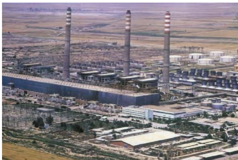
شکل ۵-۶- نمایی از توسعه نیروگاه حرارتی رامین اهواز