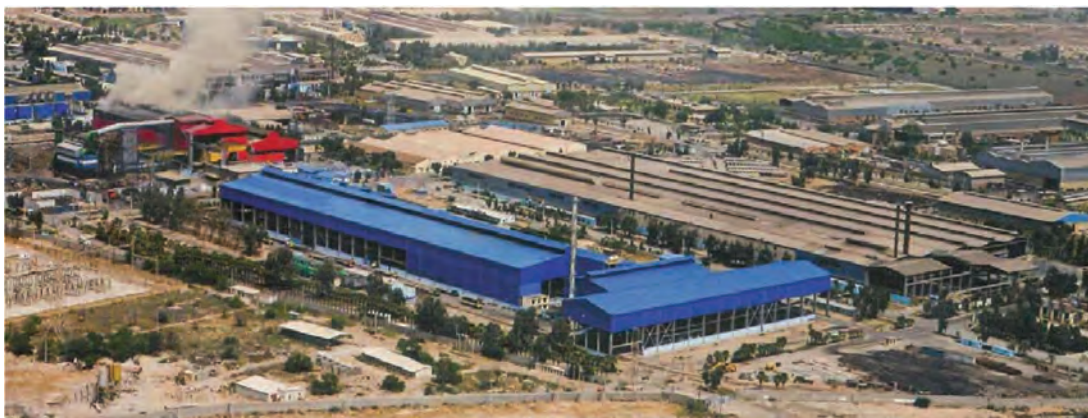
شکل ۲-۶- فولاد کویان - اهواز

چرا صادرات مشتقات پتروشیمی بر صادرات نفت خام اولویت دارد؟