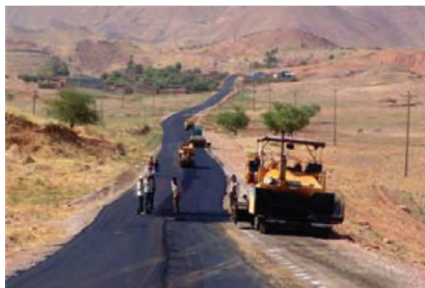
شکل ۸-۶- توسعه و احداث جاده‌های روستایی