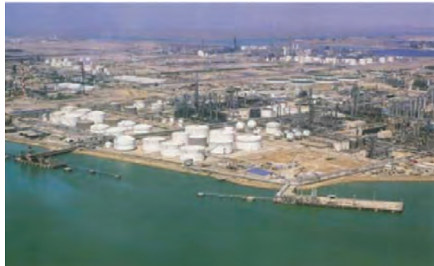
شکل ۱-۶- منطقه ویژه پتروشیمی ماهشهر