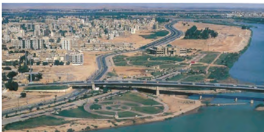
شکل ۱۰-۶- جاده ساحلی در حاشیه کارون - اهواز

توسعه عمران روستایی و محرومیت زدایی یکی از دستاوردهای انقلاب اسلامی بوده است. در بخش عمران روستایی مهم ترین اقدامات انجام شده در استان عبارت اند از: