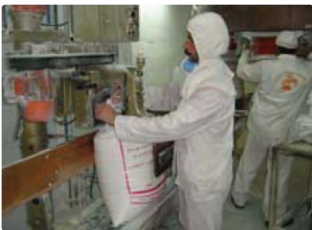
شکل ۳۴- صنایع غذایی بیضا