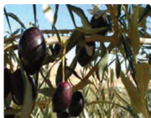
شکل ۱۱-۶- زیتون (اول)