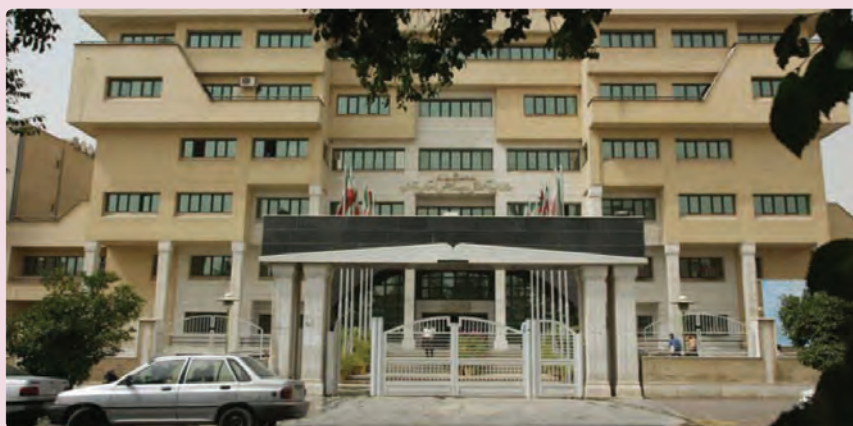
شکل ۳۷-۶ اداره کل آموزش و پرورش استان فارس

از نظر مراکز آموزش عالی نیز تعداد دانشجویان استان در سال 1357 تنها 6470 نفر بوده است که این تعداد در سال 87-1386 به 174,000 دانشجوی دانشگاه دولتی و آزاد اسلامی افزایش یافته است. تأسیس دانشگاه صنعتی شیراز و تبدیل آن به دو بخش دانشگاه شیراز و دانشگاه علوم پزشکی، تأسیس دانشگاه دولتی در فسا، جهرم و ... تأسیس 13 آموزشکده فنی در نقاط مختلف استان، تأسیس دانشگاه مجازی شیراز و تأسیس دوره دکتری در رشته‌های مختلف در دانشگاه شیراز، بخشی از اهداف علمی استان بوده است.