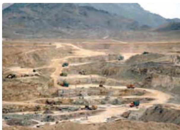
شکل ۳۱- کانی غیرفلزی