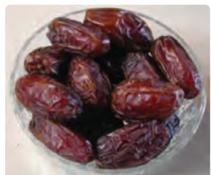
شکل ۱۵-۶- خرما (دوم)