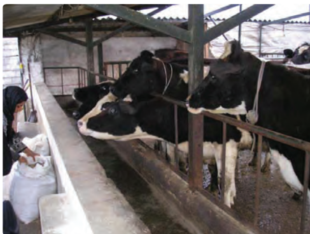
شکل ۲۰-۶- گاوداری صنعتی