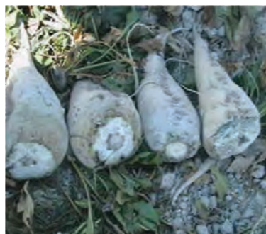
شکل ۱۸-۶- چغندر قند (سوم)