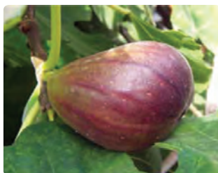
شکل ۶-۶- انجیر (اول)