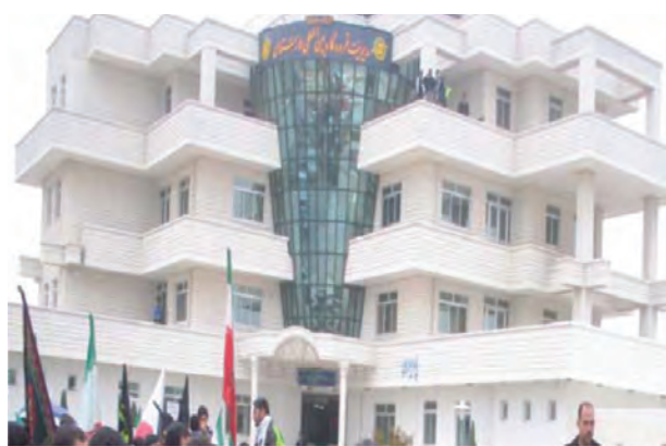
شکل ۲۷-۶- ساختمان فرودگاه لار

براساس آمارهای موجود طول شبکه راه‌های اصلی استان که در سال ۱۳۵۷ برابر ۱۲۲۱ کیلومتر بوده در سال ۱۳۸۶ به حدود ۲۲۲۹ کیلومتر افزایش یافته که ۵۶۹ کیلومتر آن بزرگراه است. تعداد فرودگاه‌های استان نیز که پیش از انقلاب اسلامی تنها به فرودگاه شیراز محدود می‌شد، امروز به شش فرودگاه فعال افزایش یافته است (آیا اسامی این فرودگاه‌ها را می‌دانید؟).