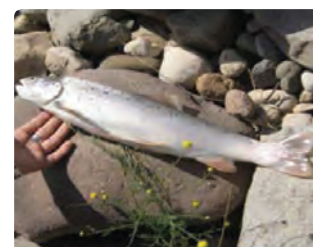
شکل ۱۳-۶- ماهی سرد آبی (اول)