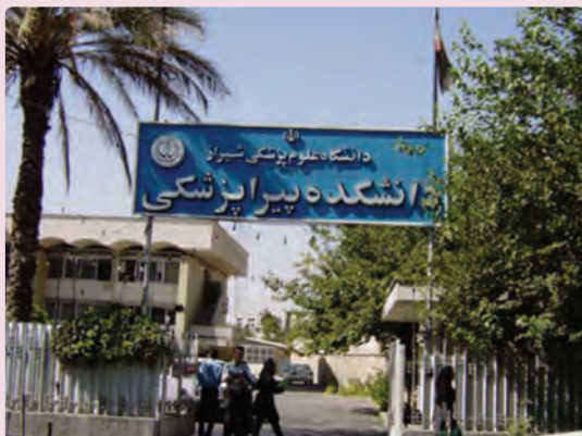
شکل ۳۶-۶ دانشگاه شیراز