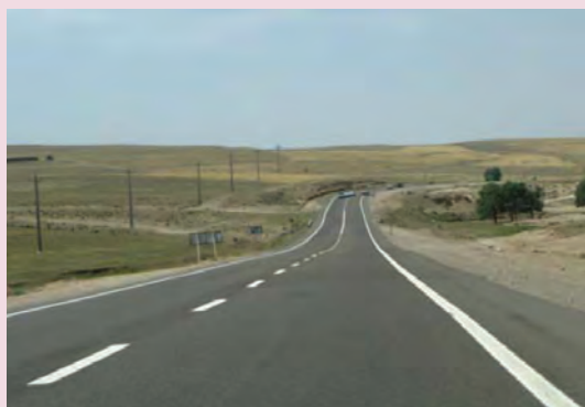
شکل ۴۳-۶- راه‌های بین شهری

در بخش انرژی کارهای بزرگی در استان فارس شروع شده که علاوه بر گسترش واحدهای تولیدی مجتمع پتروشیمی شیراز پالایشگاه گاز پارسیان که از آن به عنوان نقطه اتکا از کشور یاد می‌شود، کشف منابع جدید نیز در زمینه نفت در مناطق مختلف استان صورت گرفته است و امید می‌رود در زمینه صنعت نفت استان فارس قدم‌های بزرگی در آینده برداشته شود.