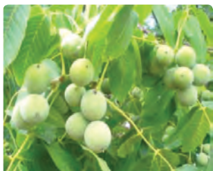
شکل ۱۴-۶- گردو (دوم)