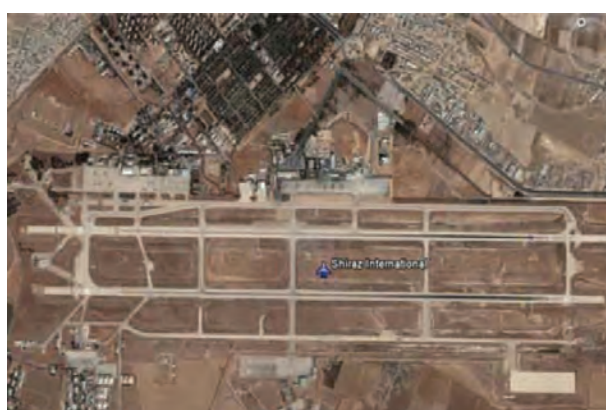
شکل ۲۶-۶- فرودگاه شیراز