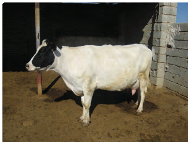
شکل ۱۹-۶- گاوداری صنعتی

علاوه بر فعالیتهای زراعی و باغی در زمینه دامپروری و تولیدات دامی و پرورش آبزیان و ماهیان پرورشی روستائیان و عشایر فارس توانسته‌اند سهم عمده‌ای از تولید گوشت قرمز و سفید کشور را به خود اختصاص دهند. جدول ۲-۶ بخشی از فعالیتهای دامپروری و تولیدات آن را در سال ۱۳۸۶ نشان می‌دهد.