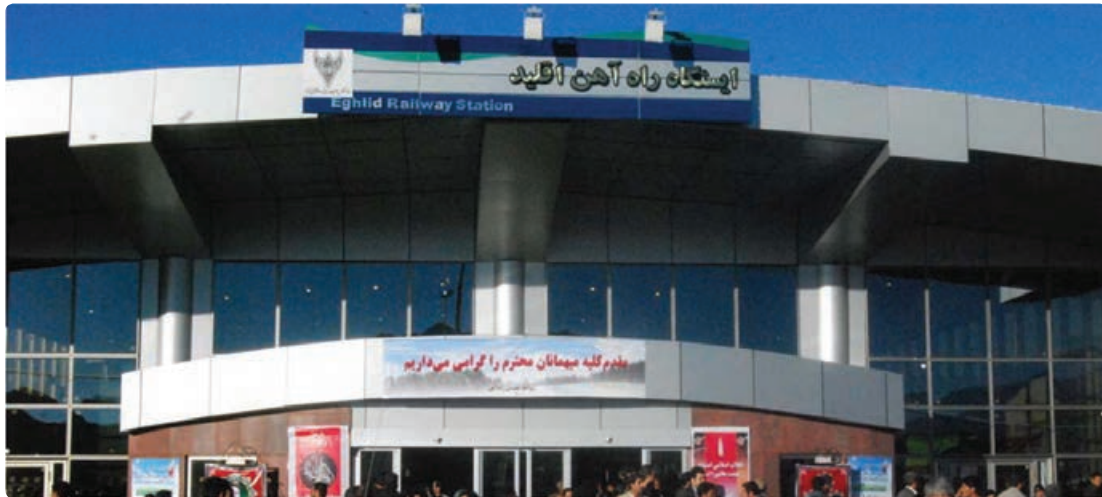
شکل ۲۸-۶- ایستگاه راه آهن اقلید

اگر بخواهیم پرافتخارترین طرح عمرانی استان فارس را در سال‌های اخیر نام ببریم، بی شک راه‌اندازی قطار شیراز - اصفهان است که کلیه مراحل مطالعه - برنامه‌ریزی و اجرای آن در زمان جمهوری اسلامی انجام شده است.