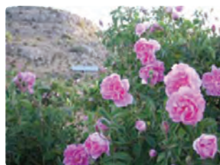
شکل ۱۰-۶- گل محمدی (اول)