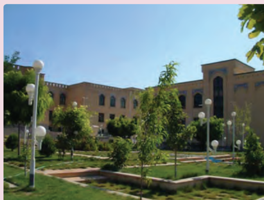
شکل ۳۵-۶ دانشگاه آزاد شیراز

علمی و آموزشی: یکی از ابعاد توسعه همه‌جانبه استان علاوه بر گسترش سوادآموزی، رشد فعالیت علمی و آموزشی در دانشگاه‌ها و توسعه مراکز آموزشی در مقاطع گوناگون تحصیلی در استان فارس بوده است. میزان باسوادی در استان فارس از 49/5 درصد سال 1355 به 87 درصد در سال 1385 افزایش یافته که بیانگر تحول قابل ملاحظه‌ای در سوادآموزی است.