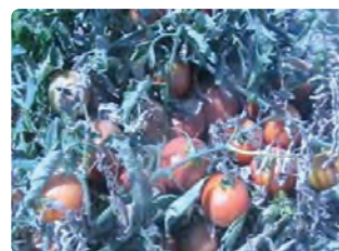
شکل ۹-۶- گوجه‌فرنگی (اول)