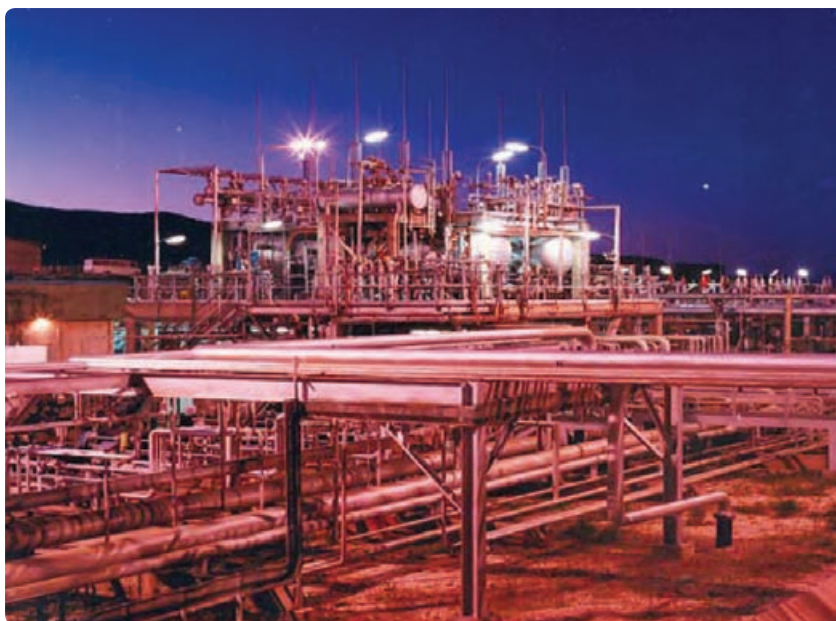
شکل ۱-۶- توسعه صنعتی