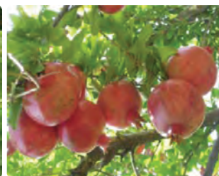
شکل ۴-۶- انار (اول)