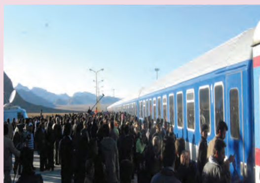
شکل ۴۲-۶- ایستگاه راه آهن