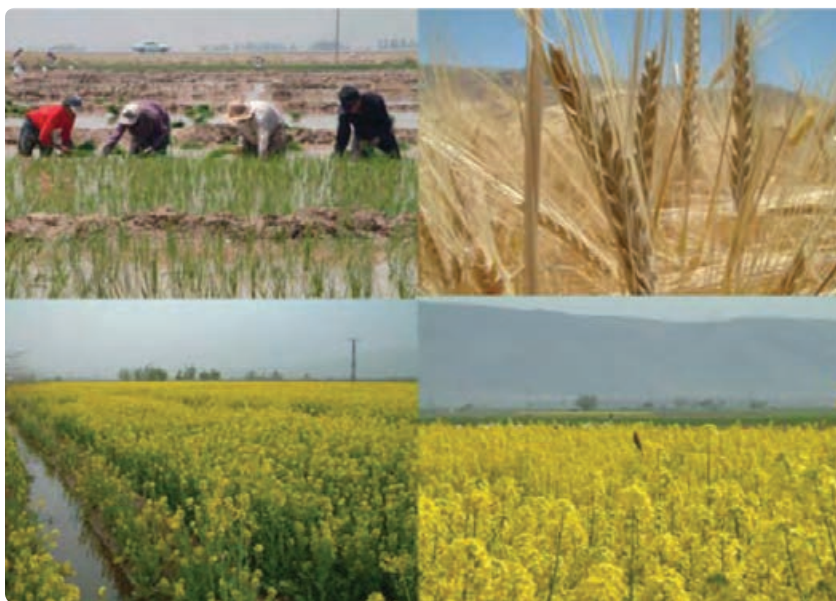
شکل ۲-۶- توسعه کشاورزی