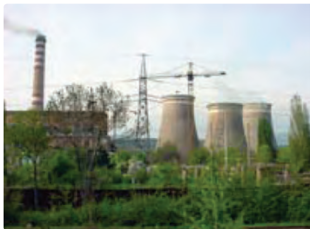
شکل ۳۳- سیکل ترکیبی