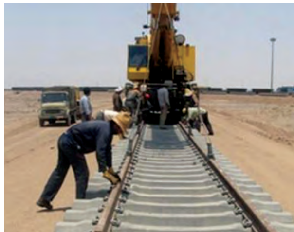
شکل ۱۵-۶- مراحل ساخت راه آهن قزوین - رشت - آستارا