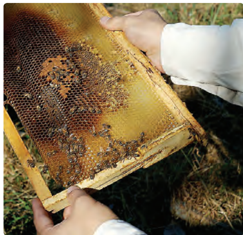
شکل ۱۰-۶- پرورش زنبور عسل

— یکپارچه‌سازی اراضی و مکانیزه کردن کشاورزی: سرانه زمین کشاورزی گیلان ۱/۱۳ هکتار است. وسعت کم زمین‌های کشاورزی و کوچک کردن هریک از قطعه‌ها باعث می‌شود تا سرمایه‌گذاری‌ها و مکانیزه کردن کشاورزی مقرون به صرفه نباشد و بازدهی تولید پایین بیاید.