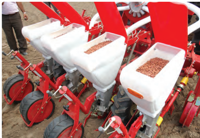
شکل ۹-۶- کاشت مکانیزه بادام زمینی (آستانه اشرفیه)