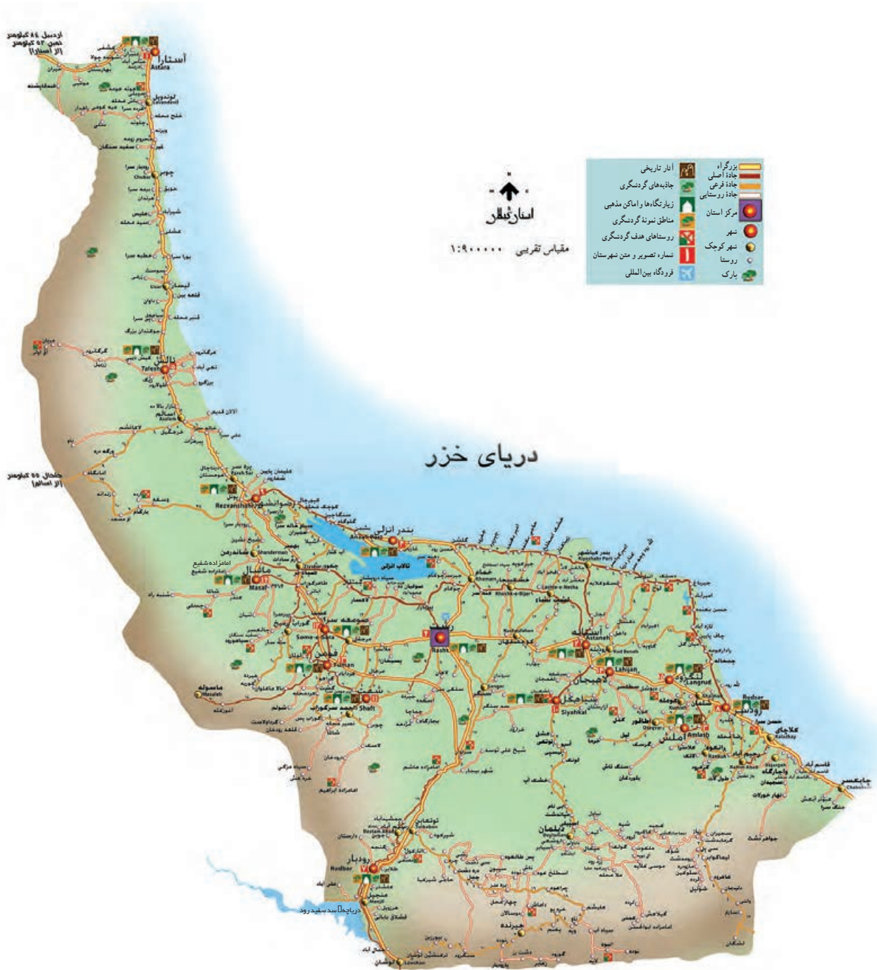
شکل ۱۸-۶ نقشه گردشگری استان