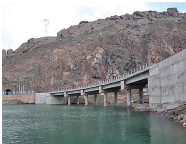
شکل ۱۶-۶- راه آهن قزوین - رشت - آستارا در حال احداث

برای توسعه بازرگانی، رشد صنایع کارخانه‌ای، گردشگری و ... توسعه جاده تهران - قزوین - رشت به آستارا ضروری است. این محور ارتباطی در جابه‌جایی بار و مسافر و ارتباط با کشورهای خارجی و استان اردبیل نقش عمده‌ای دارد.