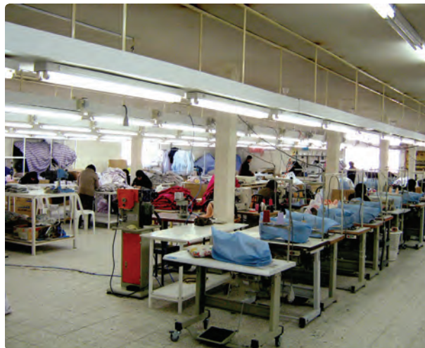
شکل ۱۳-۶- نمونه‌ای از صنایع استان

برای توسعه بازرگانی، رشد صنایع کارخانه‌ای، گردشگری و ... توسعه جاده تهران - قزوین - رشت به آستارا ضروری است. این محور ارتباطی در جابه‌جایی بار و مسافر و ارتباط با کشورهای خارجی و استان اردبیل نقش عمده‌ای دارد.