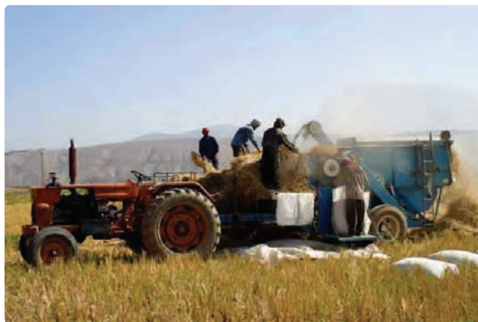
شکل ۱۱-۶- کشاورزی مکانیزه

— توسعه صنایع تبدیلی محصولات کشاورزی : تولید محصولات مختلف کشاورزی مثل زیتون، گیاهان دارویی، چوب، آبریان و ... در استان می‌تواند با توسعه صنایع تبدیلی به افزایش اشتغال، تأمین ارز، تأمین درآمد و سهم آن در افزایش تولید خالص ملی و برآورده کردن نیازهای مصرفی جمعیت کمک کند. — افزایش تولیدات گلخانه‌ای : کشت گلخانه‌ای در استان، زمینه را برای تولید بیش‌تر انواع مختلف محصولات کشاورزی فراهم می‌سازد و علاوه بر سوددهی بالا موجب می‌شود تا از این تولیدات در همه فصول سال استفاده کنیم.