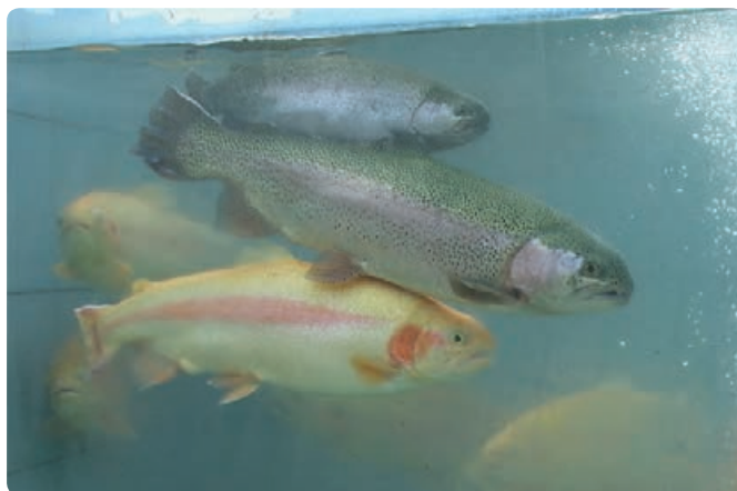
شکل ۲-۶- پرورش ماهی قزل‌آلا

تأمین می‌کند. این استان در بخش مربوط به فعالیت‌های صیادی و آبی‌پروری موقعیت منحصر به فردی دارد که با وجود رودها و آبگیرهای داخلی و دریا، مقدار تولید قابل افزایش است.