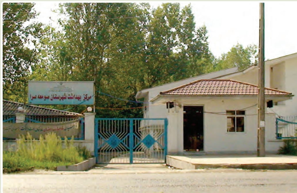
شکل ۸-۶- مرکز بهداشت

۴- حمایت از هویت و فرهنگ اسلامی : تعداد کتابخانه‌های عمومی قبل از انقلاب در استان ۲۵ باب بود که در سال ۱۳۸۶ به ۵۹ باب رسیده است. در این مدت، تعداد اعضا و مراجعان به کتابخانه نیز افزایش محسوسی داشته است. تعداد کل موزه‌های تحت نظارت اداره فرهنگ و هنر قبل و بعد از انقلاب یک باب است. همچنین، در دوران انقلاب اسلامی یک موزه در بندر انزلی و تحت نظارت نیروی دریایی ایجاد شده است. گردشگران خارجی استفاده‌کننده از هتل‌های استان به ۸۰۸۴ نفر در سال ۱۳۸۵ رسیده و در سال‌های اخیر، از نظر تأسیسات گردشگری نیز رشد قابل توجهی صورت گرفته است؛ به گونه‌ای که تعداد اتاق‌های تأسیسات اقامتی از ۱۱۱۳ اتاق در سال ۸۰ به ۱۷۰۳ اتاق در سال ۸۵ رسیده است. قبل از انقلاب اسلامی، تعداد نشریات محلی اعم از هفته‌نامه، ماهنامه، فصل‌نامه و سالنامه تنها ۵ عنوان بود که در سال ۱۳۷۳ به ۱۵ عنوان و در سال ۱۳۸۶ به ۸۷ عنوان رسیده و تعداد تأسیسات و مکان‌های ورزشی نیز از ۲۳ مکان در سال ۱۳۵۷ به ۱۷۴ مکان در سال ۱۳۸۶ رسیده است.