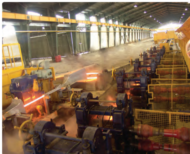
شکل ۱۴-۶- نمونه‌ای از صنایع استان