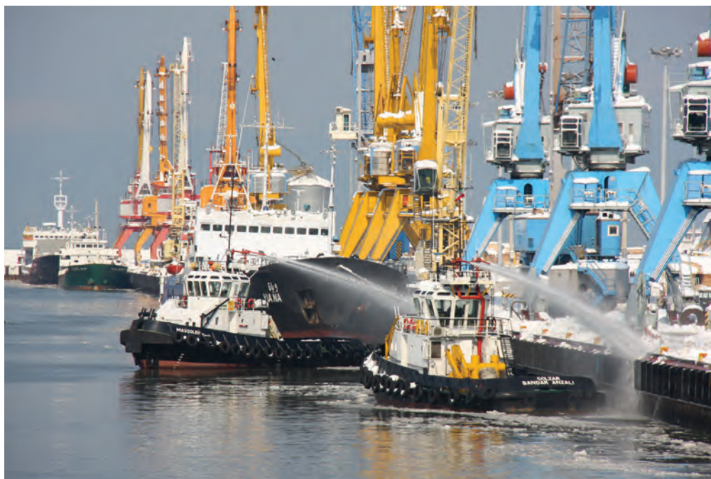
شکل ۶-۷- حمل و نقل دریایی

بعد از سال ۱۳۵۷، ظرفیت بارگیری و تخلیه بار بندر انزلی افزایش یافت و چهار پست اسکله و دو باب انبار سرپوشیده به این تأسیسات اضافه شد. طول موج شکن غربی افزایش یافت و بخشی از کانال به منظور دسترسی به محوطه مورد نیاز احیا شد.