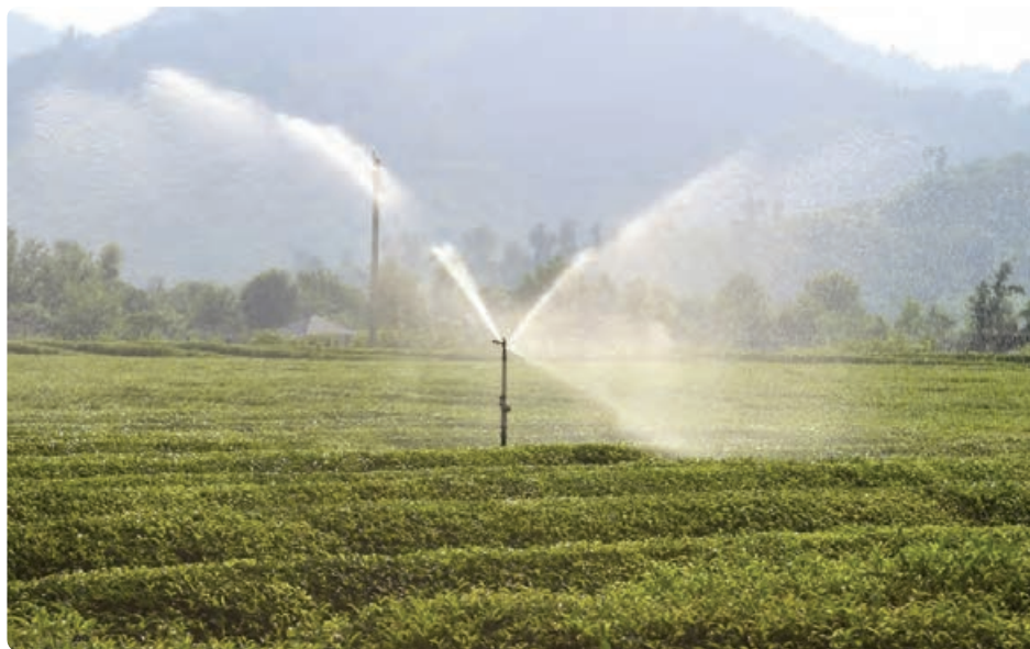
شکل ۱-۶- آبیاری مکانیزه

به دلیل رشد جمعیت و افزایش مصرف مواد غذایی ناشی از آن طی چند دهه گذشته، لازم است جهت افزایش محصولات کشاورزی مخصوصاً در استان‌هایی مانند گیلان برنامه‌ریزی‌هایی انجام شود.