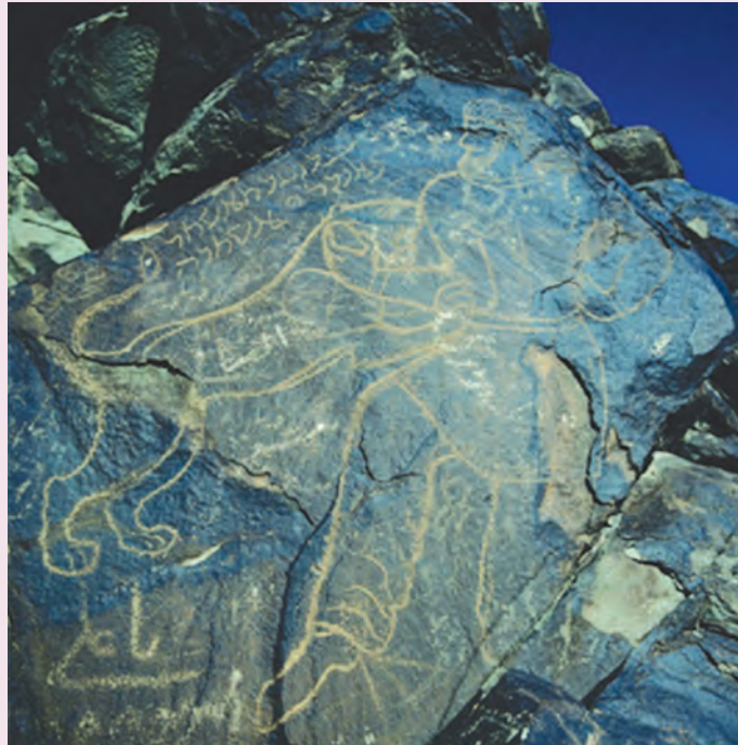
شکل ۲-۱۰- سنگ نگاره کال جنگال در جنوب غرب بیرجند

● استان ما در دوره ساسانی: استان ما یکی از ایالت‌های آباد و با اهمیت امپراطوری قدرتمند ایران در دوره ساسانی به حساب می‌آمد که از ۲۲۶ میلادی آغاز شده بود. در دوره ساسانی این ایالت از حیث نیروی انسانی اهمیت خاصی داشته؛ زیرا از مردمانی سلحشور، رزمجو و با استعداد برخوردار بوده است؛ به طوری که شاهان ساسانی به نیروی بازو و شهامت و همکاری آنها با دولت اطمینان خاطر داشتند.