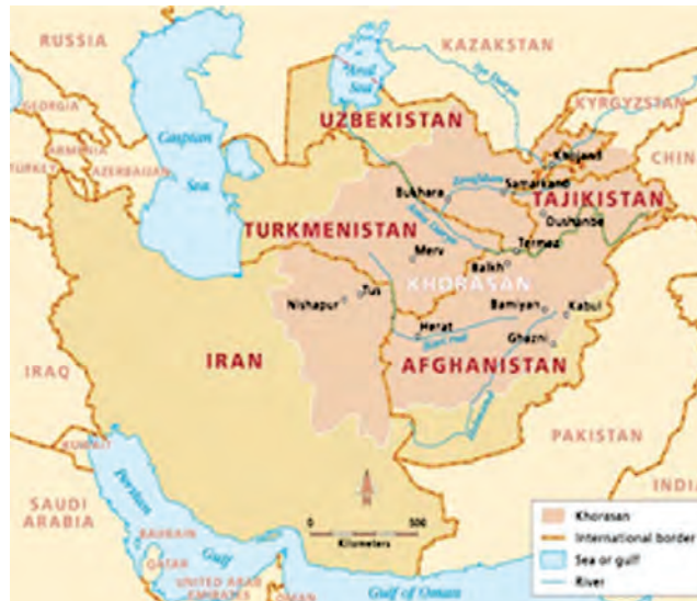
شکل ۱-۱۰- نقشه تاریخی خراسان بزرگ

* آیا می دانید که استان خراسان جنوبی بخشی از سرزمین ساتراپ چهاردهم در دوره هخامنشیان است؟ شما در این درس با پیشینه تاریخی استان خودتان آشنا می شوید.