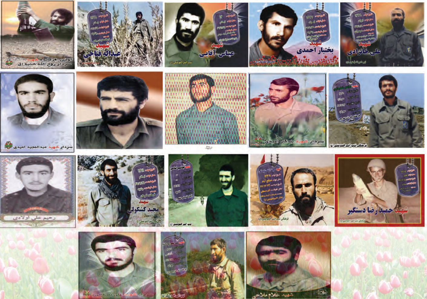
شکل ۱-۴- بعضی از فرماندهان شهید استان