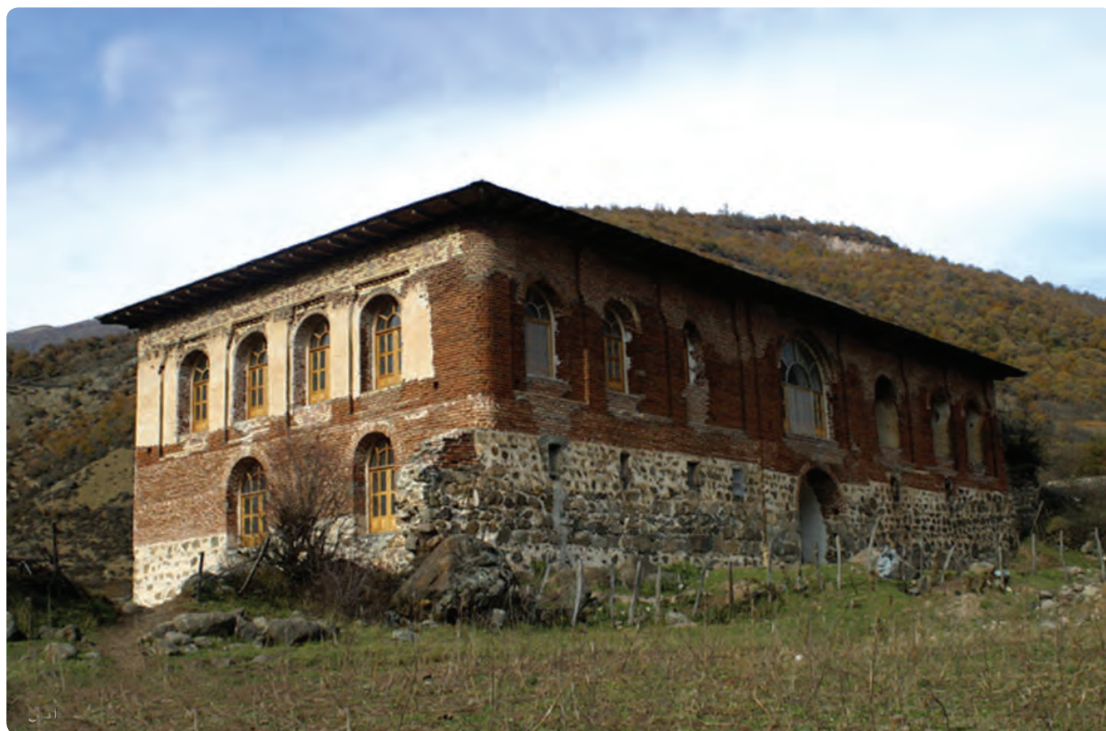
شکل ۸-۵- کاخ آق اولر تالش (یکی از قصرهای سردار امجد در تالش)