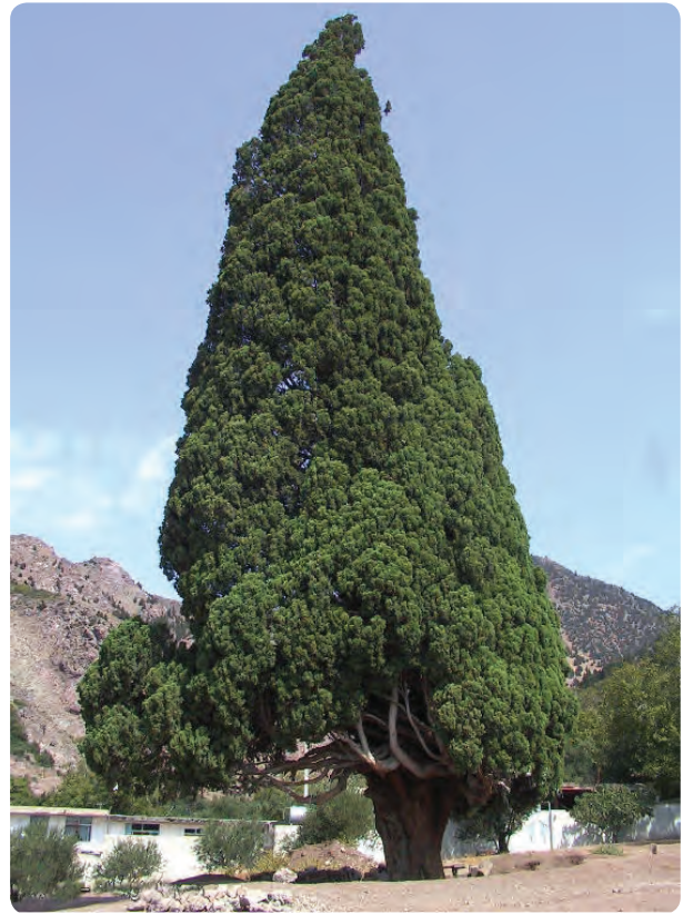
شکل ۱۴-۵-الف- سرو هزارساله هرزویل در رودبار