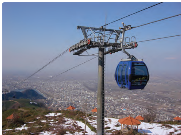
شکل ۱۰-۵- گردشگری در لاهیجان