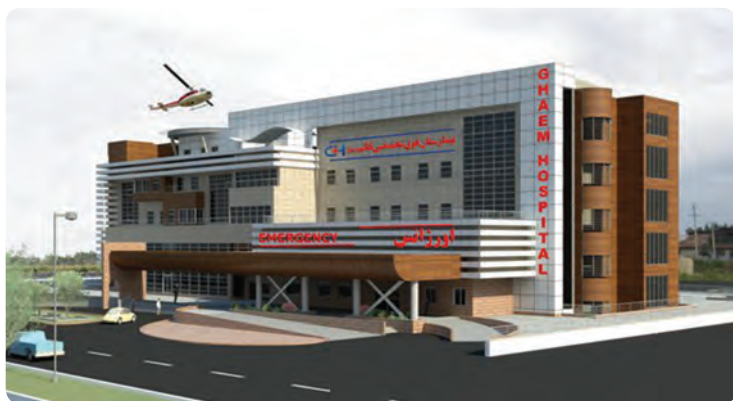
شکل ۱۹-۵- بیمارستان فوق تخصصی بین‌المللی قائم

در قدم اول، تبدیل جاده‌های معمولی به آزادراه یا اتوبان، نقش به‌سزایی در افزایش حجم آمد و شد عبوری، بالا رفتن امنیت مسافران، تقلیل زمان و کاهش تصادفات جاده‌ای دارد و در صورت تحقق اتصال استان به خط راه آهن سراسری، گردشگران زیادی به این استان مسافرت خواهند کرد.