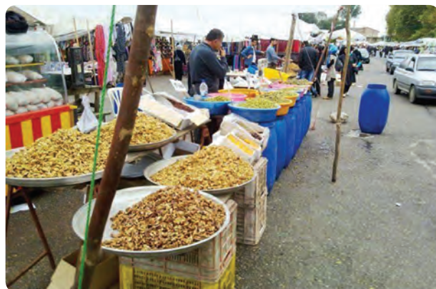
ج- نمایی از بازار هفتگی