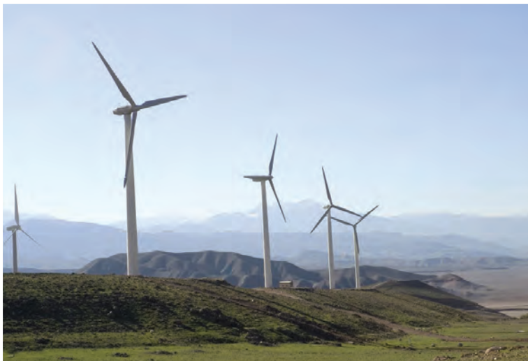
شکل ۲۷-۵- نیروگاه برق بادی منجیل