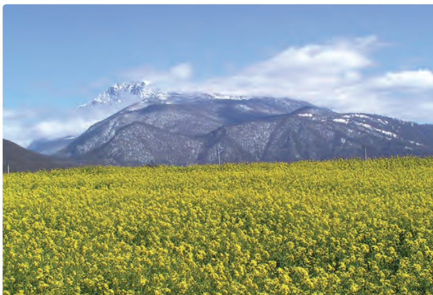
شکل ۲۱-۵- کشت دانه‌های کلزا - تهیه روغن نباتی

زمین‌های کوهستانی هم عمدتاً محل کشت غلات (گندم و جو)، گیاهان علوفه‌ای و برخی گیاهان دارویی است.