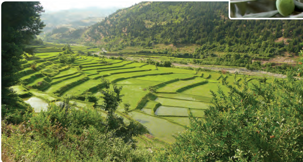
شکل ۲۰-۵-ب - تراس بندی زمین برای کشت برنج در نواحی کوهپایه ای