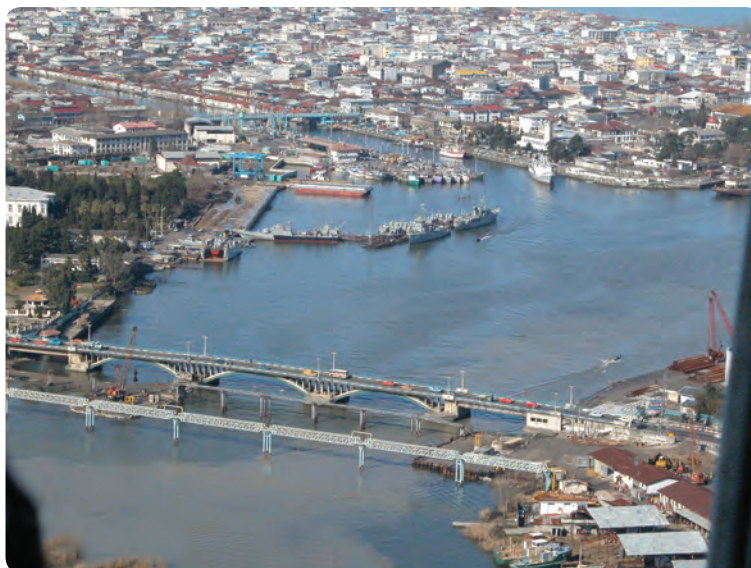
شکل ۲۸-۵- شهر گردشگری بندر انزلی

مواهب طبیعی و موقعیت ممتاز جغرافیایی باعث شده است تا گردشگران زیادی از نواحی مختلف کشور به استان گیلان سفر کنند. همچنین، استان ما از طریق آستارا با کشور جمهوری آذربایجان مرز خشکی دارد و به علت فعال بودن این گمرک، شمار گردشگران خارجی در این شهر زیاد است. در صورت توسعه گمرک آستارا و بندر انزلی، علاوه بر حمل کالا به کشورهای حوزه دریای خزر، زمینه مساعدی هم برای جذب بیشتر گردشگران خارجی فراهم خواهد شد که در ایجاد اشتغال در بخش خدمات تأثیر دارد. در بخش بازرگانی وجود دریای خزر، بندر انزلی و آستارا موجب می‌شود تا مبادلات بازرگانی با آسیای میانه و حتی اروپای شرقی گسترش یابد. وجود سوابق طولانی تجارت و مبادلات بازرگانی میان استان گیلان و جمهوری‌های تازه استقلال یافته از طریق بندر انزلی و آستارا، و نزدیکی استان با تهران، علاوه بر بالا بردن توانمندی بازرگانی استان، در افزایش ارتباطات فرهنگی بین کشورهای منطقه نیز مؤثر است.