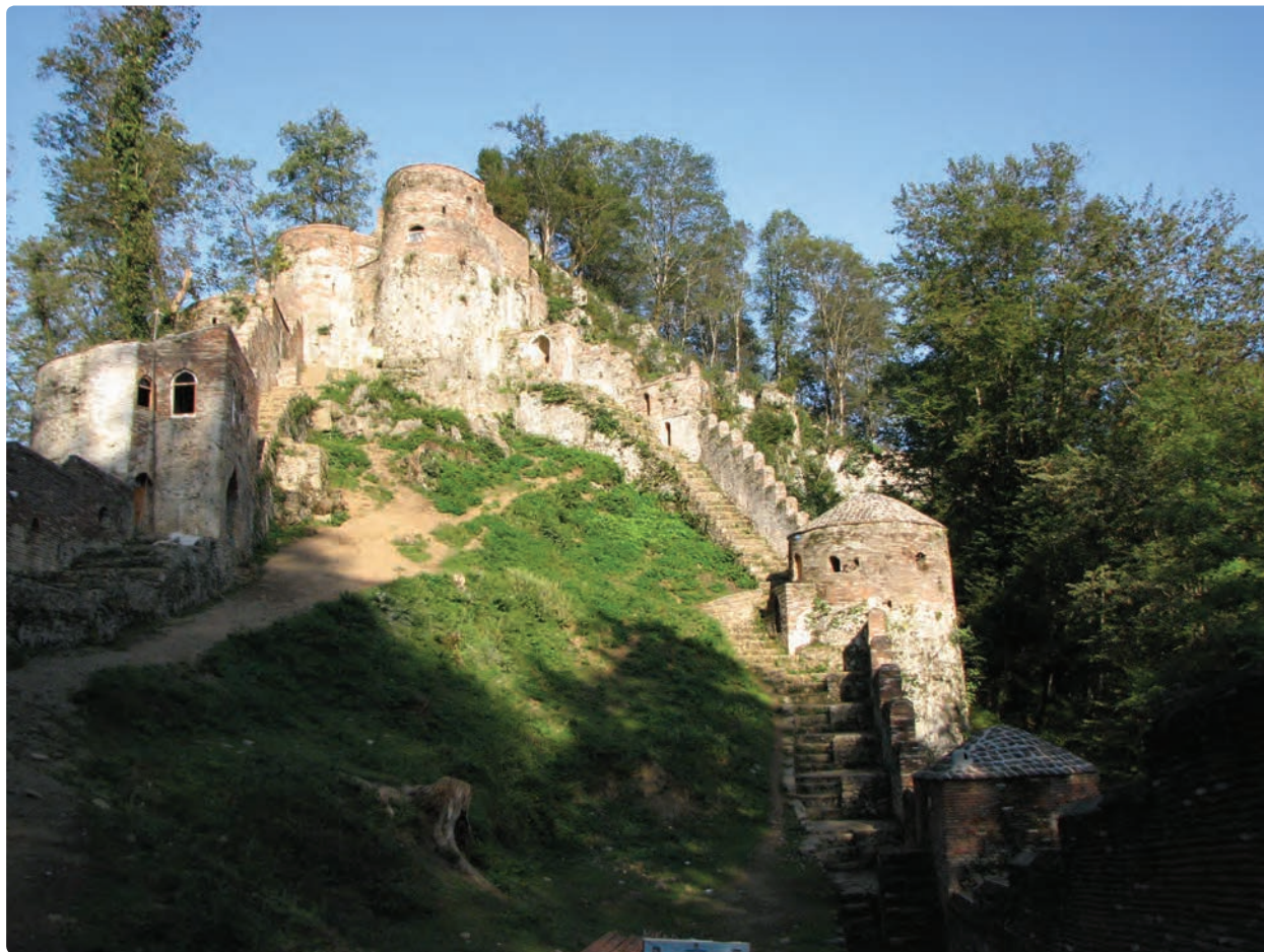
شکل ۱۳-۵- قلعه رودخان در جنوب فومن