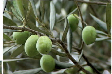
شکل ۲۰-۵-الف - محصول زیتون

مهم ترین کانون فعالیت های کشاورزی استان، مناطق پست جلگه ای است. زمین های کوهپایه ای به پوشش جنگلی و در برخی مناطق محصولات باغی اختصاص دارد کشت برخی از محصولات خاص زمین های جلگه ای مانند برنج در امتداد درّه ها بر روی تراس های رودخانه ای تا جایی که وسعت زمین و شرایط رویش اجازه دهد، در نواحی کوهپایه ای نیز معمول است. درّه سفیدرود از رستم آباد تا حوالی منجیل و لوشان به کشت زیتون اختصاص دارد.