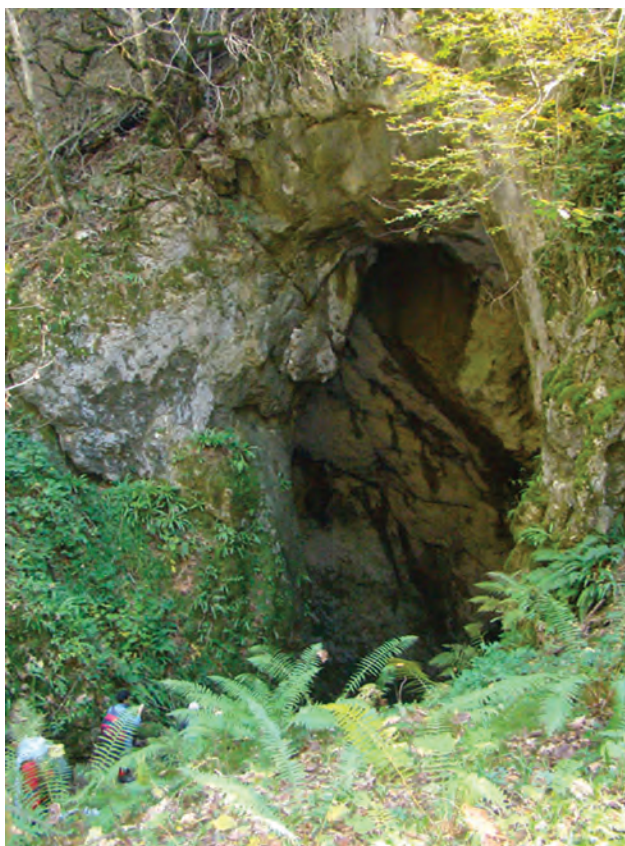
شکل ۷-۵- غار آویشو - شاندرمن

۲- جاذبه‌های تاریخی و یادمانی: قدیمی‌ترین بناهای تاریخی و یادمانی گیلان در کوهپایه‌ها و مناطق کوهستانی است و آثار مربوط به پیش از ورود آریایی‌ها مثل تپه‌های مارلیک در حوالی روستای نصفی رحمت‌آباد رودبار و مسکن ماقبل تاریخ مریان در روستای مریان کرگانرود تالش از نظر تاریخی اهمیت ویژه‌ای دارند.