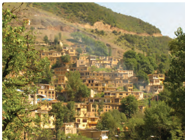
شکل ۹-۵- شهر تاریخی ماسوله