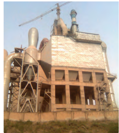
شکل ۲۶-۵- کارخانه سیمان لوشان

در توسعه بخش صنعت استان، اصلی‌ترین قابلیت‌های توسعه عبارت‌اند از: - بالابودن سطح سواد، آگاهی و فرهنگ عمومی، و وجود نیروهای تحصیل کرده و دارای تخصص بالا - وجود مواد معدنی و مواد اولیه مورد نیاز برخی از صنایع در محل - برخورداری از امکانات متنوع تولید و توانایی به کارگیری انرژی‌های نوین تجدیدپذیر برای تأمین برق.