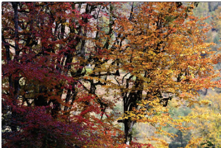
شکل ۵-۶- پاییز جنگل‌های ماسال

از جاذبه‌های طبیعی شهرستان محلّ زندگی خود گزارشی تهیه و در کلاس ارائه دهید.