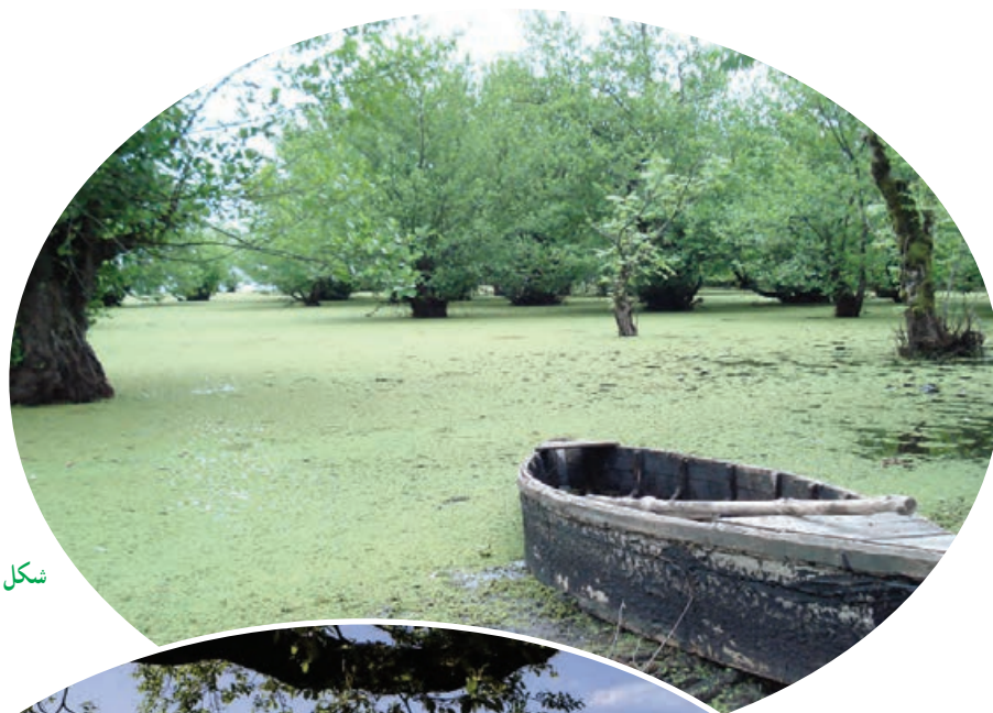
شکل ۲-۵- تالاب استیل آستارا