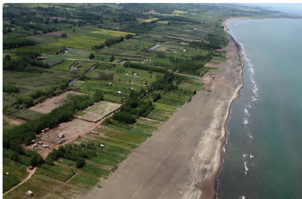
شکل ۱-۵- الف - سواحل زیبای گیلان