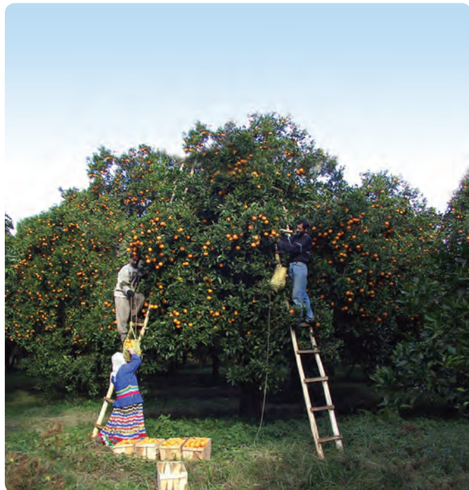
شکل ۲۳-۵- برداشت مرکبات

استان گیلان با برخورداری از امکانات و استعدادهای متنوع آبرزی پروری به جهت دارا بودن مزارع پرورش ماهیان گرم آبی، سردآبی و ماهیان خاویاری، آب بندان‌ها، چاه‌های آب و مزارع شالیزاری، یکی از قطب‌های مهم پرورش آبزیان کشور است که در صورت فراهم شدن بستر مناسب‌تر، این فعالیت می‌تواند نقش به‌سزایی در توسعه پایدار و همه‌جانبه استان ایفا کند. گفتنی است گیلان اولین استان در کشور است که در زمینه پرورش ماهیان خاویاری شروع به کار کرد و گونه منحصراً به فرد فیل ماهی را پرورش داد و سبب شد ایران دومین کشور در زمینه تکثیر این ماهی در جهان باشد.