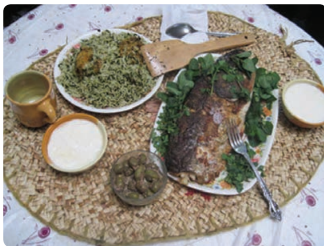
شکل ۱۶-۵- سفره سنتی گیلان