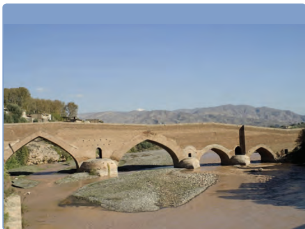
شکل ۱۲-۵- پل تاریخی لوشان (تنها پل ارتباطی به قسمت‌های داخلی کشور)