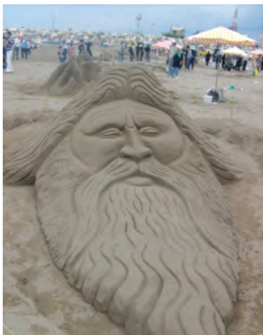
شکل ۱-۵- ج - جشنواره مجسمه‌های شنی در سواحل گیلان

استان گیلان یکی از مراکز مهم گردشگری در ایران است. این استان دارای امتیازهای قابل توجهی برای جذب گردشگر است که به چند مورد آن اشاره می‌شود. از جمله: آب و هوای مناسب، تنوع ناهمواری و پوشش گیاهی، تنوع چشم‌اندازهای انسانی و موقعیت نسبی مناسب برای جذب گردشگران داخلی و خارجی.