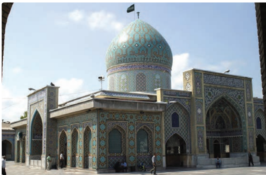
شکل ۱۵-۵- مرقد سید جلال‌الدین اشرف