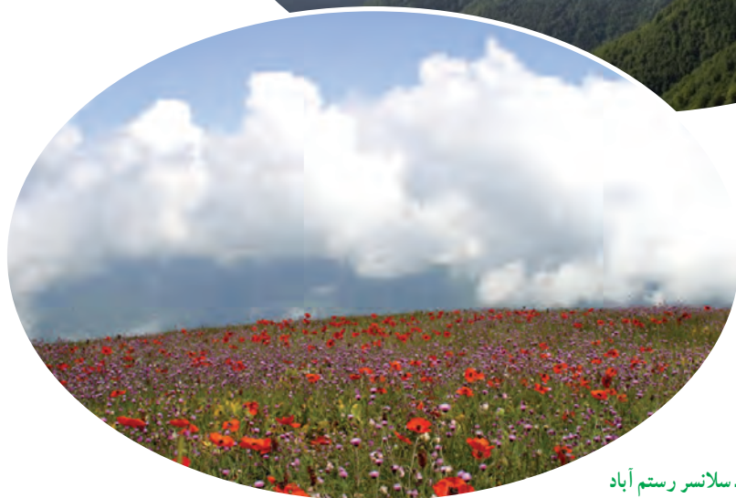
شکل ۴-۵- سانسر رستم آباد