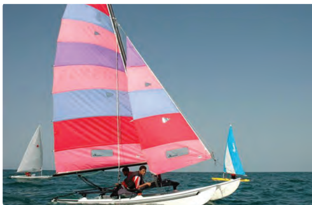
شکل ۱-۵- ب - قایقرانی