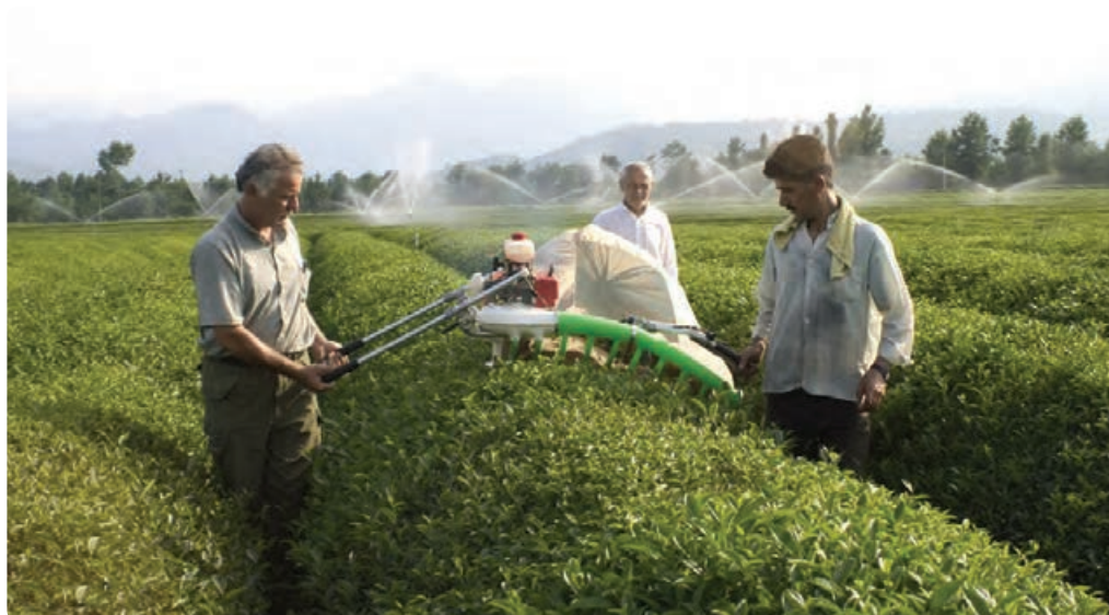
شکل ۲۵-۵- کشاورزی مدرن (مکانیزه)