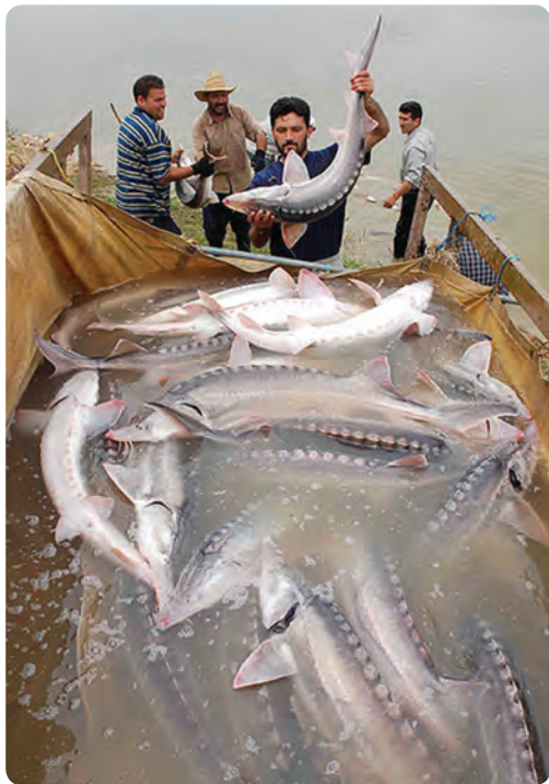
شکل ۲۴-۵- رهاسازی ماهیان خاویاری