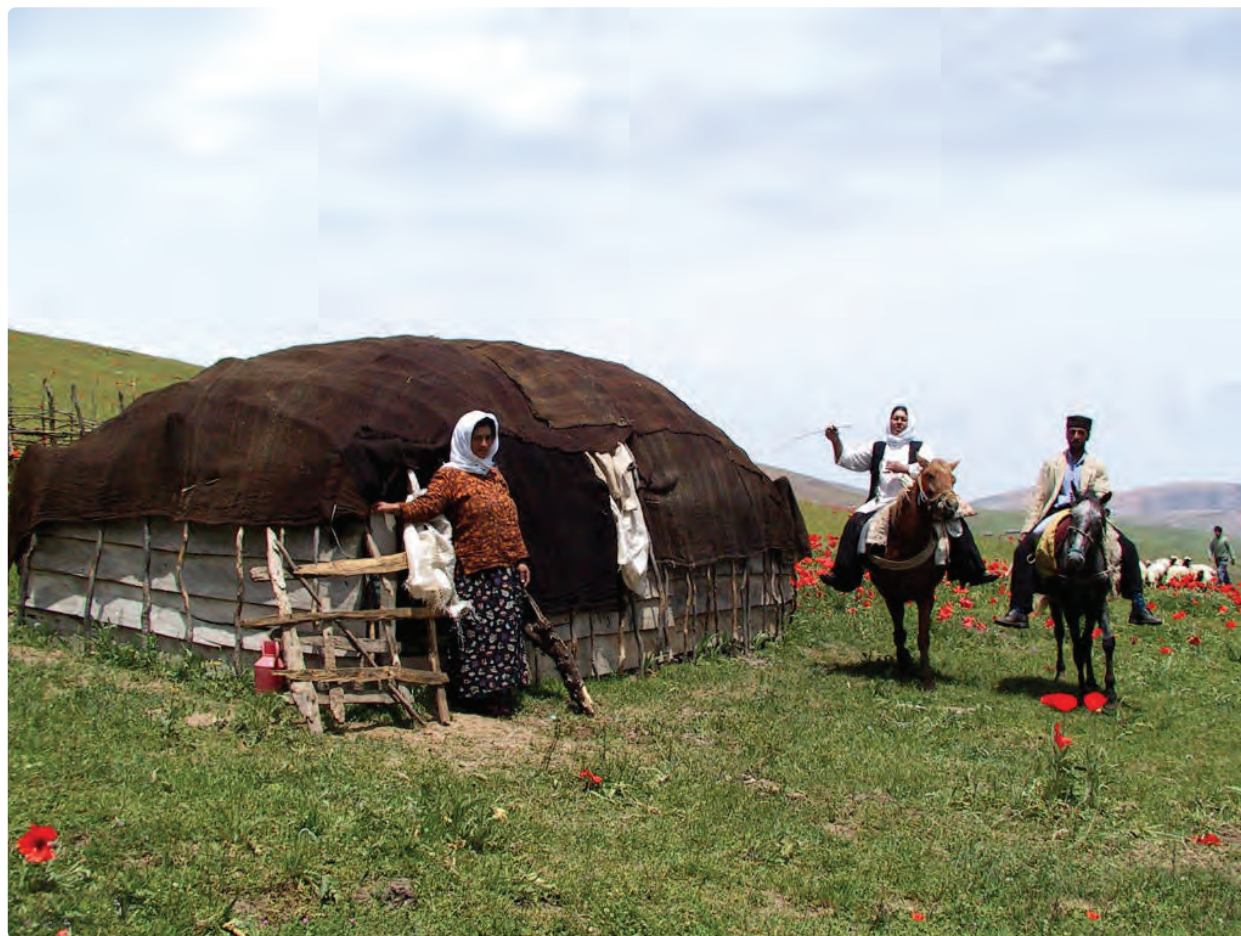
شکل ۱۷-۵- دامداران گیلانی در شکردهشت