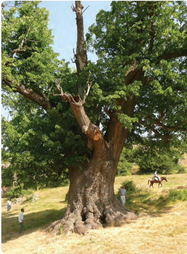
شکل ۱۴-۵-ب- درختی کهنسال و غول پیکر در ارتفاعات رودبار