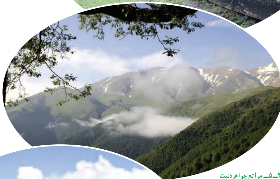
شکل ۳-۵- مراتع جواهردهشت