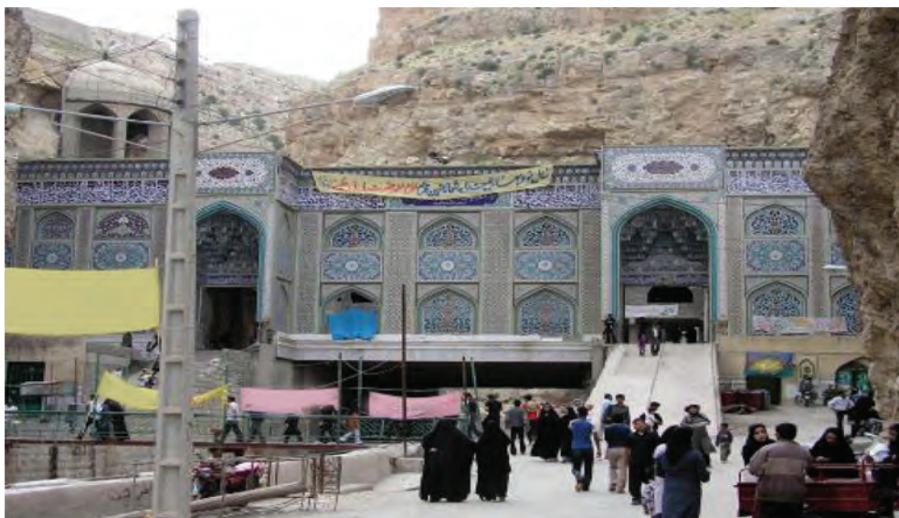
شکل ۱-۵- امامزاده بی بی حکیمه خاتون (س)