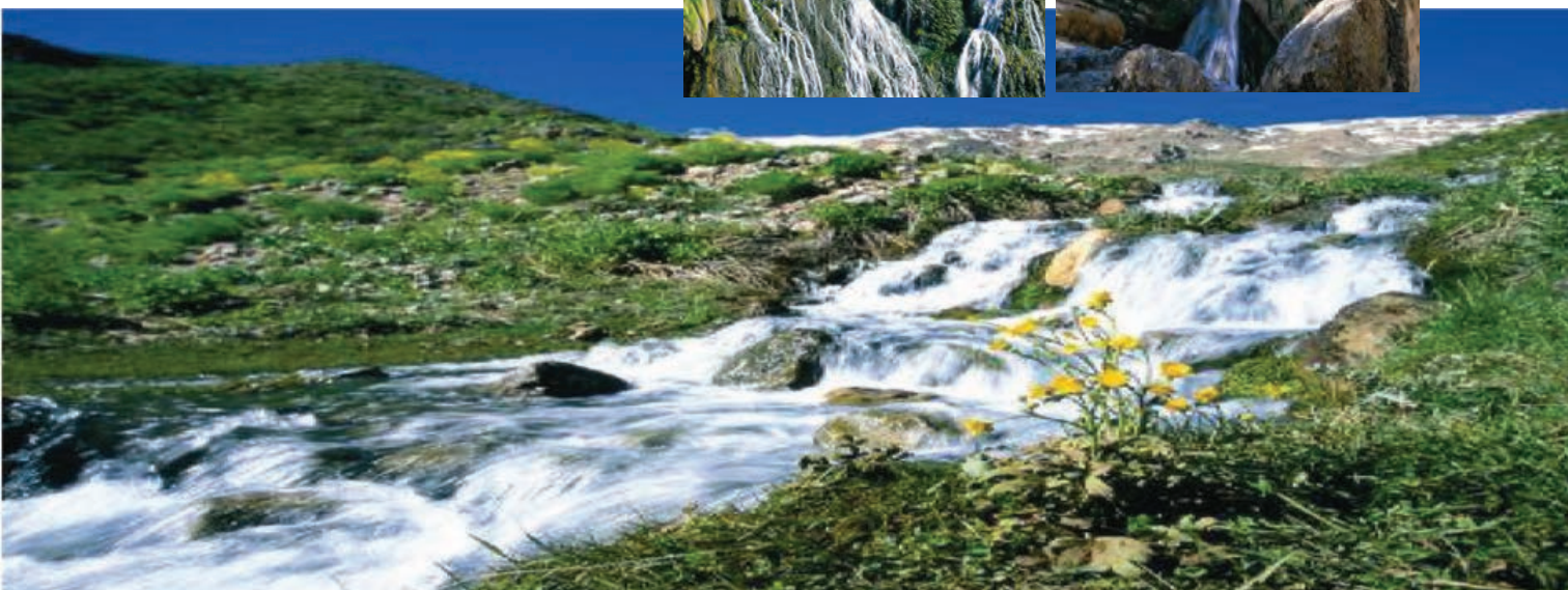
شکل ۹-۵- چشم‌اندازی از آبشارهای استان