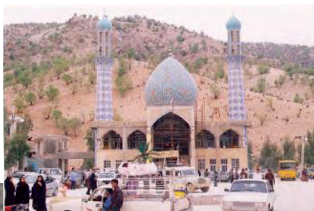
شکل ۲-۵- امامزاده سید محمد