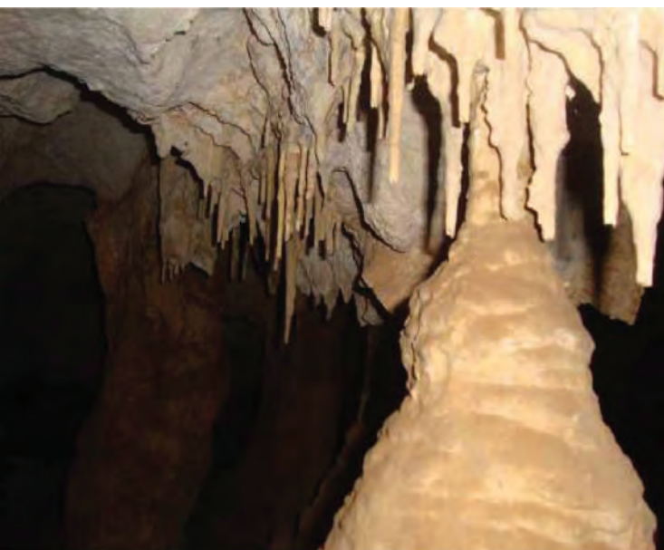
شکل ۸-۵- غار، روستای ده شیخ در بخش پاتاوه

۳- آبشارها: آبشارهای معروف استان عبارت‌اند از: آبشار یاسوج، آب نهر کاکان، آبشار شهنیز، آبشار تنگ تامرادی و آبشار بهرام بیگی در شهرستان بویراحمد، آبشار کمر دوغ و آبشار خیمه و کوه دیوک در کهگیلویه و آبشار مفید، آبشار منج و آبشار کوه گل، آبشار آب سیا (چاگل) در شهرستان دنا، آبشار طسوج در چرام، آبشار شادگان در شهرستان باشت، آبشار رودبال، آبشار هرجون و آبشار کیوان لیشتر در شهرستان گچساران.