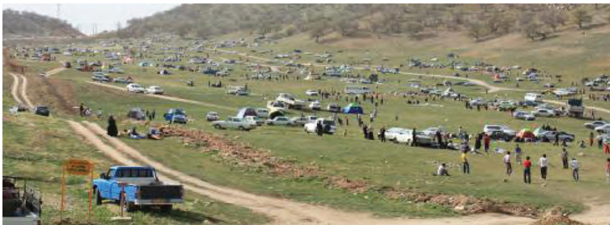
شکل ۱۱-۵ - سرنجل کل یاسوج