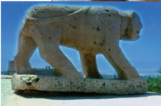
شکل ۷-۵- شیر سنگی