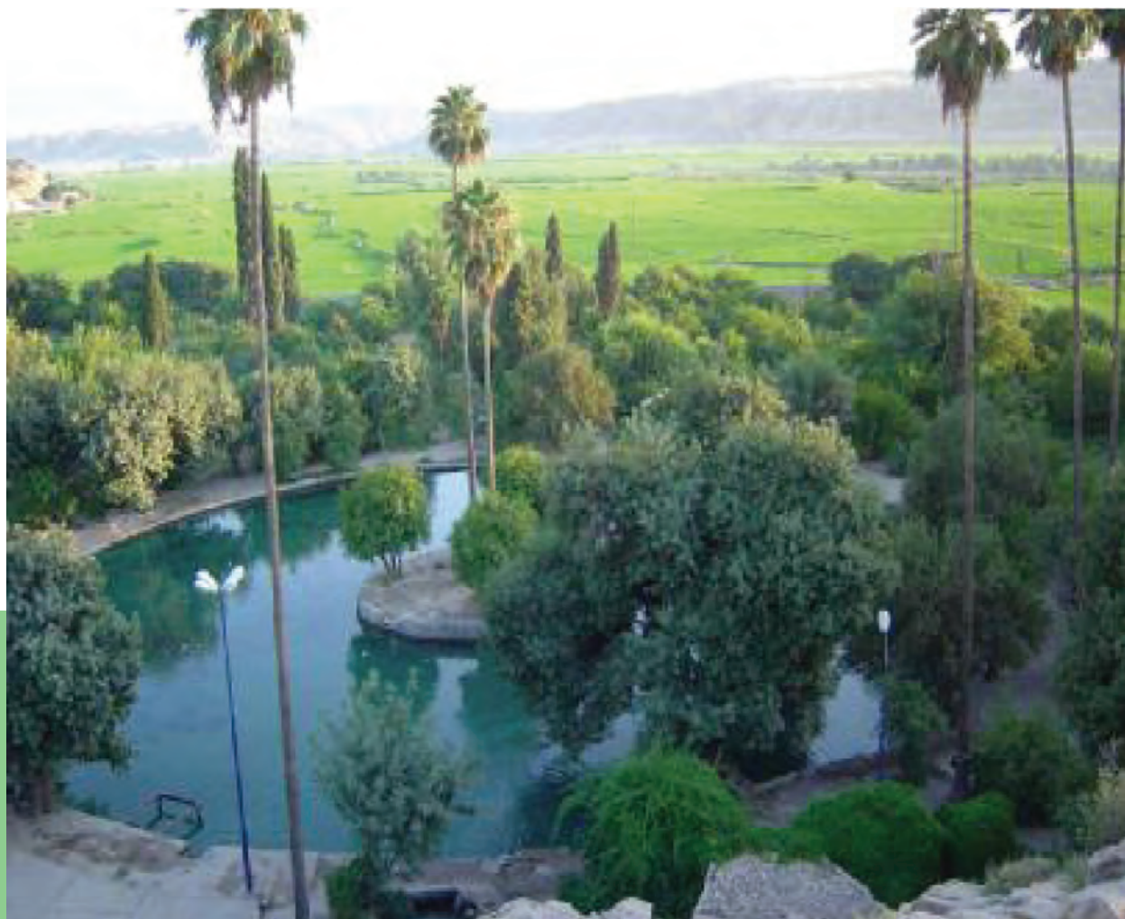
شکل ۱۴-۵ - چشمه بلیس جرام