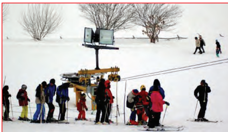
شکل ۱۲-۵ - پیست اسکی کاکان