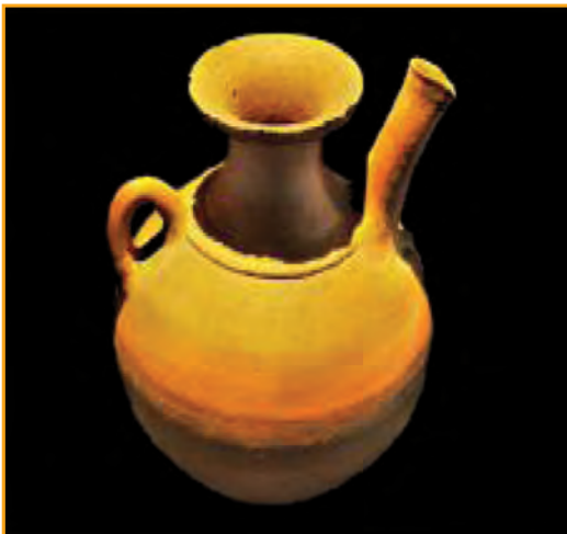
شکل ۵- ۵ - گنجینه یاسوج، ظرف سفالی - پیش از میلاد

تنها موزه استان، موزه (گنجینه) میراث فرهنگی در شهر یاسوج است. این موزه از یک بخش باستان شناسی تشکیل شده که در آن حدود ۲۷۰ شیء تاریخی فرهنگی از دوره های مختلف به نمایش گذاشته شده است. این اشیاء عمدتاً در کاوش های باستان شناسی به دست آمده اند.