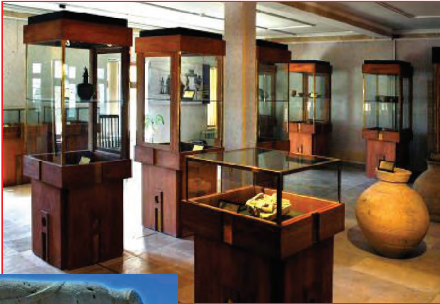
شکل ۶-۵- گنجینه یاسوج