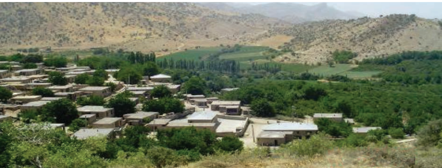
شکل ۱۳-۵ - روستاهای هدف گردشگری