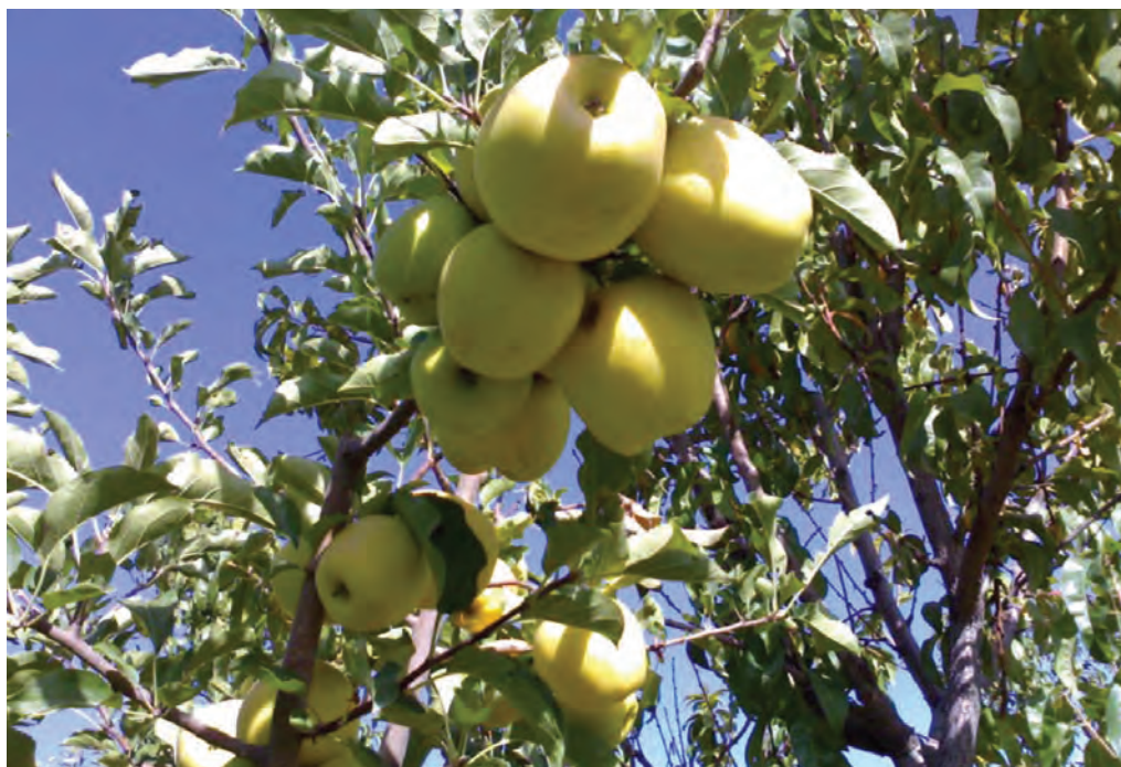
شکل ۲۱-۵- باغ سیب در شهرستان دماوند

۲- دشت‌ها و کوهپایه‌های جنوبی البرز؛ شامل ورامین، ری، شهریار و رباط کریم است. این بخش برای کشاورزی مساعد است؛ زیرا از منابع آب‌های سطحی و زیرزمینی برخوردار است اما زمین‌هایی که در نزدیکی شوره‌زارها واقع شده‌اند، برای کار کشاورزی مناسب نیستند.