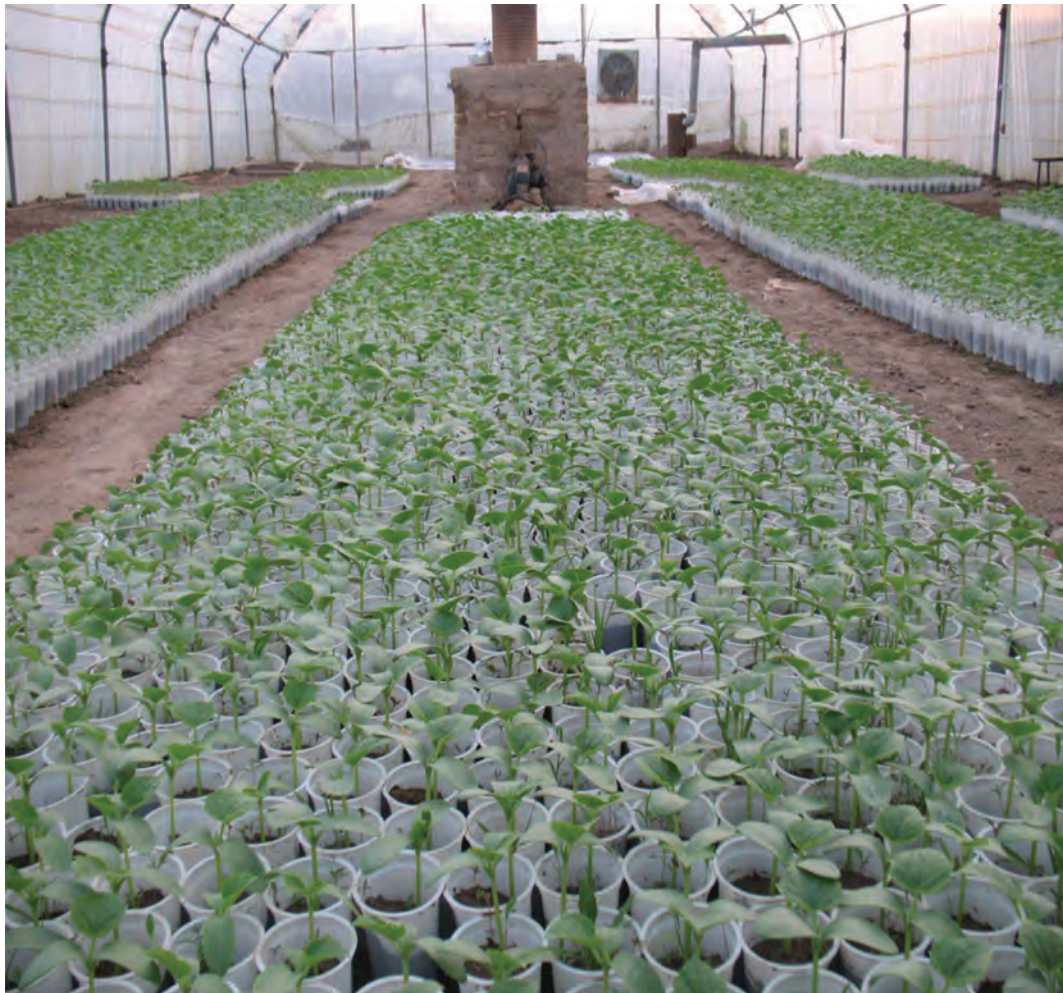
شکل ۲۳-۵- کشت گلخانه‌ای

محصولات عمده این بخش را گندم، جو، یونجه، ذرت علوفه‌ای، گوجه فرنگی، خیار، سبزی‌ها، سیب زمینی، نباتات علوفه‌ای، انگور، چغندر قند و پنبه تشکیل می‌دهد. از نواحی مهم آن می‌توان به دشت شهریار و ورامین اشاره کرد.