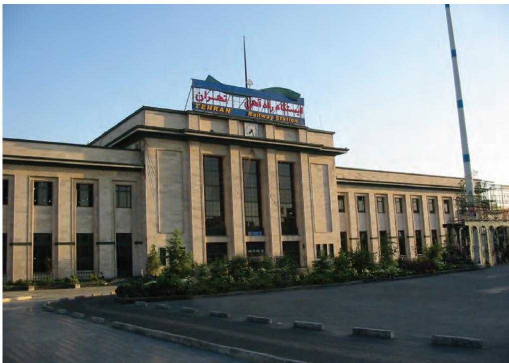
شکل ۲-۶- ایستگاه راه آهن تهران

آغاز به کار متروی تهران در سال ۱۳۷۸ نقطه عطفی در توسعه شبکه ریلی استان محسوب می‌شود که روزانه هزاران مسافر را جابه‌جا می‌کند.