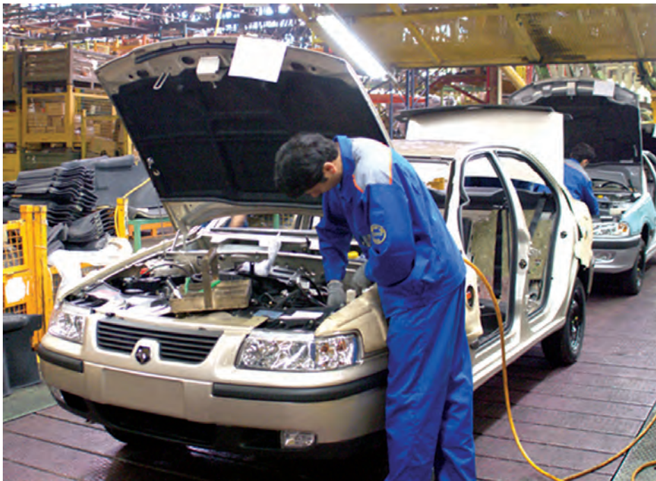
شکل ۲۶-۵- تولید اتومبیل در کارخانه ایران خودرو