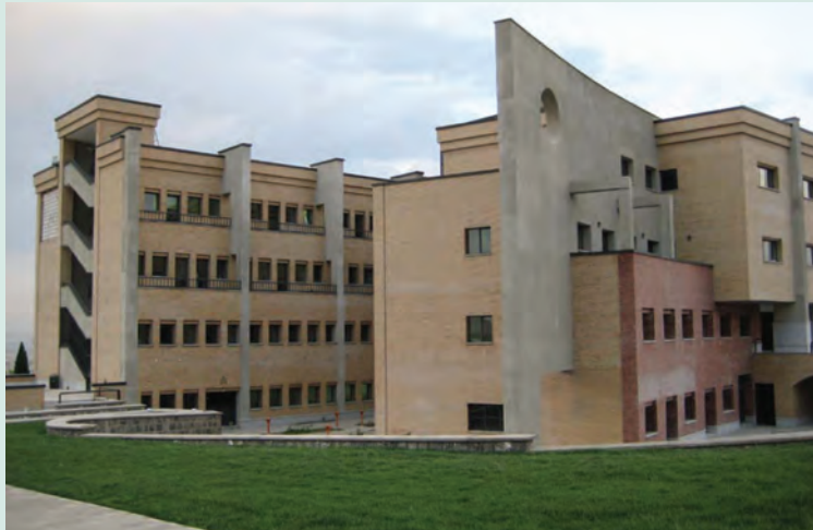
شکل ۶-۷- دانشگاه آزاد اسلامی واحد تهران

اماکن مذهبی در استان تهران براساس آمار سال ۱۳۸۶، به تعداد ۳۹۹ مکان متبرکه بوده است. در این استان، ۳۵۶۵ مسجد و ۶۰۱ حسینیه برای انجام فرایض دینی و مذهبی وجود دارد. همچنین، تعداد ۱۹ مکان مذهبی مربوط به اقلیت‌های مذهبی در شهر تهران وجود دارد.