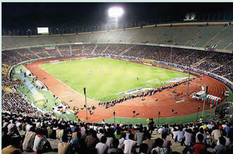
شکل ۶-۸- استادیوم آزادی تهران

استان تهران طی سی سال گذشته به خصوص از دهه ۱۳۷۰، شاهد رونق فعالیت‌های ورزشی بوده است. تعداد فضاهای ورزشی روباز و سرپوشیده استان از ۲۷۶ مورد در سال ۱۳۶۸ به ۲۷۶۸ مورد در سال ۱۳۸۷ رسیده است، اما به علت افزایش جمعیت، رشد سرانه فضای ورزشی برای هر نفر ۲۳٪ در سال ۱۳۸۷ بوده است.