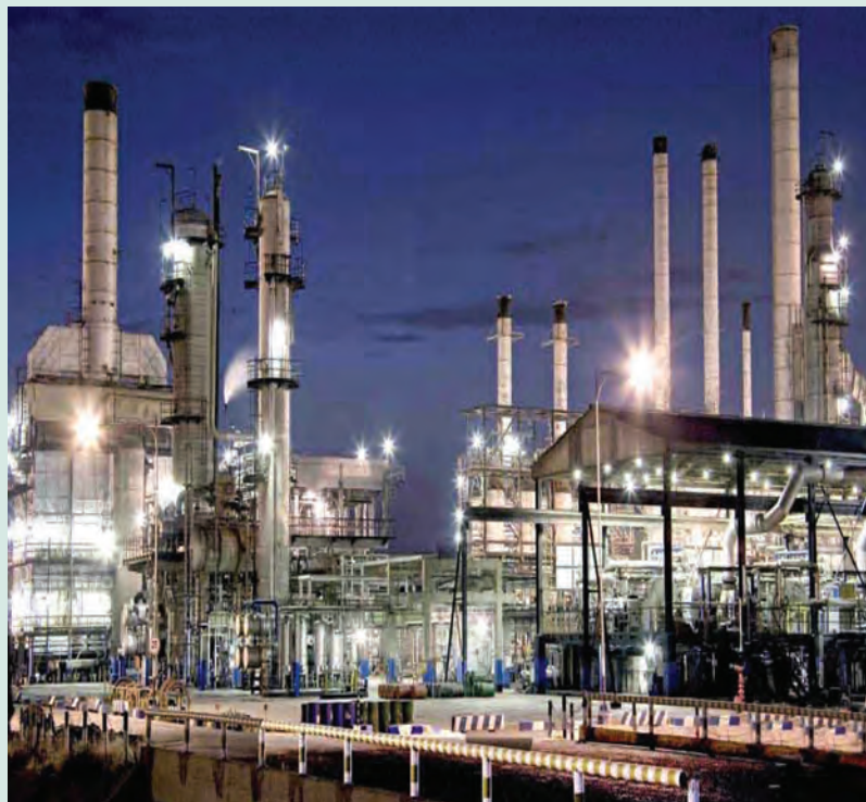
شکل ۵-۶- نیروگاه برق در تهران

صد و سیما: ارتباطات رسانه‌ای و وسایل ارتباط جمعی به‌عنوان یکی از ابزارهای نیرومند در جهت فرهنگ‌سازی، نقش مؤثری را در توسعه اجتماعی، اقتصادی و فرهنگی جامعه به‌عهده دارد. براساس آمار و اطلاعات موجود در طی سال‌های ۱۳۷۵ تا ۱۳۸۵، تعداد ایستگاه‌های رادیویی موج متوسط، تلویزیون و اف. ام از ۱۵۴ ایستگاه به ۳۵۵ ایستگاه (۲/۳ برابر) و هم‌چنین، تعداد مجموع فرستنده‌های اصلی از ۲۷۷ به ۱۰۱۵ فرستنده افزایش یافته است.