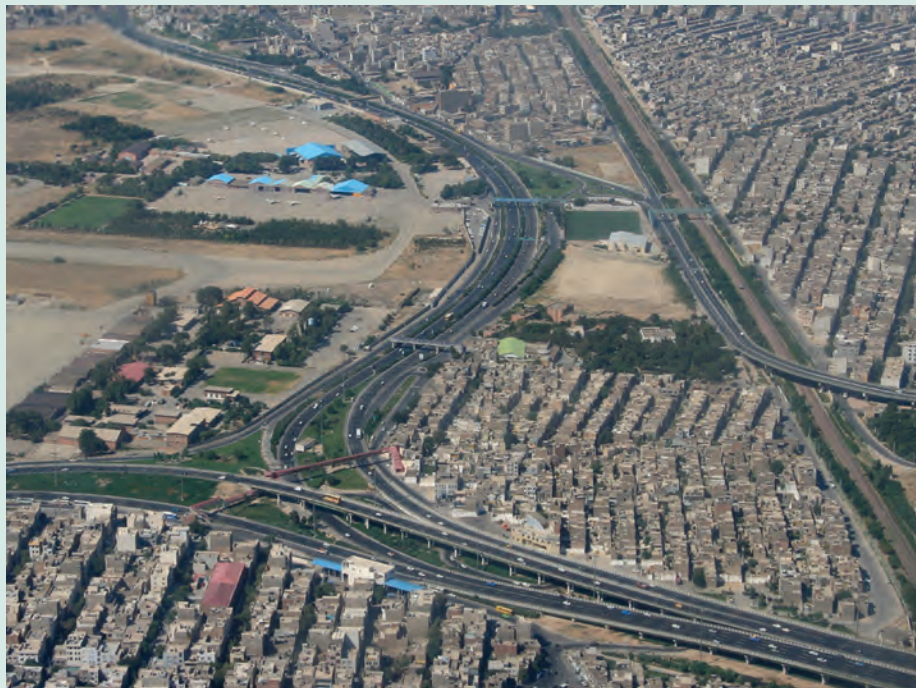
شکل ۱-۶- راه‌های ارتباطی شهر تهران

راه‌های ارتباطی یکی از عوامل توسعه صنعتی در استان تهران محسوب می‌شود. بعد از انقلاب اسلامی، توجه زیادی به احداث راه‌های استان صورت گرفته است؛ به طوری که در سال ۱۳۶۰ طول شبکه راه‌های استان (آزادراه، بزرگراه، راه‌های اصلی و فرعی و راه‌های روستایی) معادل ۲۴۱۷ کیلومتر بوده در حالی که تا پایان سال ۱۳۸۷ به ۴۹۸۳ کیلومتر رسیده است که نشان دهنده رشد بسیار بالای آن است.