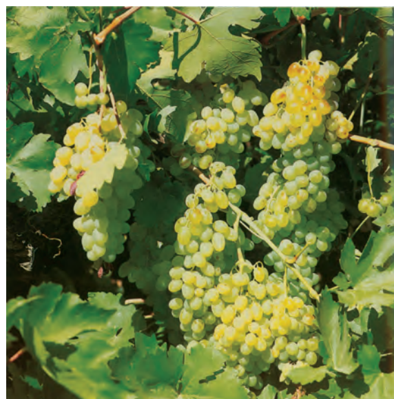
شکل ۶-۶- محصولات کشاورزی استان

دامداری: تولید محصولات دامی استان طی سال‌های ۱۳۵۸ تا ۱۳۸۷ از بیست و یک هزار تن به یک میلیون و دویست هزار تن بالغ گردید.