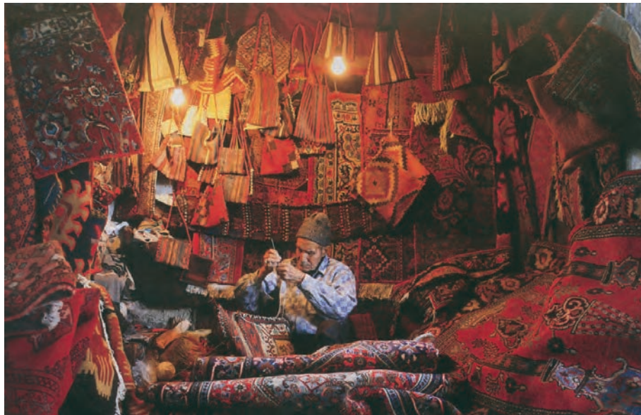
شکل ۲۷-۵- نمونه‌ای از بازار صنایع دستی تهران

۳- صنایع دستی عشایری: قدیمی‌ترین نوع صنایع دستی استان است که تولید آن عموماً به طور خانگی و فصلی انجام می‌پذیرد. این نوع از صنایع دستی، با توجه به ترکیب قومی منطقه، در میان صنایع دستی استان جایگاهی ویژه دارد و هم اینک یکی از نقاط برجسته و مثبت صنایع دستی استان محسوب می‌شود. دست‌اندرکاران این بخش از دست ساخته‌های ایرانی که بافت انواع قالی و قالیچه، جاجیم و گلیم، چننه ۱ ، رویه پستی، جوال ۲ ، خورجین ۳ و نیز رنگرزی و ریسندگی پشم را در انحصار خود دارند، گروهی از عشایر لر، قشقایی، شاهسون و... هستند که در دهه‌های اخیر از زادگاه خود به تهران، ری، ورامین و کرج مهاجرت کرده‌اند.