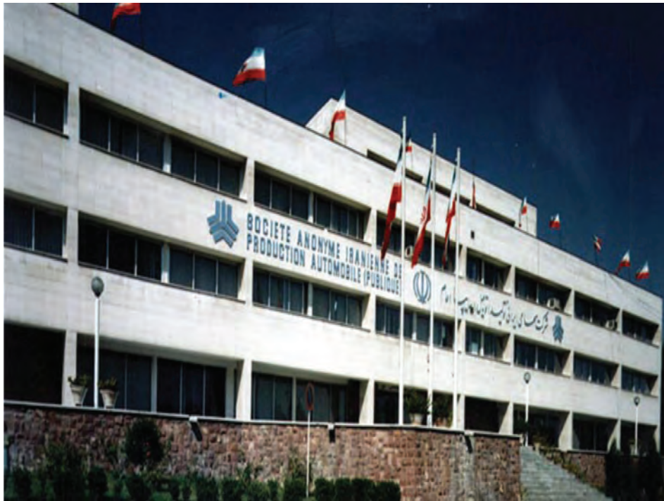
شکل ۲۵-۵- شرکت خودروسازی سایپا