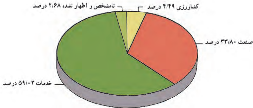
شکل ۲۰-۵. نمودار درصد شاغلان در بخش‌های مختلف اقتصادی استان

استان تهران یکی از قطب‌های اقتصادی کشور است. تجمع کانون‌های اقتصادی در این استان و موقعیت سیاسی و اداری و نیز مرکزیت آن باعث شده است که بخش عمده امکانات در محدوده آن متمرکز شود. نمودار زیر، شاغلان را در سه بخش کشاورزی، صنعت و خدمات در استان تهران نمایش می‌دهد.