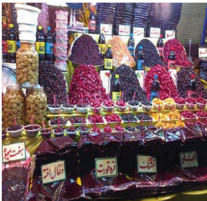
شکل ۲۸-۵- فروشگاه در منطقه دربند