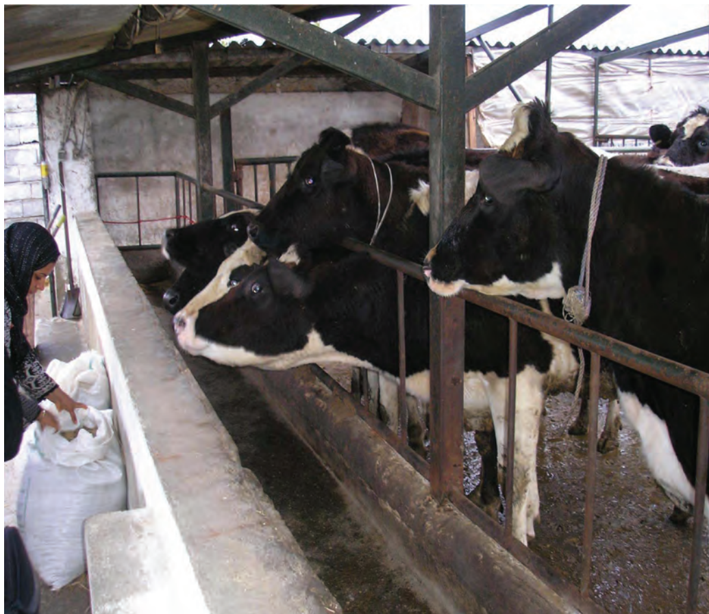
شکل ۲۴-۵- مرکز دامداری صنعتی

اشکال عمده دامداری در این استان شامل گاو‌داری‌های صنعتی بزرگ، پرورش طیور، مرغ‌داری‌ها، پرورش زنبورعسل و پرورش ماهی است.