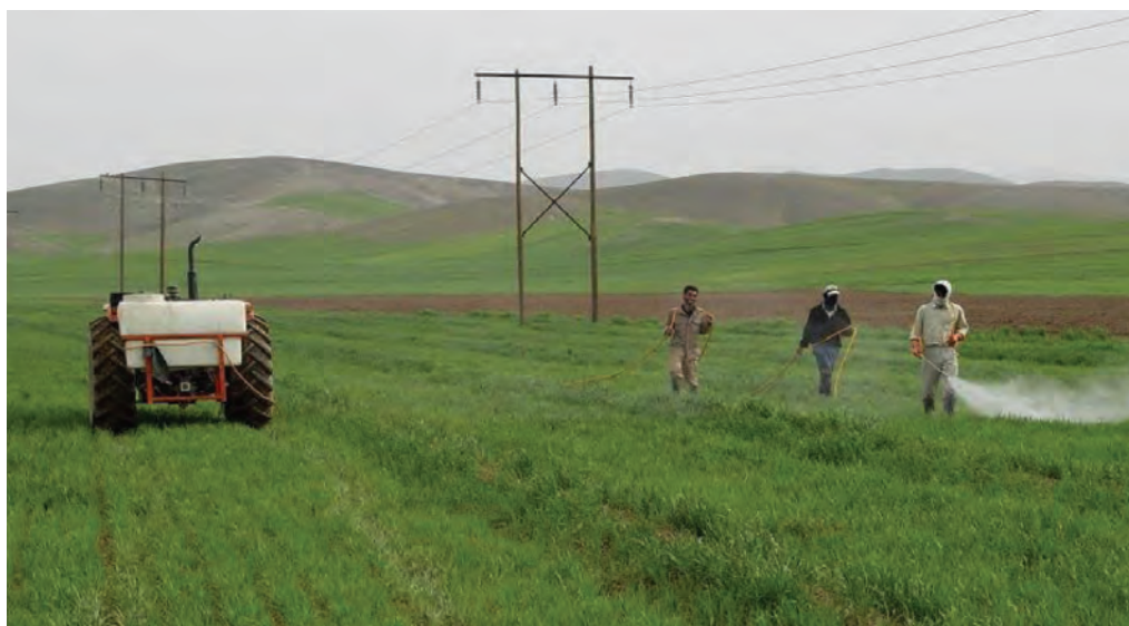
شکل ۲۲-۵- فعالیت‌های کشاورزی در اطراف شهر ری

۲- دشت‌ها و کوهپایه‌های جنوبی البرز؛ شامل ورامین، ری، شهریار و رباط کریم است. این بخش برای کشاورزی مساعد است؛ زیرا از منابع آب‌های سطحی و زیرزمینی برخوردار است اما زمین‌هایی که در نزدیکی شوره‌زارها واقع شده‌اند، برای کار کشاورزی مناسب نیستند.