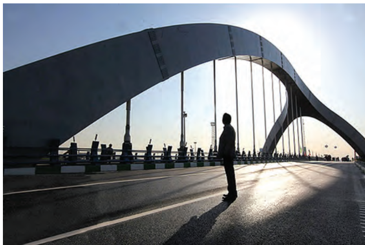
شکل ۳-۶- پل جوادیه

آغاز به کار متروی تهران در سال ۱۳۷۸ نقطه عطفی در توسعه شبکه ریلی استان محسوب می‌شود که روزانه هزاران مسافر را جابه‌جا می‌کند.