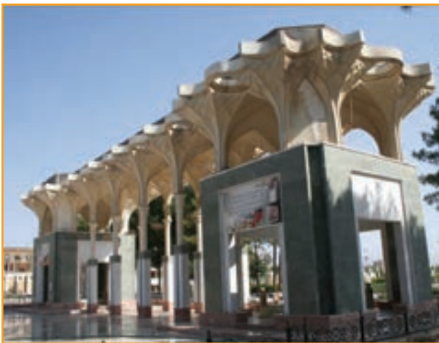
شکل ۳۱-۴ بنای یادمان شهدای گمنام استان کرمان