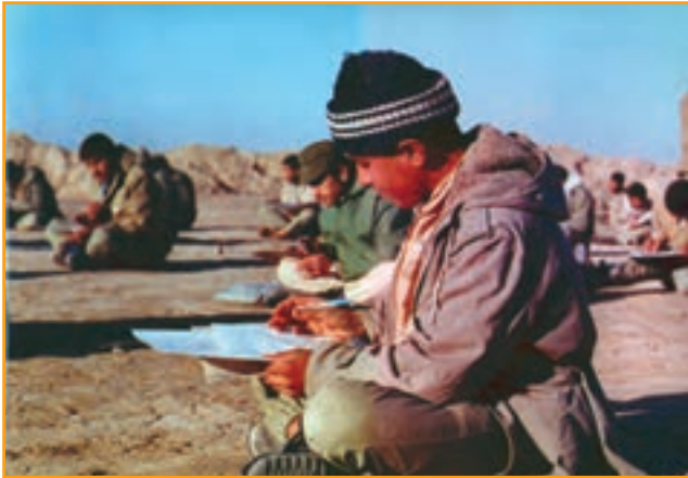
شکل ۳۰-۴ دانش‌آموزان رزمنده کرمانی در جبهه دفاع مقدس