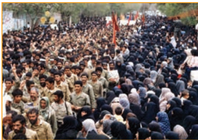
شکل ۳۳-۴- اعزام رزمندگان کرمانی به جبهه‌های حق علیه باطل

رزمندگان استان در طول ۸ سال دفاع مقدس به صورت متناوب به جبهه‌ها اعزام می‌کردند. بزرگ‌ترین اعزام استان، هم‌زمان با اعزام سراسری سپاهیان حضرت محمد صلی الله علیه و آله در آذرماه ۱۳۶۵ بود. در این اعزام بیش از ۱۵ هزار نفر رزمنده به جبهه اعزام کردند. همچنین عملیات‌های والفجر ۸ با حضور ۵۴۴۰ نفر و کربلای ۵ با حضور ۹۱۲۶ نفر شاهد بیشترین حضور رزمندگان استان کرمان در عملیات‌ها بود.