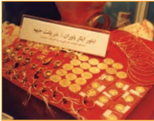
شکل ۳۴-۴- نمونه‌ای از کمک‌های مردم استان کرمان در طول هشت سال دفاع مقدس

مساجد در سطح استان مهم‌ترین مراکز جمع‌آوری و ارسال کمک‌های مردمی بودند. مسجد جامع کرمان و زینبیه رفسنجان از عمده‌ترین این مراکز به شمار می‌آیند.