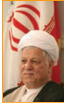
شکل ۴-۱۳- آیت الله هاشمی رفسنجانی