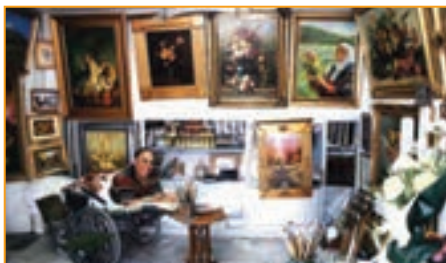
شکل ۴-۲۵- جهان بخش صادقی گوغری