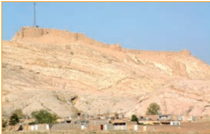
شکل ۱-۲- قلعه دختر کرمان

الف) قبل از اسلام : کرمان در دوره هخامنشی یکی از ولایات مهم تابعه پارس محسوب می شده است. اردشیر بابکان که محل تولد و نشو و نما او شهر بابک کرمان بود، در آبادانی این مملکت سعی فراوان داشت از جمله اینکه در شهر کرمان در جوار قلعه دختر، قلعه اردشیر را بنا نهاد و آن را گواشیر نامید و هنوز آثار خرابه‌های قلعه دختر و قلعه اردشیر بر فراز تپه‌ای در شرق کرمان پابرجاست.