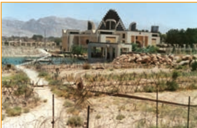
شکل ۳۲-۴ موزه دفاع مقدس استان کرمان