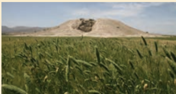
شکل ۱۰-۴- محوطه باستانی تپه یحیی