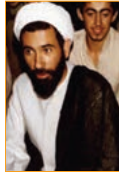
شکل ۴-۱۲- شهید دکتر محمد جواد باهنر