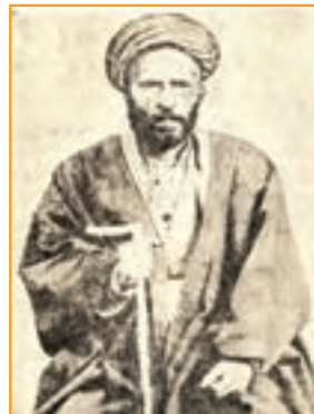
شکل ۴-۲۱- ناظم الاسلام کرمانی