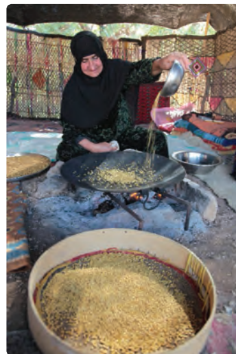
شکل ۹-۳. برخی خوراکی های محلی استان