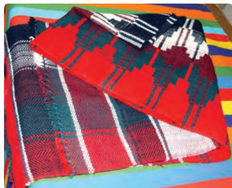
شکل ۳-۷- برخی صنایع دستی استان