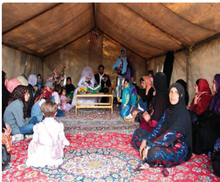
شکل ۲-۳- مراسم عروسی سنتی