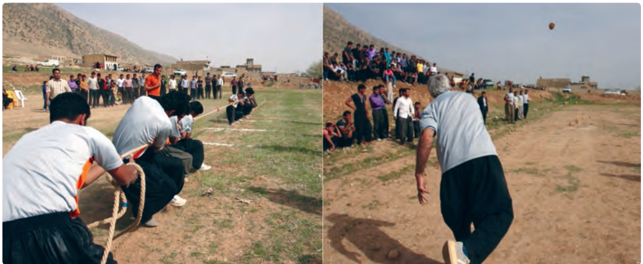
شکل ۵-۳- بازی‌های محلی در استان