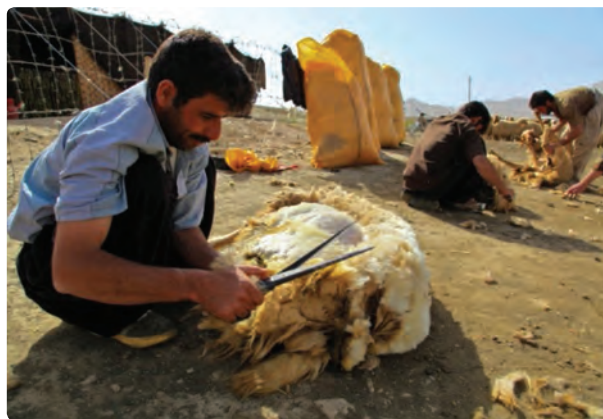
شکل ۳-۳- شیوه های همیاری در استان