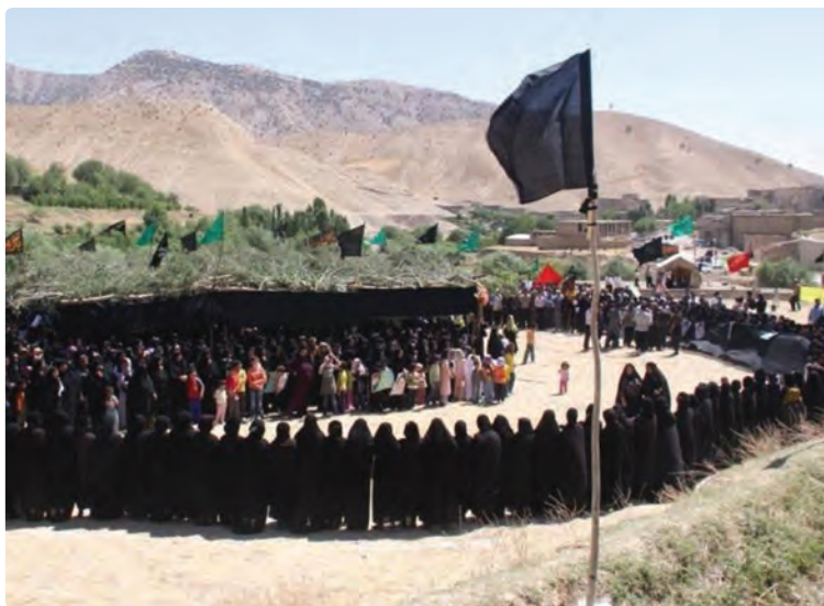
شکل ۳-۴- مراسم سنتی چه مه ر