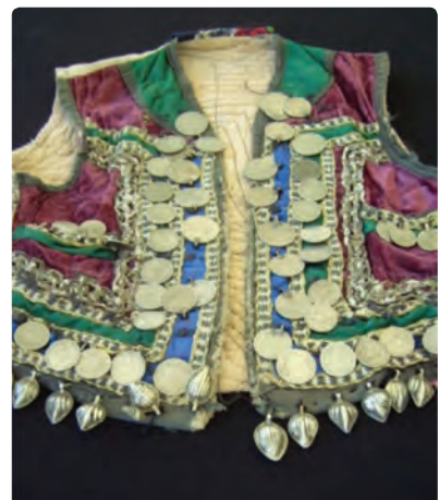
شکل ۳-۶- انواع لباس‌های محلی استان