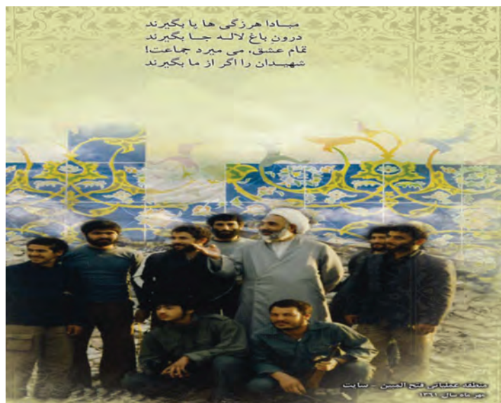
شکل ۱۵-۴- دیدار رزمندگان اردبیل با آیت الله مروج امام جمعه فقید اردبیل

نام یک یا چند شهید دفاع مقدس را در محل زندگی‌تان (روستا - شهر) شناسایی کنید و دربارهٔ چگونگی شهادت آنها تحقیق کرده و گزارشی از آن در کلاس ارائه دهید.