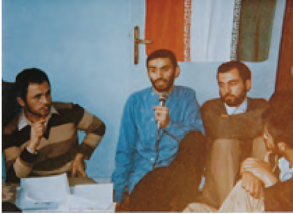
شکل ۲-۴- شهید داور یسری (نفر دوم از سمت چپ)