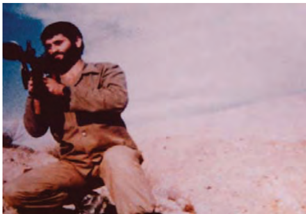
شکل ۲۲-۴- شهید بنام علی محمدزاده