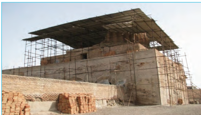
شکل ۴-۴- مسجد جمعه اردبیل یادگاری از دوره سلجوقیان

استان اردبیل امروزی به سبب موقعیت خاص خود، همواره در معرض تهاجم کوه‌نشینان قفقاز و اقوام دشت‌های جنوبی روسیه بوده است. چنانکه ترکان خزر و گرجیان بارها از دربند‌های قفقاز به دشت‌های اردبیل تاختند. با حضور ترکان سلجوقی در ایران، منطقه ما نیز در قلمرو آنها قرار گرفت و فرهنگ ترکان در میان مردم استان گسترش یافت. اردبیل در زمان حمله مغول نیز مرکز حکومت آذربایجان بود که غارت شد. ابن حوقل در کتاب صورة الارض می‌نویسد: «...مردم اردبیل در برابر مغولان به شدت مقاومت کردند و یک بار نیز آنها را شکست دادند. ولی سرانجام تسلیم شدند.»