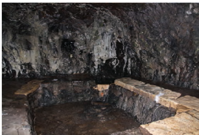
شکل ۱۲-۴- حمام سنگی خلخال

سابقه مدینت در خلخال، واقع در بخش جنوبی استان به هزاره دوم قبل از میلاد باز می گردد. در قرن های دوم و سوم هجری در کتب جغرافیایی آن دوره مورخان و جغرافی دانان درباره خلخال مطالبی آورده اند.