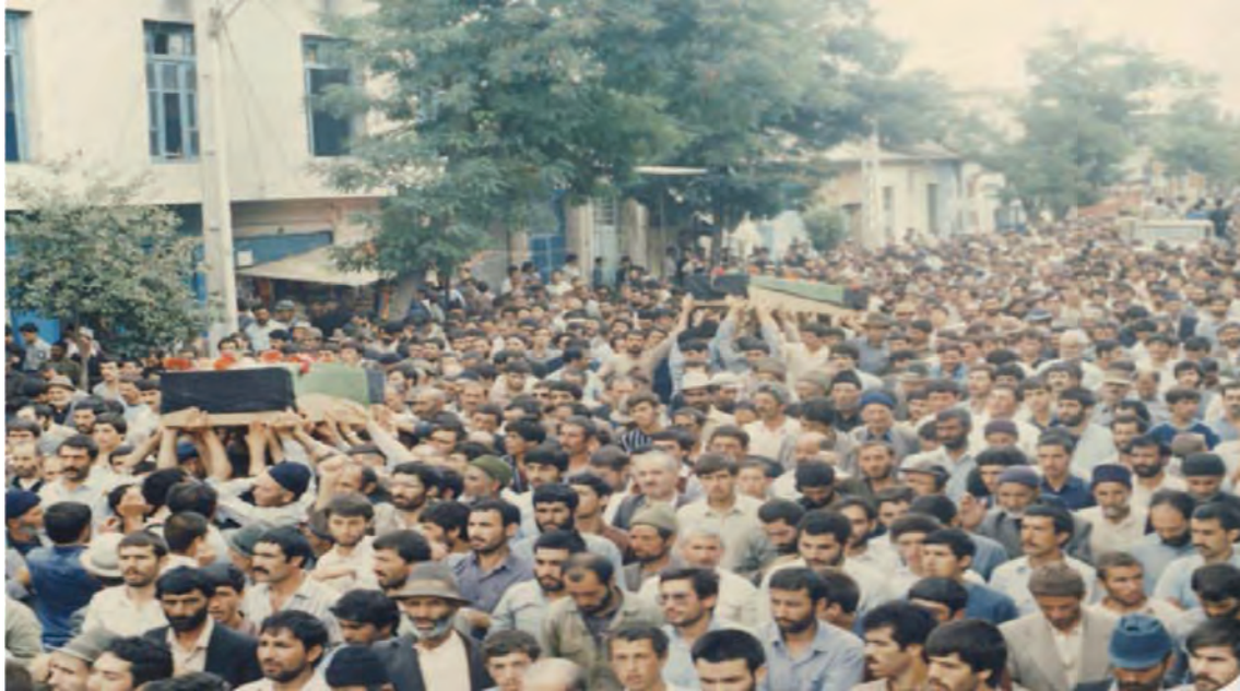
شکل ۱۶-۴- تشییع بیکر شهیدا