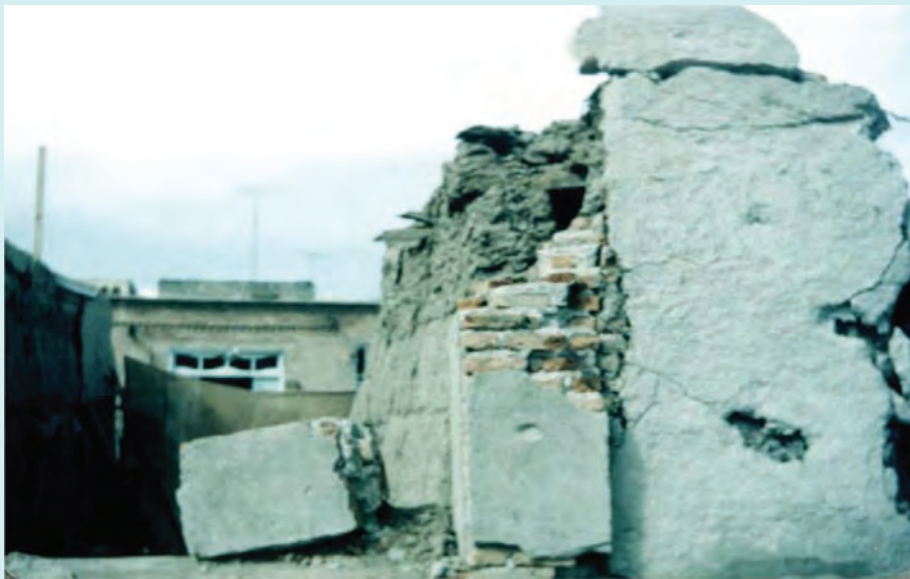
شکل ۱۷-۴- بمباران اردبیل

دربارهٔ بمباران هوایی اردبیل تحقیق کرده و برای همکلاسی هایتان توضیح دهید.