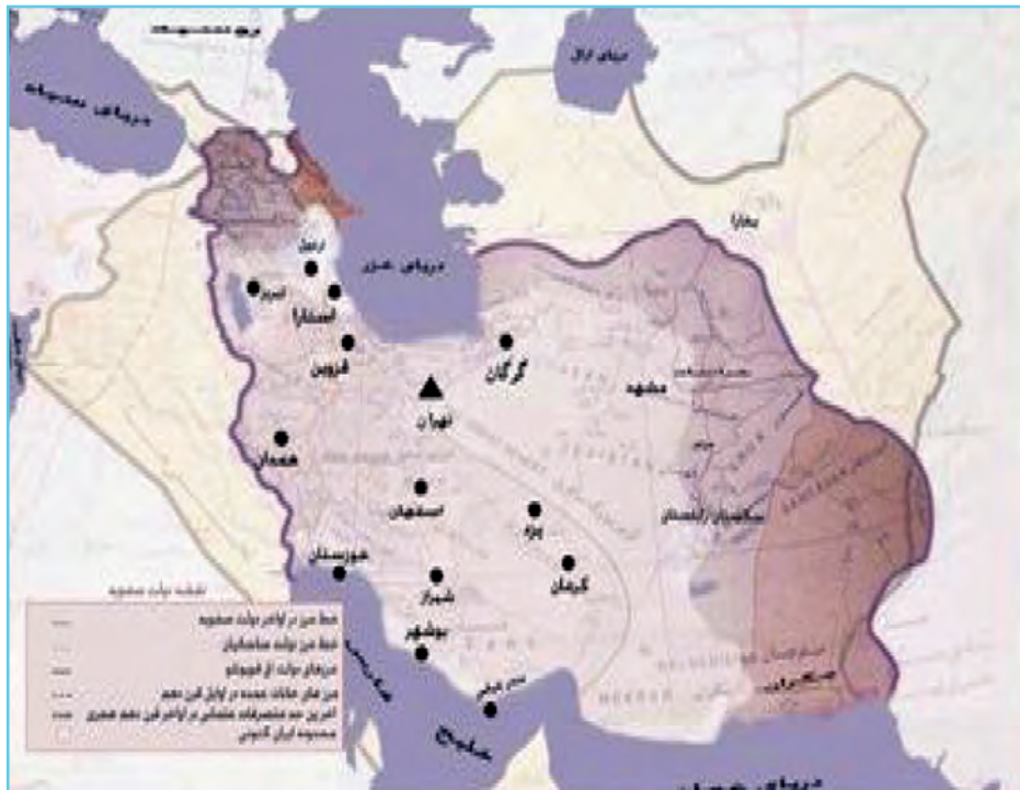
شکل ۴-۶- نقشه ایران در دوره صفویه که در آن ایران به‌عنوان خاستگاه مذهب تشیع در جهان مطرح شد.

شاه اسماعیل نواده شیخ صفی برای تشکیل حکومت واحد ایرانی از اردبیل قیام کرد و همه ولایات را مطیع خود ساخت. شورش‌ها را خواباند و ملوک الطوائفی را از بین برد. نخستین اقدام او رسمی کردن مذهب شیعه در ایران بود. بنابراین، اردبیل خاستگاه مذهب شیعه و تشکیل دولت ملی در ایران به شمار می‌رود.