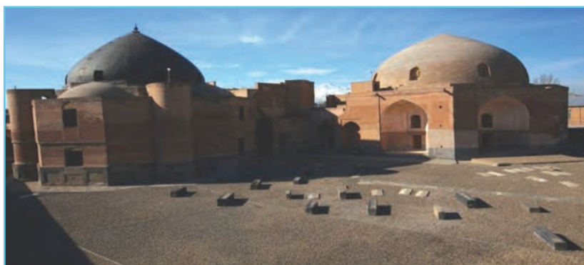
شکل ۴-۵- خانقاه شیخ صفی‌الدین در اردبیل

در دوره ایلخانان به دلیل رشد و گسترش تصوف، خانقاه‌های زیادی در نواحی مختلف ایران بنا شدند که مهم‌ترین آنها خانقاه شیخ صفی‌الدین در اردبیل بود. بزرگی مقام شیخ صفی‌الدین در عرفان باعث شد که اردبیل کعبه آمل و قبله صوفیان شود. علاوه بر مردم، حاکمان و بزرگان نیز احترام خاصی به شیخ صفی‌الدین و فرزندان آنها می‌گذاشتند، به طوری که معروف است امیر تیمور لنگ در ملاقات با شیخ خواجه علی در اردبیل هزاران اسیر عثمانی را به درخواست ایشان آزاد کرد.