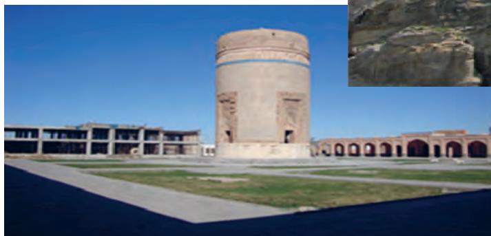
شکل ۱۱-۴- بقعه شیخ حیدر مشکین شهر

خیابان در دوره صفویه رونق بیشتری داشته است. در زمان شیخ حیدر که حاکم و والی این شهر بوده به دلیل تلاش وی برای رونق و آبادانی آن اهمیتی فوق العاده یافت. در دوره قاجار به ویژه در جنگ های ایران و روسیه این شهر از مراکز بسیار مهم برای استقرار سپاه عباس میرزای ولیعهد بوده است. در سال ۱۲۷۵ ه. ق. لشکریان روس پس از جنگ سختی با توپ و تفنگ و تجهیزات کامل شهر را به مدت ۶ ماه محاصره کرده و پس از سرکوب ایلات شاهسون که به شدت مقاومت می کردند، اموال مردم به عنوان غرامت توسط روس ها به یغما رفت.