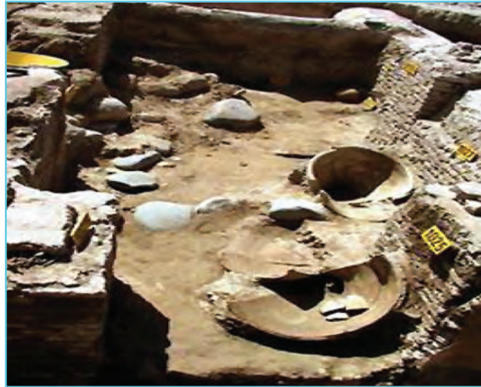
شکل ۳-۴- آثار به جا مانده در اردبیل از دوره پارت‌ها

یاقوت حموی در معجم البلدان بنای این شهر را به فیروز ساسانی که در سال‌های ۴۸۳-۴۵۹ میلادی سلطنت می‌کرد نسبت داده و آن را فیروزگرد نامیده است. وی در کتاب خود اردبیل را مشهورترین شهر آذربایجان خوانده و گفته است که پیش از اسلام کرسی ناحیه بوده و در جای دیگر گویند اردبیل از بناهای فیروز موسوم به باذان فیروز بوده است. این مطالب نشان می‌دهند که اردبیل یکی از شهرهای قدیمی ایران است و قبل از اسلام قرن‌های متمادی کرسی آذربایجان و قسمت مهمی از آن بوده است، ولی حوادث تاریخی به خصوص حملات طوایف و زلزله‌های سخت بارها آن را ویران کرده و آثاری را که امروز می‌توانست مدارک گویایی برای تاریخ آن حدود باشد به تاراج مهاجمان داده یا زیر خاک مدفون ساخته است.