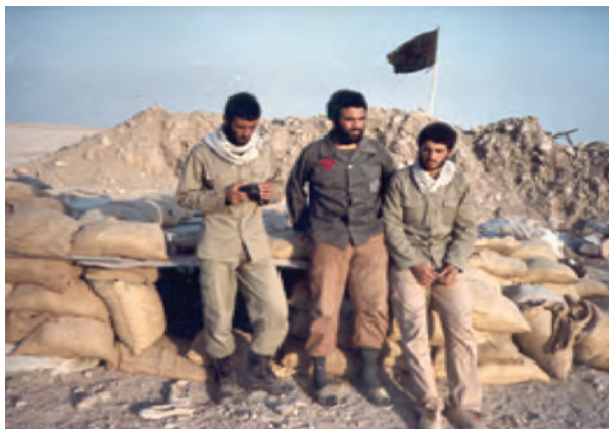
شکل ۲۱-۴- شهید میر محمود بنی هاشم (نفر دوم)