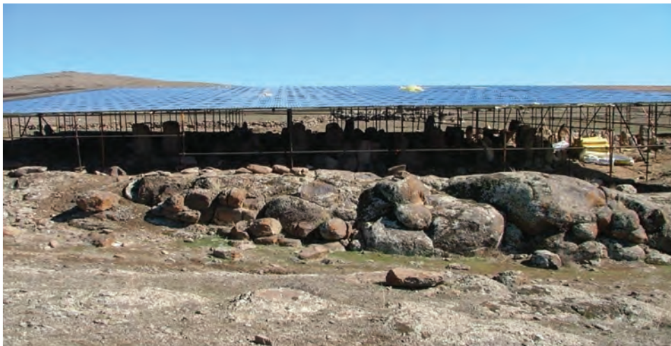
شکل ۱-۴- شهر یری در مشکین شهر مربوط به دوره پیش از تاریخ

با توجه به مدارک موجود باستان‌شناسی، می‌توان گفت منطقه اردبیل حداقل از هزاره ششم قبل از میلاد مسکون بوده است؛ چرا که سراسر منطقه از تپه‌های باستانی یا به عبارت دیگر مناطق استقراری که روزگاری دژ یا شهرک یا روستا بودند پوشیده شده است مانند شهر یری در مشکین شهر، قلعه اولتان در پارس آباد و بوینی یوغون (دژ بهمن) در نیر.