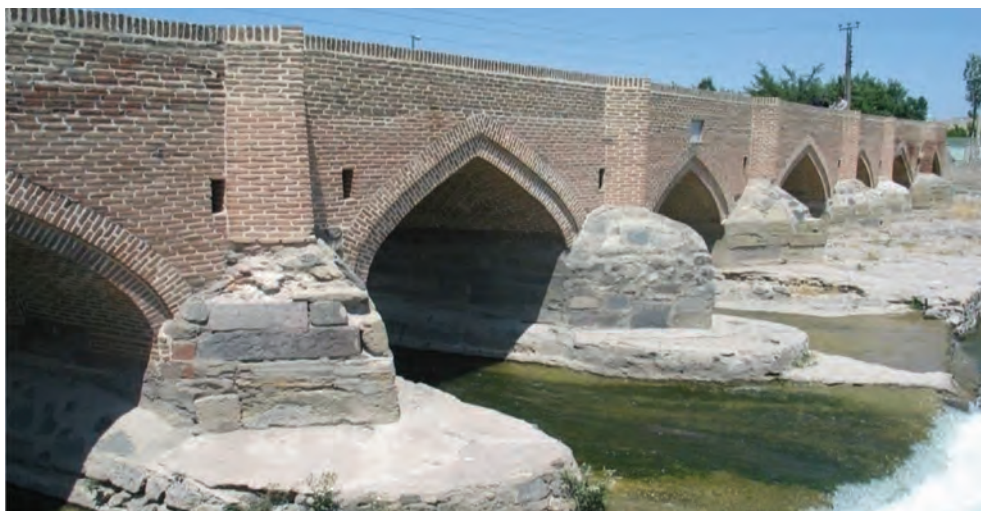
شکل ۸-۴- پل هفت چشمه اردبیل از دوره صفویه