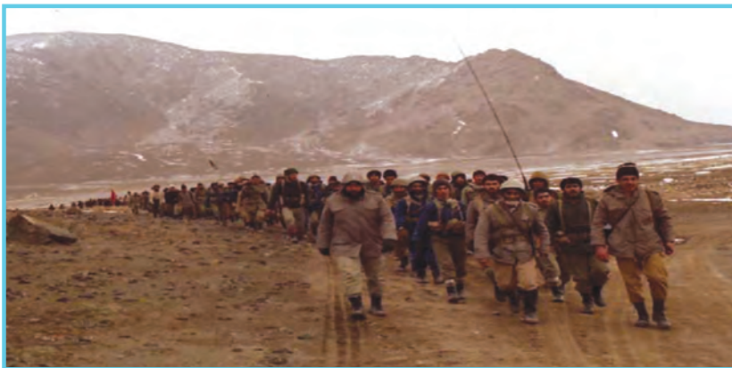
شکل ۱۴-۴- رزمندگان اسلام در جبهه

رزمی تیپ پیاده ارتش مستقر در اردبیل که متناسب به لشکر زرهی قزوین بود در اوایل جنگ در مناطق جنگی رشادت‌های به یادماندنی از خودشان نشان دادند. سومین یگان عمل‌کننده در استان اردبیل، نیروهای جان بر کف جهاد سازندگی بودند که در قالب جهاد آذربایجان شرقی از شروع جنگ تا پایان آن همواره در مناطق جنگی جهت سنگرسازی حضور داشتند.