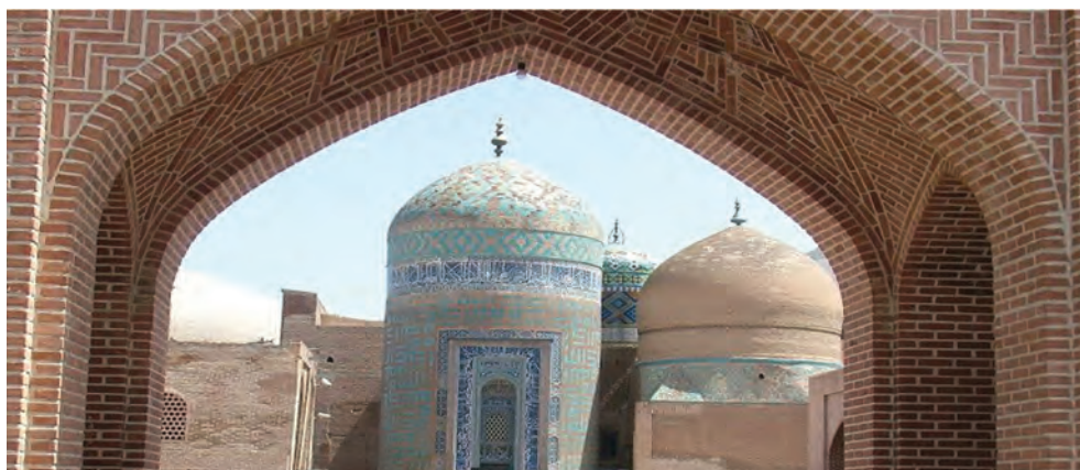
شکل ۷-۴- مجموعه بقعه شیخ صفی - گنبد الله الله در اردبیل