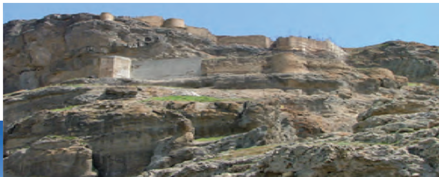
شکل ۱۰-۴- قلعه قهقهه در مشکین شهر