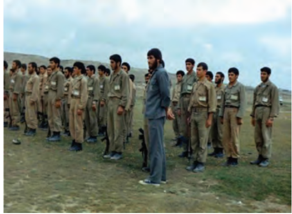
شکل ۱۹-۴- شهید شاپور برزگر (نفر اول)