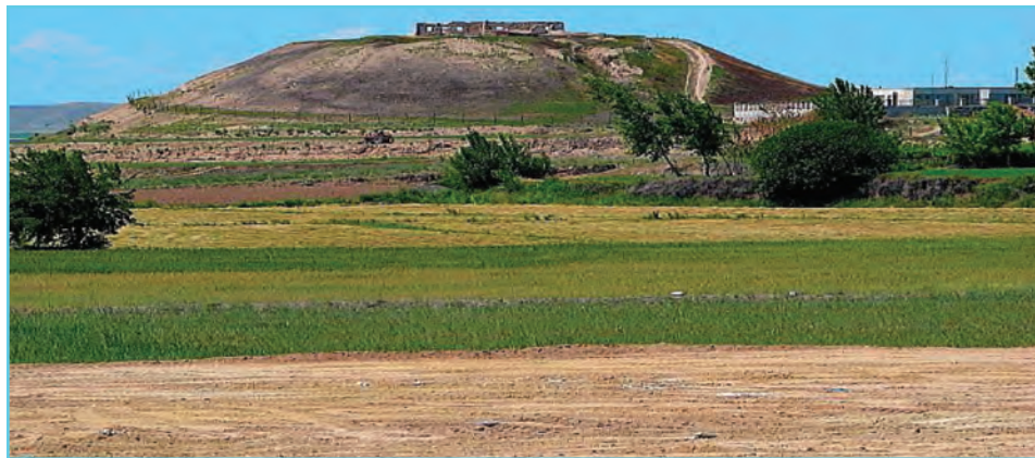
شکل ۹-۴- تپه نادری در اصلاندوز

اردبیل در دوره صفوی از لحاظ سیاسی و اقتصادی سرآمد شهرهای ایران بود. در آغاز دوره قاجار عباس میرزا نایب السلطنه فتحعلی شاه قاجار مرکز ستاد سپاهیان خود را در اردبیل قرار داد و به کمک افسران فرانسوی قلعه‌ای در برابر هجوم قوای روسیه بنا کرد که بعدها تبدیل به زندان شد. آیا شما نام آن قلعه را می‌دانید؟ در جنگ ایران و روسیه در ۱۲۱۸ هـ. ق قوای روس به اردبیل حمله کرد و تا تنظیم عهدنامه ترکمنچای این شهر در اشغال بیگانه بود. در زمان اشغال همه اشیای قیمتی و بی همتای مقبره شیخ صفی الدین و زینت آلات دیگر مقبره‌ها و کتاب‌های مهم کتابخانه اردبیل که شاه عباس وقف کرده بود و از کتاب‌های خطی نفیس و بی نظیر و بی همتا بود غارت شد. پس از ولیعهد نشین شدن تبریز در دوره قاجار اردبیل از رونق افتاد، ولی مردم استان اردبیل در تحولات مهم بعدی از جمله مشروطیت و حوادث بعد از شهریور ۱۳۲۰ هـ. ش، ملی شدن صنعت نفت، وقوع انقلاب اسلامی، دوران جنگ و سازندگی همپای مردم آذربایجان و ایران اسلامی در حفظ هویت ایرانی - اسلامی تلاش زیادی کرده‌اند. مغان بخش شمالی استان که سابقاً موغا یا مغان یا موقان نام داشته با داشتن مناطقی مانند باجروان، ورتان، برزند و اولتان و... سابقه تاریخی بسیار طولانی دارد.