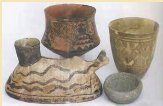
شکل ۴-۶- آثار کشف شده در قره تپه قمرود

ظروف از سفال‌های آجری و نخودی رنگ استفاده می‌کردند اما با ورود آریایی‌ها، سفالینه‌های خاکستری جایگزین آنها شد.