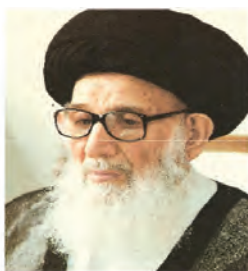
آیت الله گلپایگانی

در دوره معاصر، بزرگان زیادی در این سرزمین مقدس زندگی کرده‌اند که به چند نفر از آنها اشاره می‌شود: حضرت امام خمینی (ره) بنیان‌گذار جمهوری اسلامی ایران، آیت الله حاج شیخ عبدالکریم حائری مؤسس حوزه علمیه قم، علامه محمد حسین طباطبایی صاحب تفسیر ارزشمند المیزان، آیت الله مرعشی نجفی، آیت الله بروجردی، آیت الله گلپایگانی، آیت الله خوانساری، آیت الله بهاء‌الدینی، آیت الله اراکی، آیت الله صدر، آیت الله بهجت، آیت الله مشکینی و استاد علی اصغر فقیهی معلم و پژوهشگر برجسته. گفتنی است شهید مفتح، شهید مرتضی مطهری، شهید بهشتی، شهید آیت الله سعیدی و شهید حسین غفاری در راه پیروزی انقلاب اسلامی، به شهادت رسیدند.