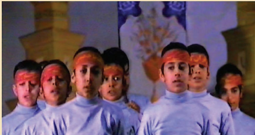
شکل ۱۶-۴ گروه سرود مدرسه قطب راوندی ساعتی قبل از شهادت