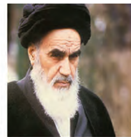
امام خمینی (ره)