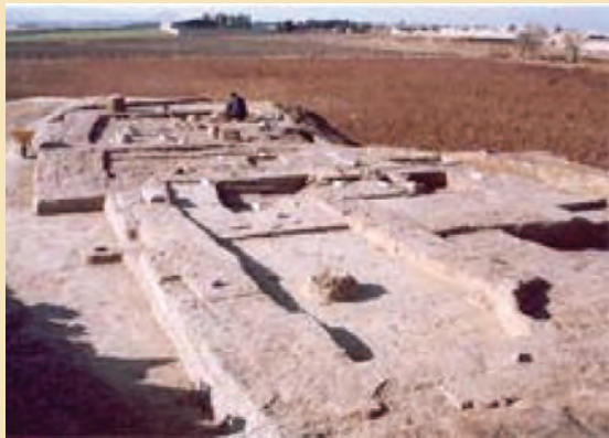
شکل ۴-۴- تپه تاریخی قلی درویش