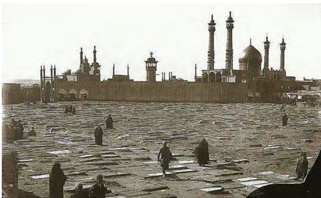
شکل ۲-۴- تصویر تاریخی از حرم مطهر حضرت معصومه (س)

در دوران سلطنت پهلوی دوم، قم به سنگر مبارزه فکری و مذهبی علیه سیاست‌های ضد مذهبی حکومت تبدیل شد. اولین جرقه انقلاب اسلامی در بهمن سال ۱۳۴۱ در شهر مقدس قم زده شد. مخالفت‌های علما و در رأس آنها حضرت امام خمینی (ره) با لایحه انجمن‌های ایالتی و ولایتی، رفراندوم اصول ششگانه انقلاب شاه و لایحه کاپیتولاسیون، شهر قم را به پایگاه مبارزه علیه رژیم محمد رضا پهلوی تبدیل کرد.