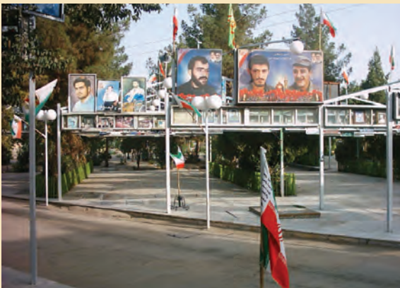
شکل ۴-۱۲- گلزار شهدای قم

در طول جنگ حدود ۵۰/۰۰۰ نفر از استان قم به جبهه‌های نبرد اعزام شدند. از این تعداد، حدود ۶۰۰۰ نفر از رزمندگان قمی به شهادت رسیدند، ۱۲۷۰۰ نفر به افتخار جانبازی نائل آمدند و ۵۴۰ نفر نیز از آزادگان سرافرازند.