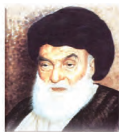
آیت الله بروجردی