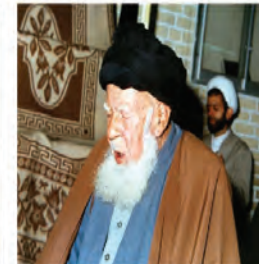
آیت الله بهاء‌الدینی