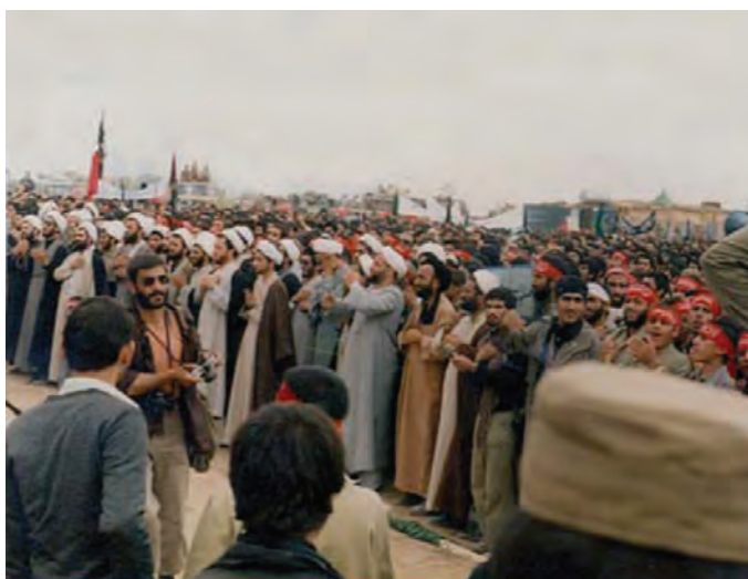
شکل ۱۴-۴- اعزام طلاب به جبهه