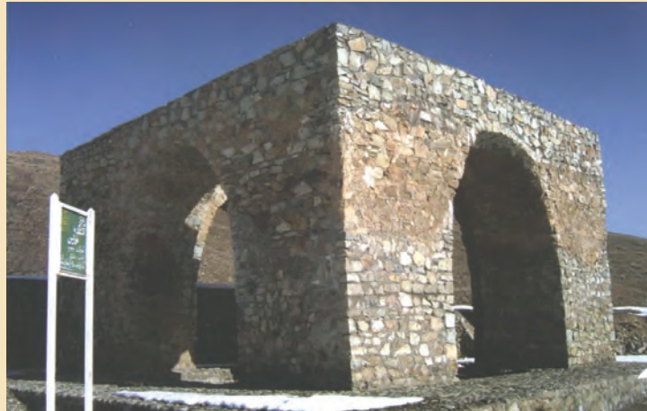
شکل ۷-۴- چهار طاقی (آتشکده) نویس در غرب استان

۲- چهار طاقی یا آتشکده : چهار طاقی یا آتشکده از آثار به جای مانده دوران پیش از اسلام در سرزمین قم است که معروفترین آنها چهار طاقی نویس (شکل ۷-۴) واقع در بخش خلجستان (روستای نویس) و چهار طاقی کزیمجان واقع در جنوب استان قم (در روستای کرمجان) است که هر دو مربوط به عصر ساسانی است.