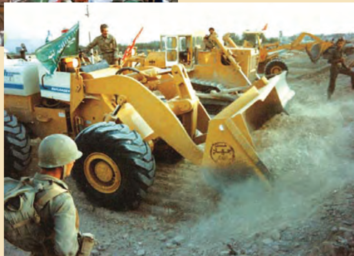
شکل ۱۵-۴- نقش جهادسازندگی در هشت سال دفاع مقدس