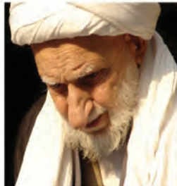
آیت الله بهجت