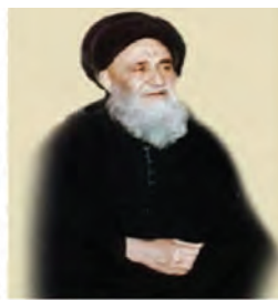
آیت الله مرعشی نجفی