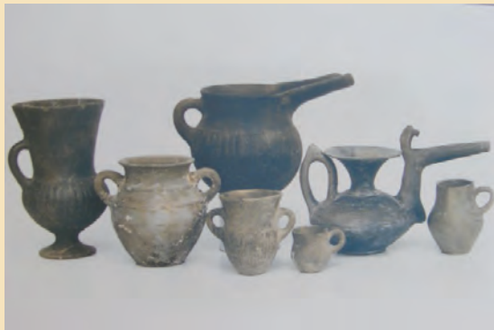
شکل ۴-۵- آثار کشف شده در تپه تاریخی صرم