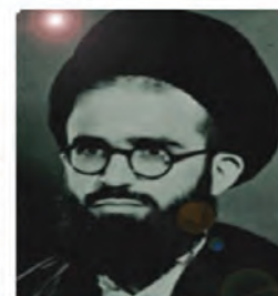
آیت الله سعیدی