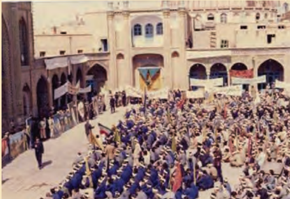
شکل ۴-۱۱- عزیمت رزمندگان روحانی به جبهه‌ها