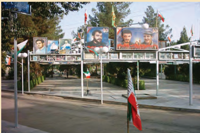
شکل ۱۸-۴- گلزار شهدای امام زاده علی بن جعفر علیه السلام قم

شهدای گمنام : یکی از مکان‌هایی که مورد بازدید و زیارت مردم قم و زائران حرم مطهر حضرت معصومه (س) قرار می‌گیرد مرقد پاک و مطهر ۱۴ شهید گمنام در محل کوه خضر نبی (ع) است. این شهدا که در پایین کوه خضر به خاک سپرده شده‌اند یکی از میعادگاهها و زیارتگاههای مردم به‌شمار می‌رود که در هفته به‌خصوص شب‌های جمعه پذیرای تعداد زیادی از زائران و هم‌زمان شهدا و مردم استان و دیگر مناطق کشور است.