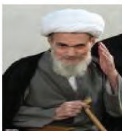
آیت الله مشکینی