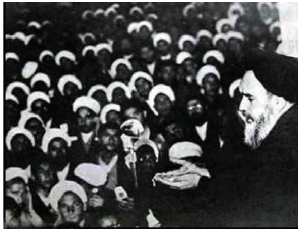
شکل ۳-۴- سخنرانی پرشور امام خمینی (ره) در ۱۲ خرداد سال ۱۳۴۲

پس از پیروزی شکوهمند انقلاب اسلامی ایران، شهر قم به پایتخت مذهبی کشور تبدیل شده است و علما و مردم آگاه قم در تحولات سیاسی کشور نقش مهمی ایفا می‌کنند و همواره پشتیبان برنامه‌ها و اهداف انقلاب اسلامی هستند.