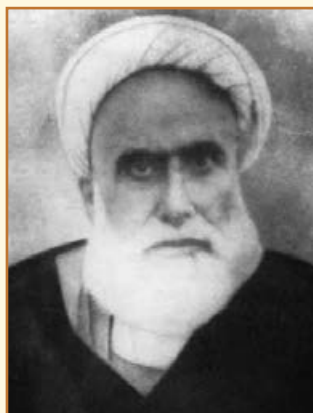
حاج شیخ عباس قمی

– قاضی احمد قمی نویسنده کتاب «خلاصة التواریخ».