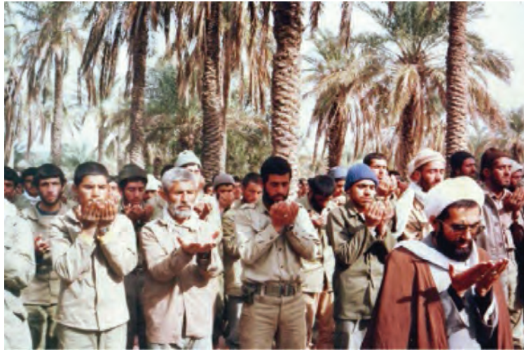
تصویر ۱-۱۱- رزمندگان استان در جبهه‌های حق علیه باطل

— آیا در مورد اتفاقاتی که در زمان انقلاب و جنگ تحمیلی در استان رخ داده، چیزی شنیده‌اید؟