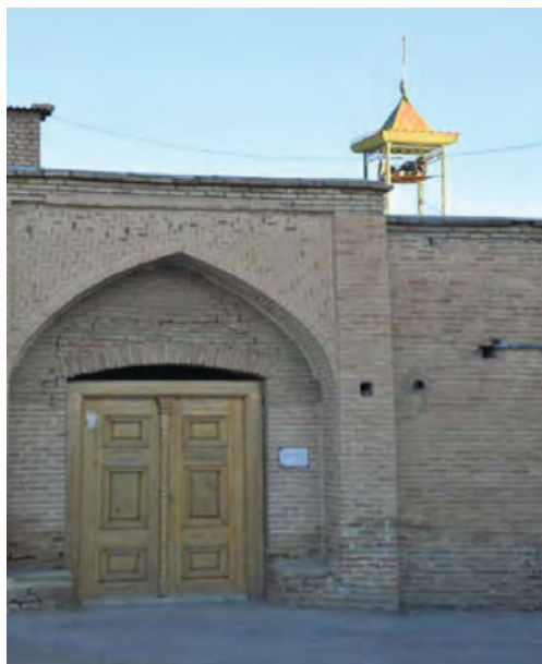
تصویر ۱۵-۱۰- مسجد جامع شهر کیان

همچنین در این زمان تعداد قابل توجهی از آرامنه در نقاط خوش آب و هوای چهارمحال اسکان داده می‌شوند. هسته اولیه بسیاری از شهرهای امروزی استان در دوره صفویه شکل گرفته است. در این زمان، مرکز حکومتی و دولتی منطقه در «قهفرخ» - فرخ شهر - قرار داشت. از این دوره آثار و بناهای بسیاری بر جای مانده است. استان در دوران افشاریه: در دوره افشاریه منطقه چهارمحال و بختیاری به دلیل هم‌جواری با شهر بزرگ اصفهان و برخورداری از شرایط طبیعی خاص و به خصوص دارا بودن چمن‌زارها و چراگاه‌های وسیع و سرسبز، استقرار ایل بزرگ بختیاری و وجود خوانین و سرکردگان قدرتمند که در صدد دستیابی به قدرت بودند، اهمیت بسیاری داشته است.