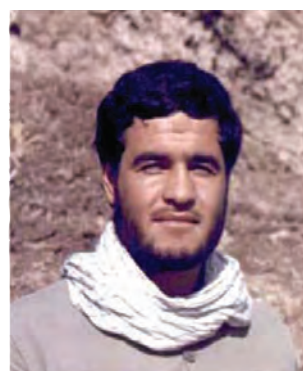
سردار شهید جمشید براتیور