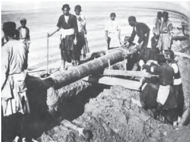
تصویر ۲۲-۱۰ بختیاری‌ها و نفت

از این پس خوانین بختیاری، موفق به دستیابی به مقامات و مناصب مهم دولتی و موقعیت‌های مناسب اجتماعی و اقتصادی شدند. حضور کمپانی «لینچ» در منطقه و قرارداد خوانین بختیاری با آنان برای احداث جاده‌ای کاروان رو که خوزستان را به اصفهان متصل می‌کرد؛ و نیز قرارداد انگلیسی‌ها در مورد نفت جنوب با خوانین بختیاری شرایط و موقعیت‌های مناسبی برای آنان فراهم آورد. کاخ قلعه‌های زیادی از این دوره در مناطق مختلف چهارمحال و بختیاری متعلق به خوانین بر جای مانده است.