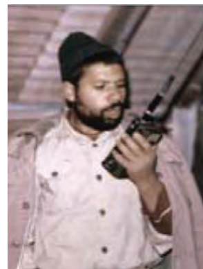
سردار شهید مرتضی اسماعیل زاده