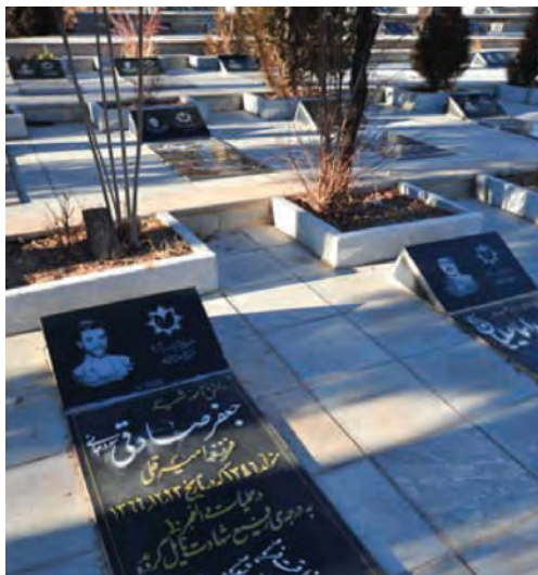
تصویر ۳-۱۱- گلزار شهدای شهرکرد

— آیا در مورد اتفاقاتی که در زمان انقلاب و جنگ تحمیلی در استان رخ داده، چیزی شنیده‌اید؟