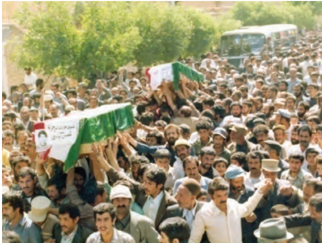
تصویر ۷-۱۱- تشییع پیکر شهدا در زمان جنگ تحمیلی