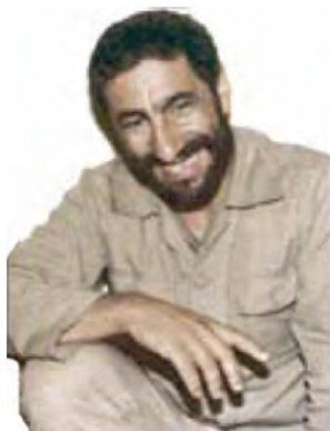
سردار شهید محمدعلی شاه مرادی