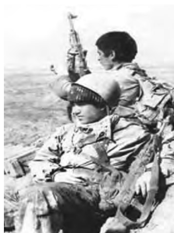
تصویر ۱۱-۱۲- دانش آموزان شهید صحراگرد و خالدی