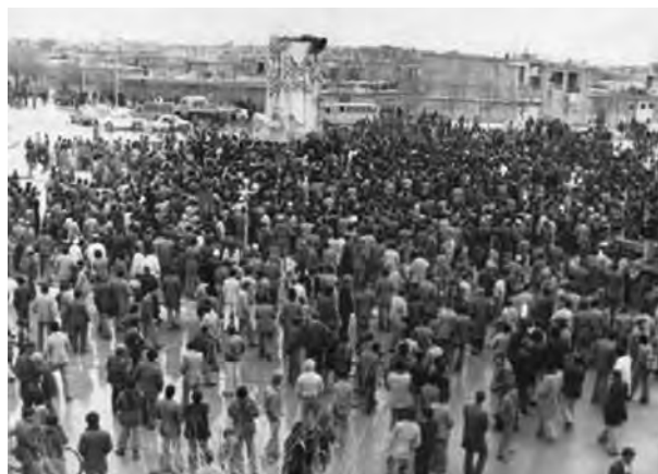
تصویر ۲۳-۱۰ - سقوط نماد نظام شاهنشاهی در شهرکرد - دی ماه ۱۳۵۷

در دوره پهلوی، بختیاری‌ها که تمام منطقه را در دست داشتند، به تدریج نقش سیاسی خود را از دست می‌دهند؛ و تشکیلات سیاسی قبیله‌ای متلاشی می‌گردد؛ و با توجه به امنیت نسبی ایجاد شده و رویدادهایی چون اسکان اجباری عشایر - در دوره پهلوی اول - و انجام اصلاحات ارضی - در دوره پهلوی دوم - کوچ روی کم رونق و یکجانشینی گسترش می‌یابد.