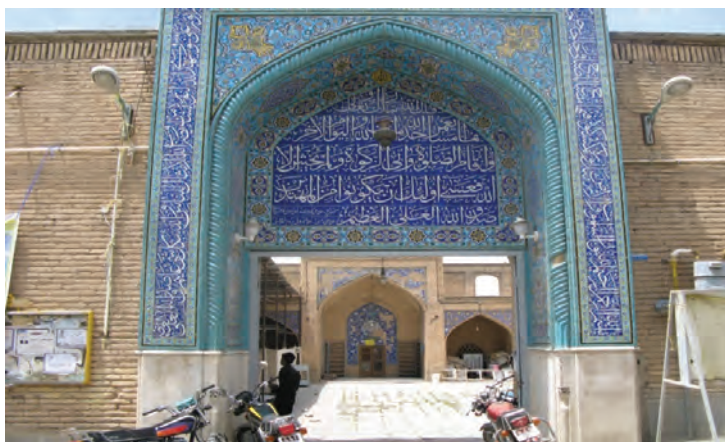
تصویر ۵-۱۱- مسجد جامع شهرکرد (یکی از مراکز تجمع و برگزاری سخنرانی‌های انقلابی در جریان انقلاب اسلامی)

الف) نقش استان در حراست از مرزهای ایران اسلامی همان‌طور که در درس دهم خواندیم، مردم چهارمحال و بختیاری در طول تاریخ همراه با دیگر هموطنان خود به پاسداری از کشور پرداخته‌اند. در این درس با نقش استان در زمان انقلاب اسلامی و جنگ تحمیلی عراق علیه ایران و نیز بعضی شخصیت‌ها و سرداران دفاع مقدس آشنا می‌شوید.