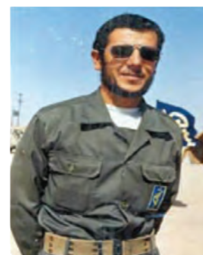
سردار شهید سید کمال فاضل