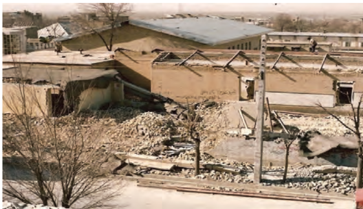
تصویر ۱۱-۱۱- بمباران شهرکرد توسط جنگنده‌های دشمن یعنی در تاریخ ۱۳۶۶/۱۲/۲۰

از آنجایی که مردم استان با تمام توان از رزمندگان اسلام حمایت می نمودند، دشمن یعنی برای شکستن مقاومت آنها، حملات وحشیانه‌ای به شهرکرد انجام داد که در اثر این حملات تعداد ۸۴ نفر از هم استانی‌های ما به درجه رفیع شهادت نایل آمدند.