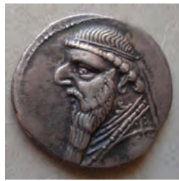
تصویر ۸-۱۰- سکه دوره اشکانی