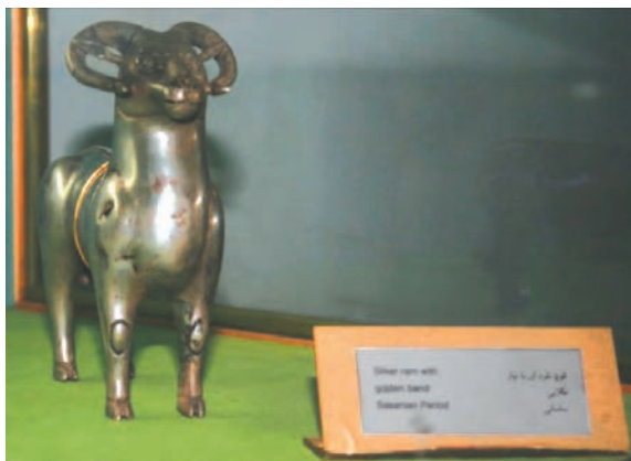
تصویر ۹-۱۰- مجسمه بازمانده از دوره ساسانی

احتمال می‌رود هم زمان با دولت سلوکیان، حکومت محلی «الیمایی» در بخش‌هایی از مناطق غربی منطقه با مرکزیت شهری ایزده تشکیل شده باشد. الیمایی‌ها با استفاده از نبود یک حکومت مرکزی مقتدر پس از سقوط هخامنشیان و نیز شیوه حکومت ملوک الطوائفی اشکانیان، بر قدرت خود افزودند؛ به طوری که نواحی جنوب خوزستان تا خلیج فارس را به اشغال خود در آورده و مستقلاً به ضرب سکه پرداختند. اگر چه با تشکیل دولت ساسانی به قدرت حکمرانان الیمایی پایان داده شد. نفوذ سیاسی - اجتماعی، تمدنی و فرهنگی ساسانیان در استان به قدری زیاد بوده که علاوه بر بقایای جاده‌ها و پل‌ها، تعداد زیادی اشیاء تاریخی از جمله سکه و مهر از این دوره بر جای مانده است. بردگوری‌ها نیز از دیرین آثار سنگی استان در دوران قبل از اسلام می‌باشند که در مناطق مختلف پراکنده‌اند.