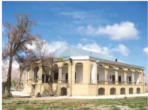
تصویر ۲۱-۱۰ قلعه سردار اسعد در جونقان