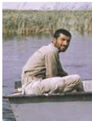
سردار شهید اردشیر غریب