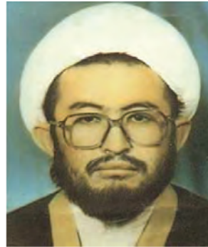
حجت الاسلام شهید عیسی توسلی