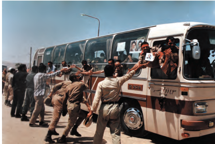
تصویر ۱۰-۱۱- ورود آزادگان به کشور