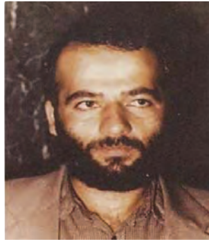
شهید مجتبی استکی