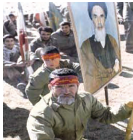
تصویر ۸-۱۱- اعزام رزمندگان اسلام به جبهه (در این نبرد، پیر و جوان، از ایران اسلامی دفاع می‌کردند)