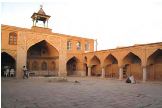
تصویر ۱۱-۱۰- مسجد جامع چالشر

در آثار نویسندگان، سیاحان و جهان‌گردانی چون ناصر خسرو، اصطخری و ابن بطوطه، از مناطق مختلف استان نظیر لردگان با عنوان «لوردغان» و فرخ شهر به صورت «کریوه الرخ» شرحی به میان آمده است. در هر حال مطالعات و بررسی‌ها نشان می‌دهد که از آغاز دوران اسلامی تا قرن سوم هجری این منطقه جزء ایالت جبال محسوب می‌شده است. در سال ۲۳ هجری با فتح نواحی شوشتر و ایزه توسط مسلمانان، کوچ نشینان آن نواحی با اسلام آشنا و به مرور سایر نواحی بختیاری و چهارمحال نیز اسلام را پذیرفتند. از اواخر قرن دوم هجری حکام محلی چهارمحال و بختیاری تابع خلفای عباسی شدند و از قرن سوم هجری به بعد است که عنوان «بلاد اللور» به استان‌های کنونی لرستان، ایلام، چهارمحال و بختیاری، کهگیلویه و بویر احمد و بخش‌هایی از استان‌های فارس و خوزستان اطلاق شد.