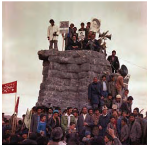
تصویر ۲۴-۱۰ - سقوط نماد نظام شاهنشاهی در بروجن

در این دوره با تأسیس برخی نهادها و مؤسسات دولتی در «شهرکرد» این محل که از اواسط دوره قاجار اهمیت یافته بود، عملاً به مرکز سیاسی و حکومتی منطقه تبدیل شد.