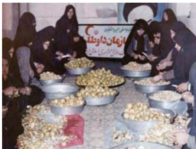
تصویر ۹-۱۱- اهدای کمک‌های مردم استان به جبهه (کارگاه همگام با جبهه)

رزمندگان استان ما از ابتدای جنگ تحمیلی در اغلب عملیات‌ها شرکت نموده و با تشکیل تیپ مستقل ۴۴ قمر بنی هاشم (قبل از عملیات محرم) فتوحات زیادی را کسب نمودند. در این میان فرهنگیان و دانش‌آموزان استان نقش بسیار مهمی داشتند و شهدای زیادی را تقدیم اسلام و انقلاب نمودند.