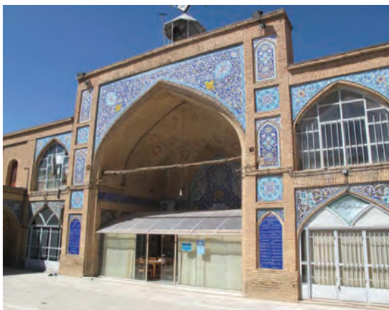
تصویر ۱۸-۱۰- مسجد جامع شهرکرد