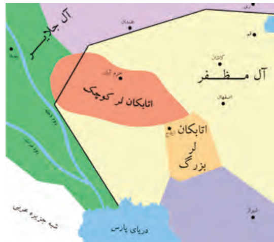
تصویر ۱۲-۱۰- محدوده حکومتی اتابکان لر

استان در دوران صفویه: در دوره صفویه استان چهارمحال و بختیاری به دلیل نزدیکی به شهر اصفهان - پایتخت صفویان - نقش مهم ایلات و عشایر، وجود چراگاه ها و مراتع غنی و سرسبز، مورد توجه پادشاهان صفوی قرار گرفت. اولین بار در دوره صفویه بود که منطقه ای که قبلاً به نام «لُر بزرگ» خوانده می شد کم کم به «بختیاری» معروف گشت. از زمان شاه تهماسب با توجه به تلاش های وی برای انتقال آب کارون به زاینده رود، منطقه مورد توجه بیشتری قرار گرفت.