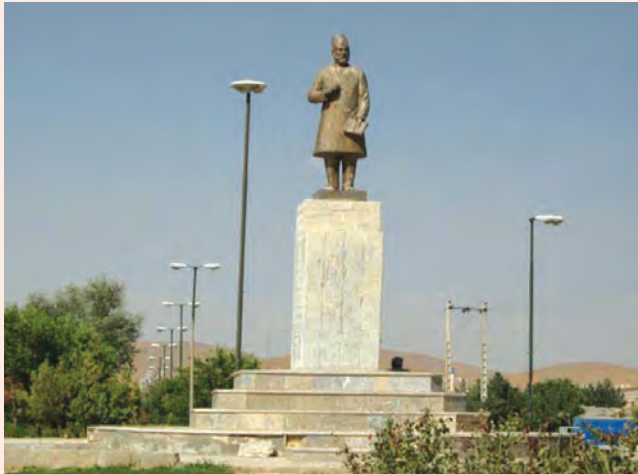
تصویر ۲۹-۱- تندیس یادبود میرزا حبیب دستان بنی در شهر بن

سال در تهران به فراگیری ادبیات و فقه و اصول پرداخت. او مدت کوتاهی بعد ناچار عازم استانبول در امپراتوری عثمانی آن روزگار شد و در مکاتب و مدارس مختلف به تحصیل و تدریس مشغول و مدتی از اعضای انجمن معارف آنجا بود. وی در استانبول با آزاد مردانی که برای بیداری ایرانیان کوشش می نمودند، همکاری می کرد. دستان در سال ۱۳۱۵ هـ.ق. در شهر بурсای عثمانی از دنیا رفت و در همان جا به خاک سپرده شد. از آثار این ادیب دانشمند و خوش