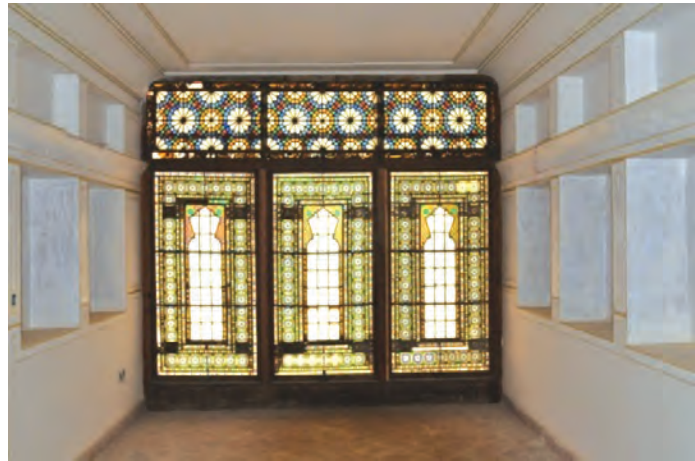
تصاویر ۱۶-۱۰- خانه آزاده چالستر