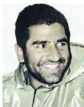
سردار شهید ایرج آقا بزرگی نافچی