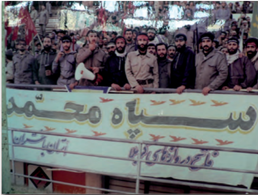
شکل ۴-۵- تصویری از سپاه محمد (ص)

رژیم عراق برای پیروزی در جنگ از هیچ عمل ننگینی علیه رزمندگان و مردم بی دفاع مرزنشین استان فروگذار نکرد؛ به طوری که در طول جنگ بارها از سلاح های شیمیایی استفاده کرد. از مناطقی که این چنین ناجوانمردانه مورد حمله شیمیایی دشمن قرار گرفت، می توان به روستای بان زرده ریجاب اشاره نمود.