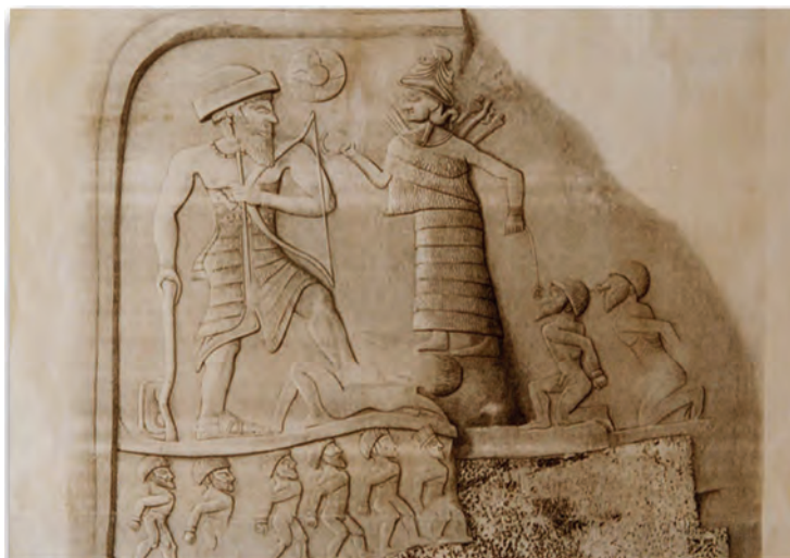
شکل ۳-۴- نقش آنوبانی نی - سرپل زهاب

از نخستین اقوام ساکن در منطقه کرمانشاه کنونی که نام آن‌ها در تاریخ ذکر شده، می‌توان اقوام گوتی، کاسی و لولوبی را نام برد. در این میان لولوبی‌ها یکی از قدیمی‌ترین سنگ‌نگاره‌های شناخته شده ایران (نقش آنوبانی نی) را پدید آوردند (شکل ۳-۴).