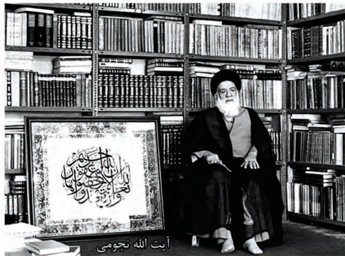
آیت الله نجومی