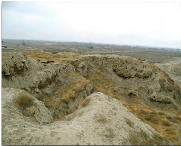
شکل ۲-۴- قدمت سکونت در تپه گودین در کنگاور به هزاره ششم قبل از میلاد می‌رسد.