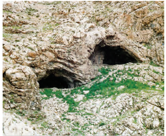
شکل ۱-۴- غار دواشکفت یکی از کهن‌ترین سکونتگاه‌های بشر در منطقه کرمانشاه در دامنه کوه تاق بستان

به نظر شما آیا رابطه‌ای بین گذشته تاریخی هر منطقه و جغرافیای طبیعی آن وجود دارد؟ با ذکر مثال برای گفته‌های خود دلیل بیاورید.