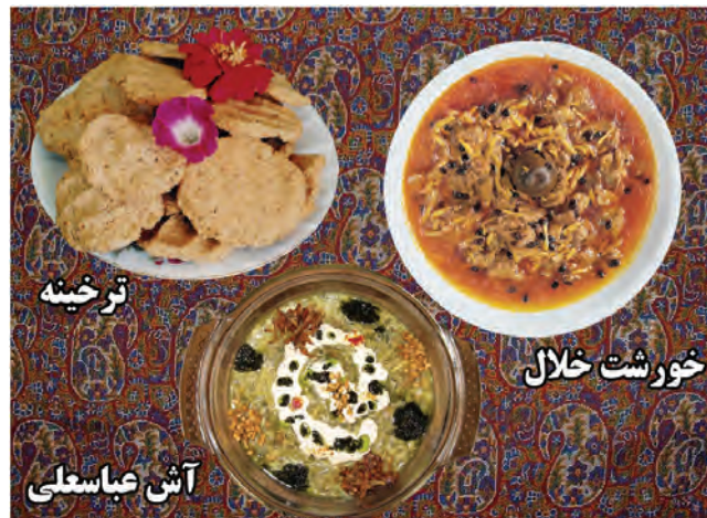
شکل ۳-۳- برخی از غذاهای محلی استان کرمانشاه

بیشتر غذاهای رایج در استان همان‌هایی هستند که در اکثر نقاط کشور رواج دارند ولی برخی از خوراک‌ها و شیرینی‌ها نیز ویژه این استان بوده و از تنوع و شهرت خاصی برخوردار است. از جمله می‌توان به موارد زیر اشاره کرد: برخی از غذاهای محلی استان کرمانشاه شامل: دنده کباب، خورش خلال، پلو کشمش، دانه کولانه، بورانی کنگر، پلو شویت، قورمه، هلیسه، آش غوره، بُورانی چغندر، آش ترخینه، آش عدس، دلمه، خورش کدو حلوایی و شیرینی‌ها شامل: نان برنجی، نان خرمايي، کاک، بژی (پرساق) و حلوا است. در بین انواع شیرینی‌ها نان برنجی و کاک و نان خرمايي از شیرینی‌های مشهوری است که در سطح کشور به عنوان سوغات استان کرمانشاه شناخته شده‌اند؛ چنانکه روغن حیوانی کرمانشاه نیز در تمام کشور جایگاه ویژه‌ای دارد.