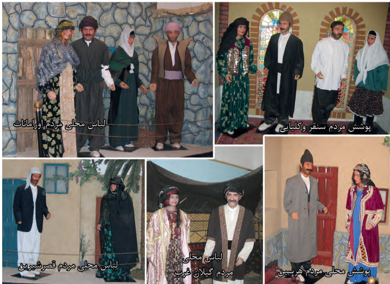
شکل ۲-۳- لباس های محلی مردم استان کرمانشاه (موزه مردم شناسی واقع در تکیه معاون الملک)