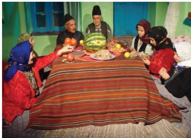
شکل ۳-۳- نمونه‌ای از مراسم شب چله در روستا

یلدا به عنوان طولانی‌ترین شب سال که به چله نیز معروف است، در استان زنجان هم مانند سایر استان‌ها از حال و هوای ویژه‌ای برخوردار است. به طوری که اهالی استان، برای پذیرایی و برگزاری مراسم خاص آن با خرید آجیل، هندوانه، و میوه‌های مختلف و شیرینی به استقبال این شب طولانی می‌روند. همچنین خانواده داماد برای عروس، با تهیه هدایایی همراه با خوراکی‌های این شب که در مجموعه‌ای به نام «خونچا» گردآوری کرده‌اند به دیدار خانواده عروس می‌روند. در این شب بزرگترها با شاهنامه خوانی و قصه‌های شیرین ایرانی اعضای خانواده را سرگرم کرده و این شب را گرمی می‌دارند.