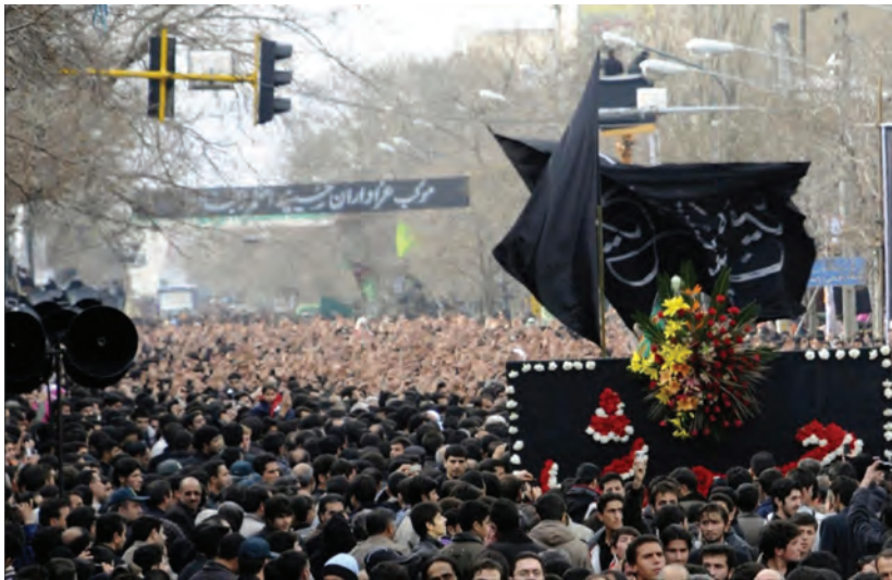
شکل ۳-۶- مراسم عزاداری حسینیه اعظم زنجان

و خیل عظیمی از شیعیان جهان نظاره‌گر آن هستند. این مراسم در اسفند سال ۱۳۸۷ (هشتم محرم سال ۱۴۳۰ هجری قمری) به‌عنوان دهمین میراث معنوی کشور به ثبت ملی رسیده است. شیبیه‌خوانی یا تعزیه: نوع دیگری از عزاداری‌های رایج در استان است که مردم استان در شهرها و خصوصاً در اکثر روستاها با اجرای آن به عزاداری ائمه اطهار علیهم السلام می‌پردازند. شهر ارمغان‌خانه در اجرای تعزیه در استان شهرت خاصی دارد.