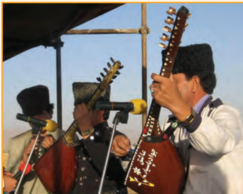
شکل ۳-۵- موسیقی محلی استان

موسیقی بومی استان زنجان از گنجینه موسیقی فولکلوریک و کلاسیک آذری تأثیر پذیرفته است و در حال حاضر نیز وجه غالب ترکیب موسیقی بومی، به‌ویژه مناطق روستایی استان را تشکیل می‌دهد. پیوستگی فرهنگی و قومی مردم استان با مردم آذری زبان از یک‌سو و ارتباط آن با منطقه‌هایی، غیر از زبان آذری از سوی دیگر، زمینه شکل‌گیری نوعی از موسیقی محلی ویژه را فراهم آورده است، که به موسیقی زنجانی معروف