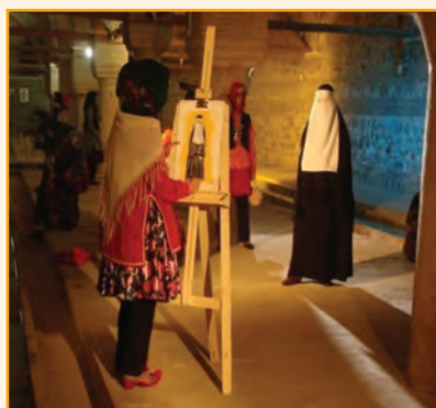
شکل ۳-۴- نمونه‌ای از لباس‌های محلی استان