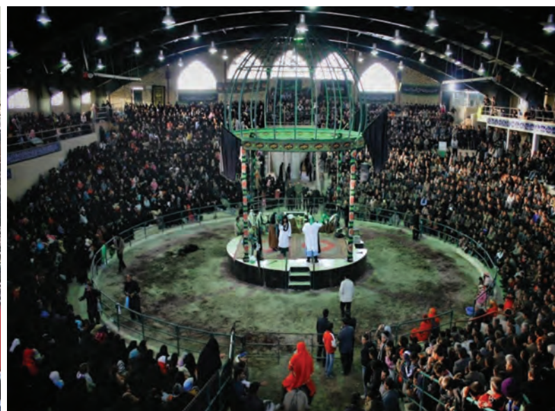
شکل ۳-۷- مراسم تعزیه در شهر ارمغان‌خانه