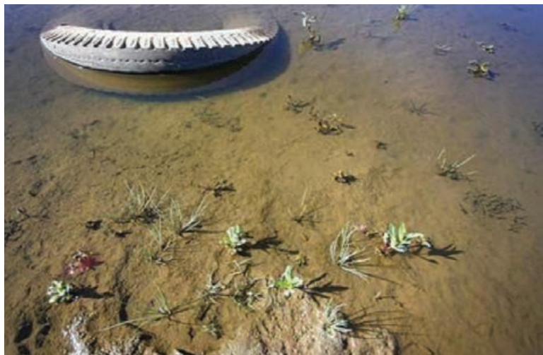
شکل ۸۰-۱- آلودگی آب ها بر اثر ریختن زباله به داخل آن

فاضلاب ها و زباله های شهری (خانگی و بیمارستانی)، کشاورزی و صنعتی، عمده ترین عوامل آلوده کننده آب های سطحی و زیرزمینی استان محسوب می شوند. سالانه بیش از ۵۰ میلیون مترمکعب فاضلاب شهری به عرصه های زیست محیطی وارد می شود. در فاضلاب های شهری باکتری های بیماری زای فراوانی وجود دارد که اگر باروش های مناسب نابود یا دفع نگردند، در محیط باقی می ماند و خطرهای جدی برای انسان به بار می آورند. فاضلاب های کشاورزی نیز به دلیل همراه داشتن سموم آفت کش و کودهای شیمیایی به صورت محلول، در روان آب های کشاورزی باقی می ماند