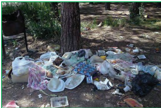
شکل ۸۲-۱- ریختن زباله در محیط

خاک، بستر حیات و زیستگاه بسیاری از موجودات و یکی از مهم‌ترین اجزای محیط طبیعی ماست که زمینه تأمین مواد غذایی مورد نیاز انسان و سایر جانوران را فراهم می‌کند. استان ما از توان بسیار بالایی در زمینه کشاورزی برخوردار است و بیشتر فعالیت‌ها در بخش کشت و زرع، باغداری و پرورش دام صورت می‌گیرد. امروزه توسعه این فعالیت‌ها موجب به‌کارگیری انواع کودهای شیمیایی و سموم دفع آفات نباتی در این بخش شده و استفاده گسترده از این مواد، موجبات آلودگی خاک را فراهم کرده است. از طرفی اقداماتی نظیر آبیاری با فاضلاب‌های شهری، ریختن زباله‌ها در محیط و آتش‌زدن بقایای محصولات کشاورزی، موجب آلودگی و تضعیف خاک‌های استان شده است.