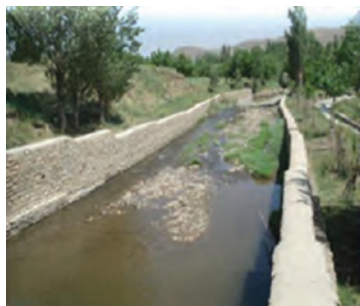
شکل ۱-۶۴- دیوار حاشیه رودخانه