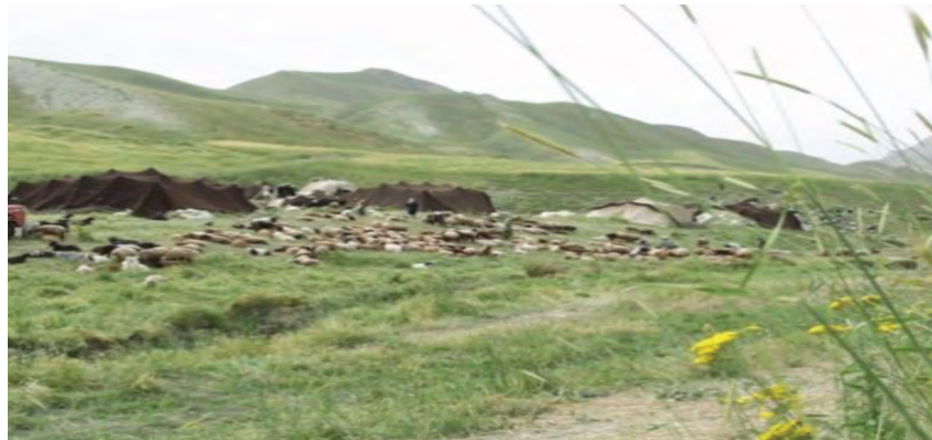
شکل ۵۷-۱- تغذیه دام عشایر