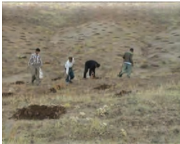
شکل ۱-۶۲- کپه‌کاری

عملیات مدیریتی: شامل حفاظت و قرق مراتع، تعیین سیاست‌های چرای تناوبی و مدیریت چرا و ترویج و آموزش بهره‌برداران.