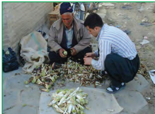
شکل ۵۸-۱- برداشت کنگر از مراتع