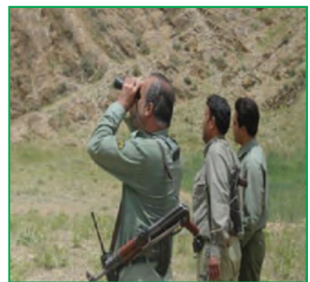
شکل ۱-۷۲- محیط‌بانان سازمان حفاظت از محیط زیست

بررسی کنید که در سال‌های اخیر کدام یک از گونه‌های گیاهی و جانوری محل زندگی شما از بین رفته است؟ نتیجه را به کلاس ارائه دهید.