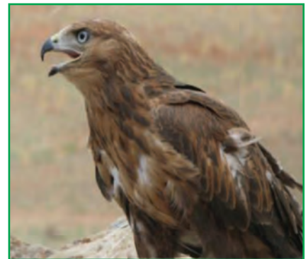
شکل ۱-۷۱- عقاب طلایی