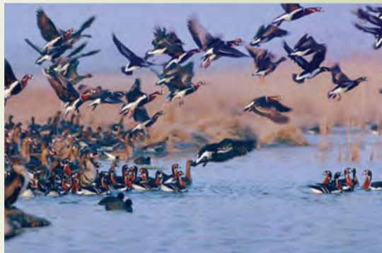
شکل ۱-۷۵- منطقه شکار ممنوع - شیرین سو

منطقه شکار ممنوع : منطقه شکار ممنوع نیز همچون مناطق حفاظت شده دارای شرایط مناسب جهت حفظ و تکثیر گونه‌های مختلف گیاهی و جانوری‌اند و با نظارت سازمان حفاظت محیط زیست دارای ممنوعیت شکار و صید، قطع درختان و آسیب‌رساندن به محیط است.