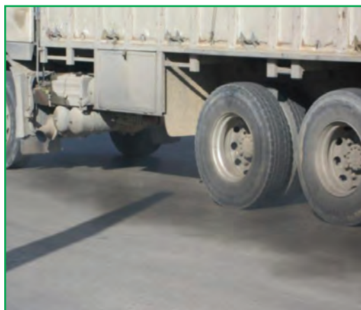
شکل ۲۹-۱- آلودگی هوا - خودروها

سهم وسایل نقلیه در آلودگی هوا بیشتر از دیگر منابع آلاینده است. از دیگر منابع آلوده کننده هوای استان می توان به صنایع آسفالت، ریخته گری، سیمان، کوره های آجرپزی و ... اشاره کرد.