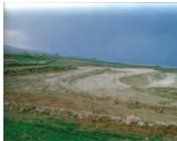
شکل ۱-۶۵- تراس بندی