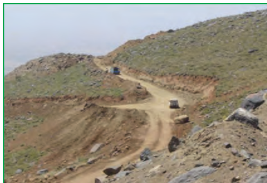
شکل ۵۹-۱- احداث راه در مراتع