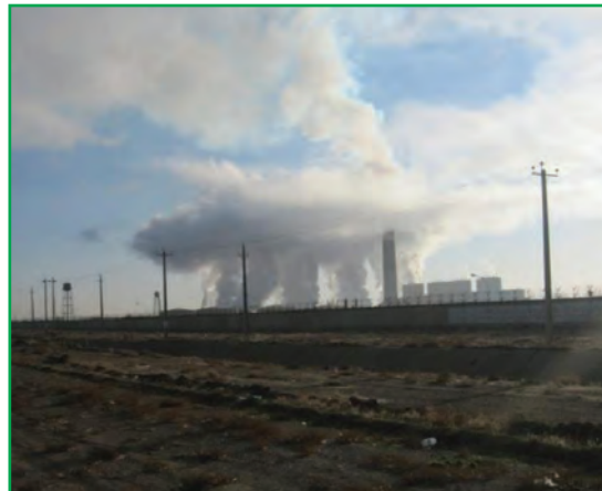
شکل ۲۸-۱- آلودگی هوا - صنایع