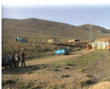
شکل ۱-۶۷- مدیریت و نظارت بر چرا