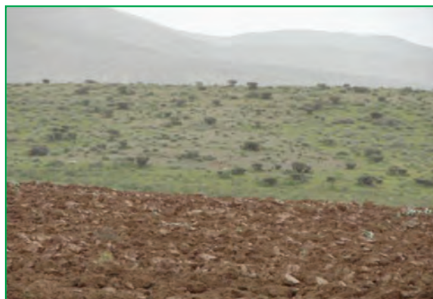
شکل ۶۰-۱- تبدیل مراتع به زمین کشاورزی