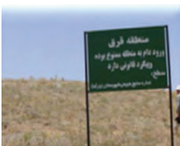
شکل ۱-۶۸- حفاظت و قرق مراتع