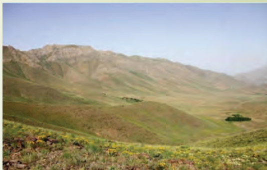
شکل ۱-۷۴- منطقه حفاظت شده لشگردر - ملایر

منطقه حفاظت شده لشگردر : این منطقه در جنوب شرقی شهر ملایر و در ۹۰ کیلومتری شهر همدان در محاصره ۱۴ روستای مجاور از جمله جوزان، مانیزان، فروز، ازناوله، زنگنه و احمد روغنی است و به لحاظ طبیعت مساعد از نظر آب، پوشش گیاهی و شرایط اقلیمی، همواره زیستگاه مناسبی برای جانوران و پرندگان است.