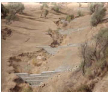
شکل ۱-۶۳- بند گابیونی (سنگ‌ها در تور سیمی)