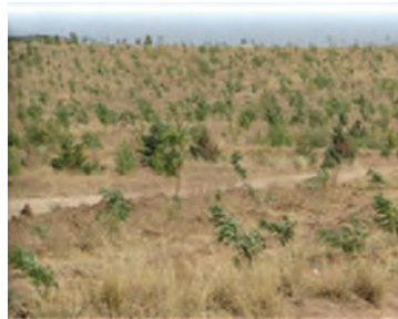
شکل ۱-۶۱- نهال‌کاری