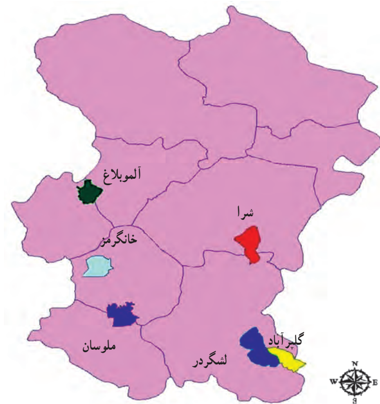
شکل ۱-۷۰- نقشه مناطق حفاظت شده استان

استان ما در حال حاضر، دارای ۶ منطقه مهم حفاظت شده است که عبارت‌اند از: گلپرایاد، خان‌گرمز، لشگردر، شرا، الموبلاغ، ملوسان و دو منطقه شکار ممنوع شیرین سو و و آق‌گل. (نقشه ۱-۷۰)