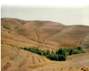
شکل ۱-۶۶- احداث بانکت بندی