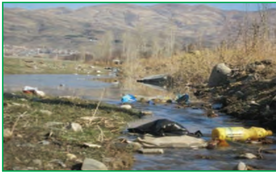
شکل ۸۱-۱- فاضلاب‌های شهری در بستر رودخانه‌ها

و به چرخه آب برمی‌گردند که باعث آلودگی آب و خاک می‌شوند. در اثر فعالیت‌های تولیدی و صنعتی در کارخانجات و واحدهای صنعتی استان نیز فاضلاب صنعتی تولید می‌شوند و در نتیجه مقدار قابل توجهی از مواد شیمیایی خطرناک را وارد آب‌های سطحی و زیرزمینی می‌کنند.