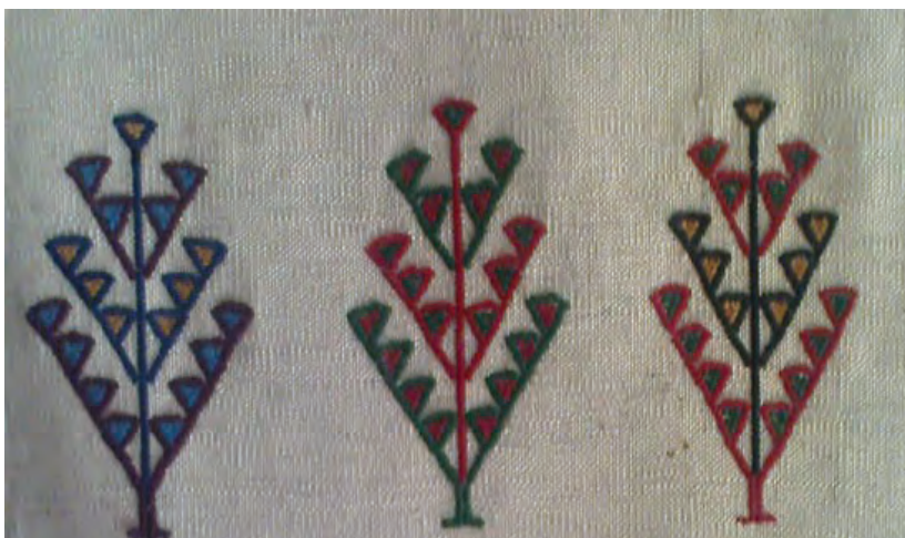
بخشی از یک گلیم سوزنی تصویر ۳-۱ ▲

آیا تاکنون گلیم سوزنی دیده‌اید؟ فکر می‌کنید چرا به این نوع گلیم سوزنی می‌گویند؟ تصویر ۳-۱ را مشاهده کنید. این تصویر یک گلیم سوزنی است. اکنون سعی کنید از روی