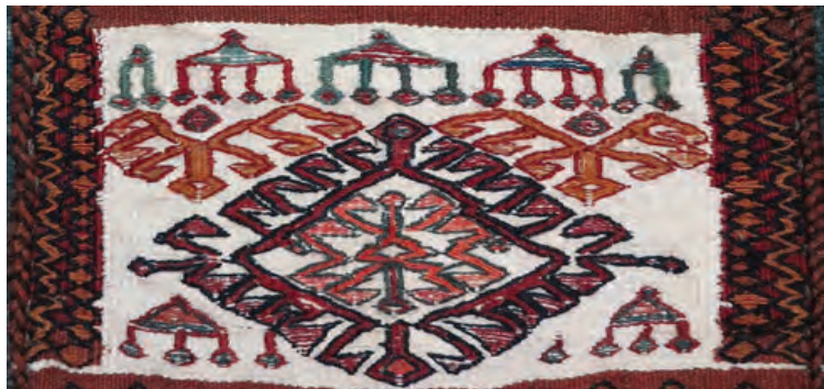
▲ تصویر ۳-۸ بخشی از یک گلیم سوزنی که داخل نقوش با نخ‌های پشمی رنگی پر شده است

۶- داخل نقش‌ها با دوخت رنگی پر می‌شوند. پس از پایان دوخت خطوط اطراف نقش‌ها، داخل آنها به روش قایقی رج به رج پر می‌شود. برای این کار یک ردیف دوخت را با دست راست و ردیف دیگر را با دست چپ انجام می‌دهند. (برای