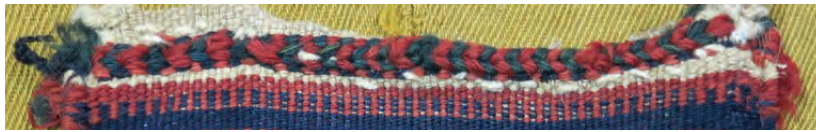
نمونه سربندی قایقی تصویر ۲-۳ ▲

در هنگام تمام شدن پود رنگی در میانه بافت، پود رنگی جدید روی کدام چله درگیر می شود؟ چرا؟