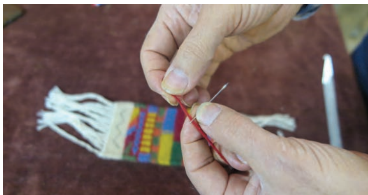
▲ تصویر ۳-۶ نخ کردن سوزن با پود رنگی

۴- چند سوزن را که با پود در رنگ مورد نیاز نخ شده است، آماده می‌کنند.