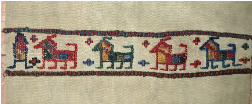
بخشی از یک گلیم سوزنی ظریف تصویر ۳-۳ ▲

پس از پایان سربندی، بافت بدنه اصلی گلیم برای سوزنی آغاز می شود. باید دانست که بدنه اصلی گلیم را به روش گلیم ساده می بافند. ضمناً غیر از گلیم عبوری یا پود معلق از انواع گلیم ساده نیز می توان به عنوان زمینه گلیم سوزنی استفاده نمود. گلیم های سوزنی زمینه یک رنگ یا چند رنگ