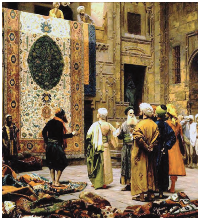
تابلوی نقاشی، نمایش یک فرش ایرانی در بازارهای خارجی

فرش بازنمایی از جلوه‌های آفرینش خداوند است که به دست انسان بافته و تولید می‌شود. بسیاری از این فرش‌ها با نقشه‌ها و نام‌هایی مشخص به ثبت جهانی رسیده‌اند که از افتخارات هنر ایران است. تولید و بافت هر فرش نیازمند طرح و نقشه‌هایی است. این طرح‌ها و نقشه‌ها به دو شکل ذهنی و ترسیمی تهیه می‌شوند. نقشه‌های ذهنی نیازی به ابزار و وسایل خاصی ندارد، ولی نقشه‌های ترسیمی امروزه به دو روش دستی و رایانه‌ای اجرا می‌شود. امروزه به‌منظور حفظ و اشاعه نقشه‌های اصیل ایرانی که در فرش‌های قدیمی بافته شده‌اند، گروهی از افراد با ذوق و ماهر آنها را نسخه‌برداری کرده و در اختیار بافندگان قرار می‌دهند.