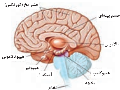
شکل ۱- برش از ساختار داخلی مغز

۴ هیپوکامپ: بخشی از سیستم لیمبیک است و نقش ویژه‌ای در ذخیره‌سازی حافظه دارد.