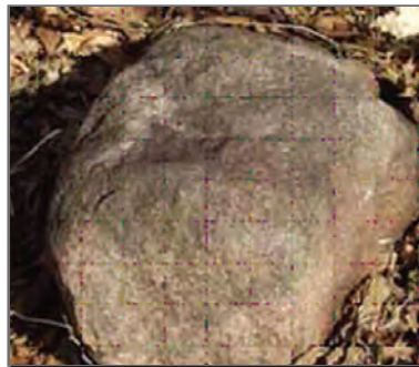
۱- جلبک‌هایی در منافذ سنگ مستقرند