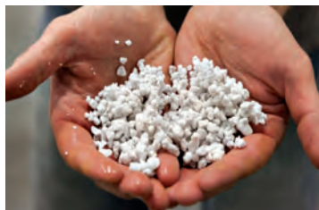
پرلیت مورد استفاده در بستر کشت

پرلیت: این ماده معدنی منشأ آتشفشانی دارد. این مواد را از گدازه‌های آتشفشان جمع‌آوری نموده و سپس در کوره‌های مخصوص دوباره حرارت می‌دهند. در اثر خروج رطوبت از این گدازه‌ها آن را تبدیل به دانه‌های بسیار سبکی می‌کند که کاملاً ضد عفونی می‌باشد. این ماده خنثی بوده و فاقد هر ماده غذایی می‌باشد. ولی معمولاً باعث افزایش تهویه در محیط‌های کشت می‌شود و در ترکیب با بقیه بسترها به کار می‌رود.